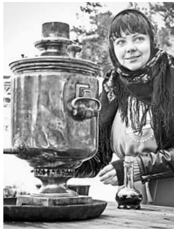
Чай на сибирских травах и ягодах.