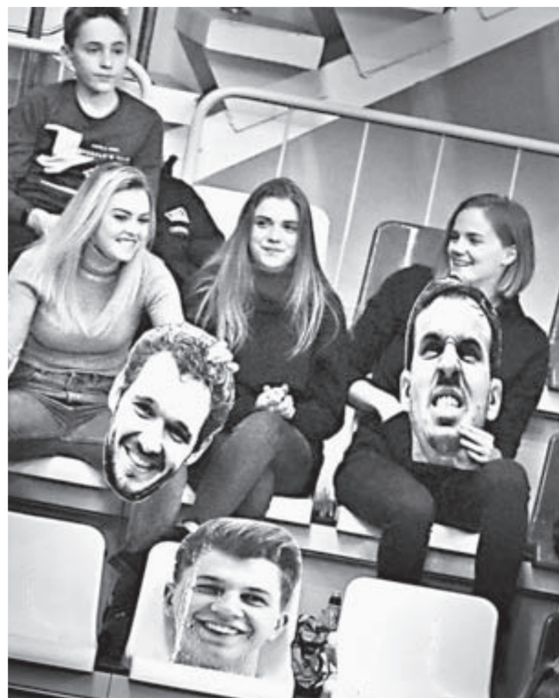
Новая «фишка» болельщиц – «болеие» с портретами любимых игроков.

В дальнейшем барнаульцы контролировали ход матча и, разумеется, радовали зрителей эффектными моментами. Уже к середине второй десяти минутки «АлтайБаскет» выигрывал 20 очков, и рулевой хозяев,