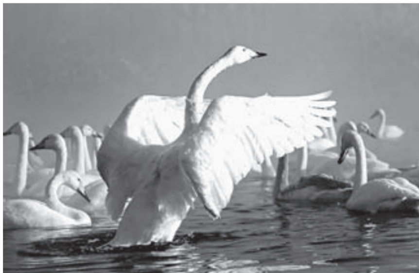
Лебеди – символ праздника.