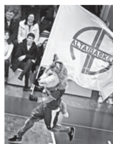
Талисман «АлтайБаскета» Волк Ди запустил на трибунах «волну».