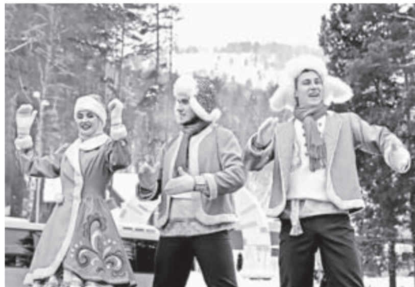
На сцене выступили более 70 артистов.