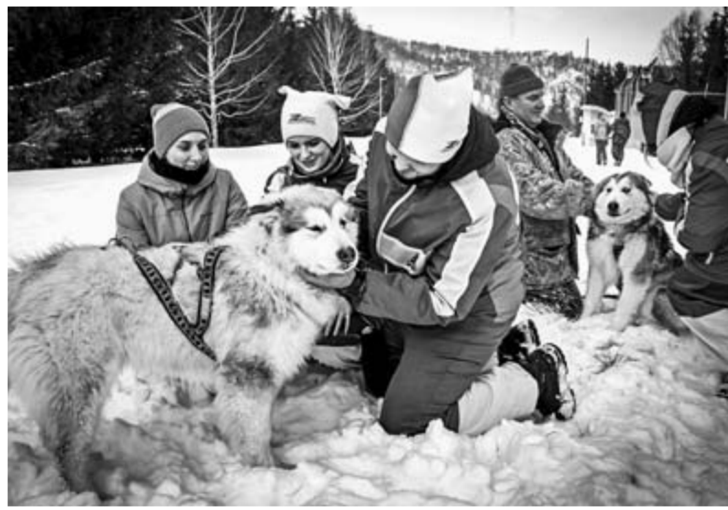
Фото с маламутами – северными ездовыми собаками.

Фестиваль «Гастрономическая карта России» в нашем регионе прошел впервые. В один ряд на празднике выстроились специальные вагончики, оборудованные для готовки самых изысканных ресторанных блюд. Лучшие шеф-повара края готовили и предлагали на пробу гостям праздника не просто авторскую еду, а снедь, которая претендует стать