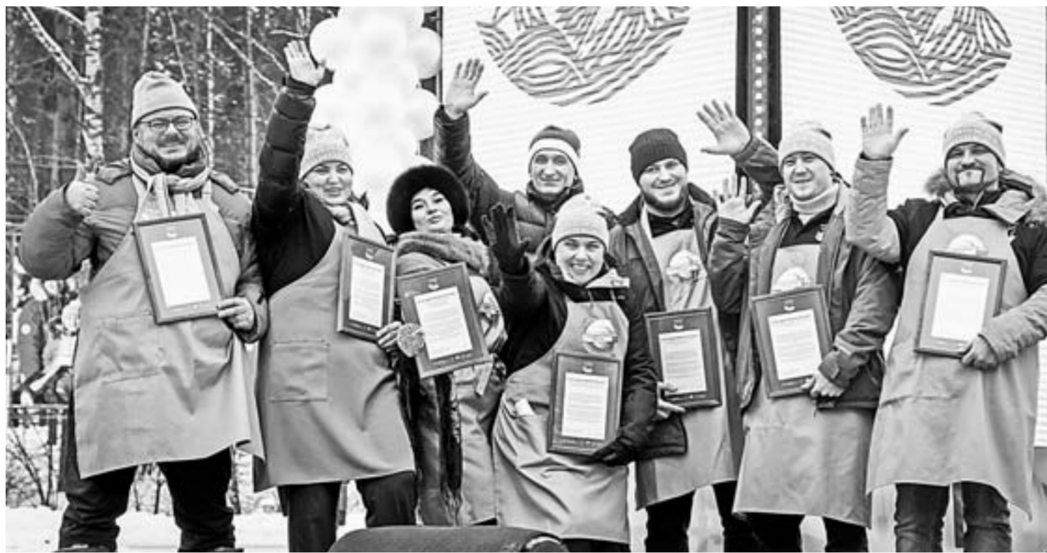
Награждение участников фестиваля «Гастрономическая карта России».