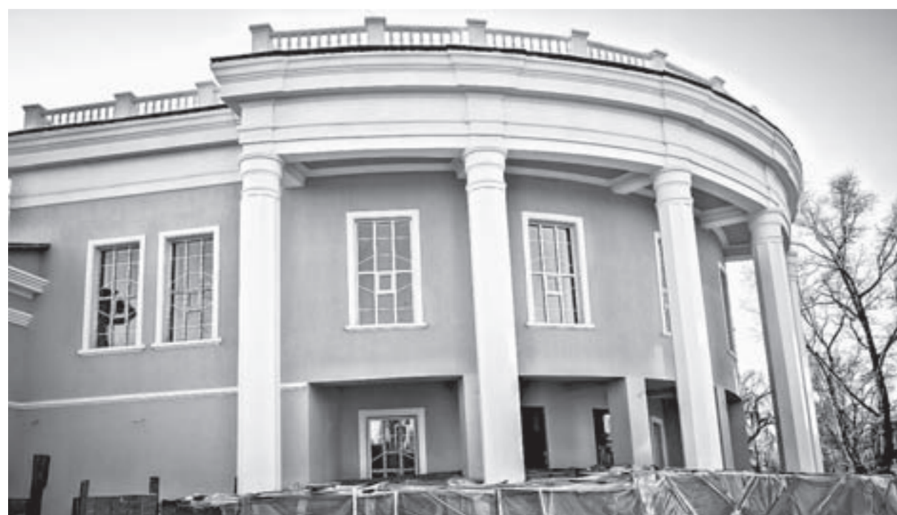
Фасад драмтеатра уже окрашен в новый цвет.