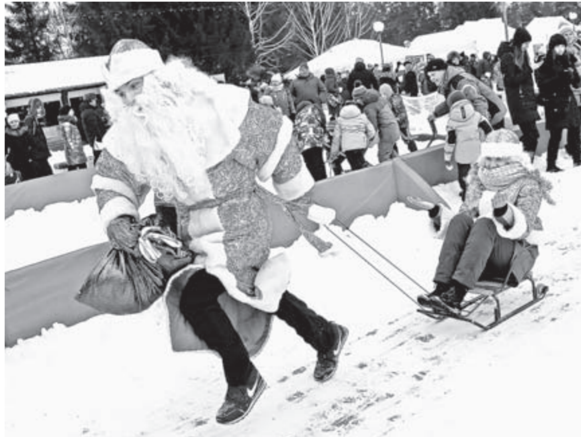
Традиционный забег Дедов Морозов.