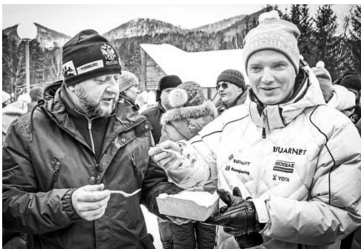
Вице-губернатор Денис Губин и депутат Госдумы Даниил Бессарабов на дегустации.