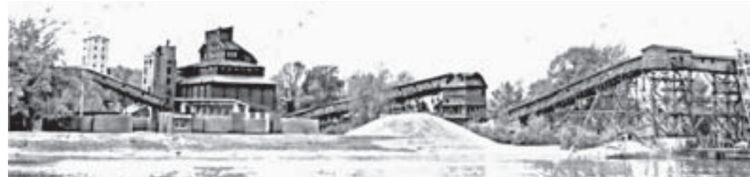
Уникальный элеватор Нондратюка.

оставивший каменцам в память о себе уникальный мастодонт – самое крупное в ту пору деревянное зернохранилище на 13 тысяч тонн, построенное без единого гвоздя. Уроженец поселка Толстовского Виталий Проскурин прославился фундаментальными работами в теории движения планет и космических аппаратов. Именно он рассчитывал траектории полета космических кораблей Юрия Гагарина, Германа Титова и других космонавтов.