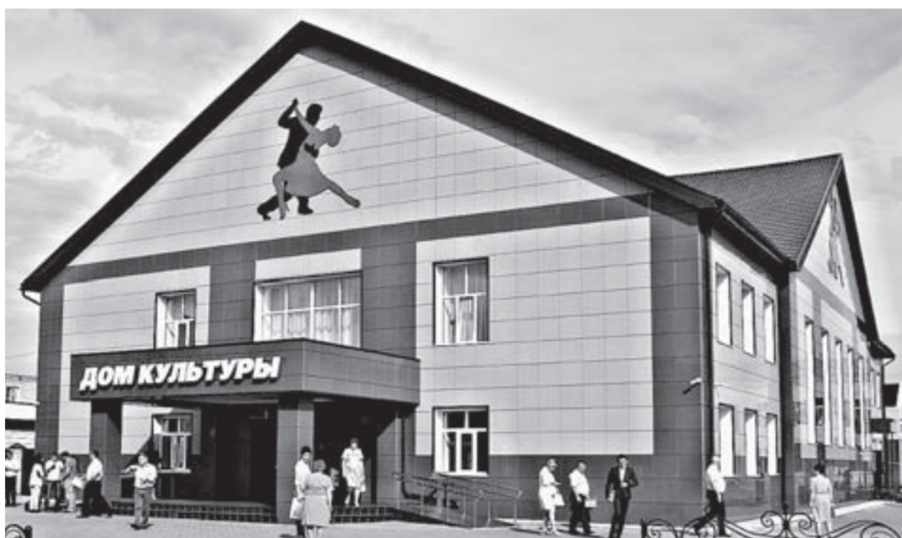
Расходы на реконструкцию и на ремонт учреждений культуры Алтайского края ежегодно растут.