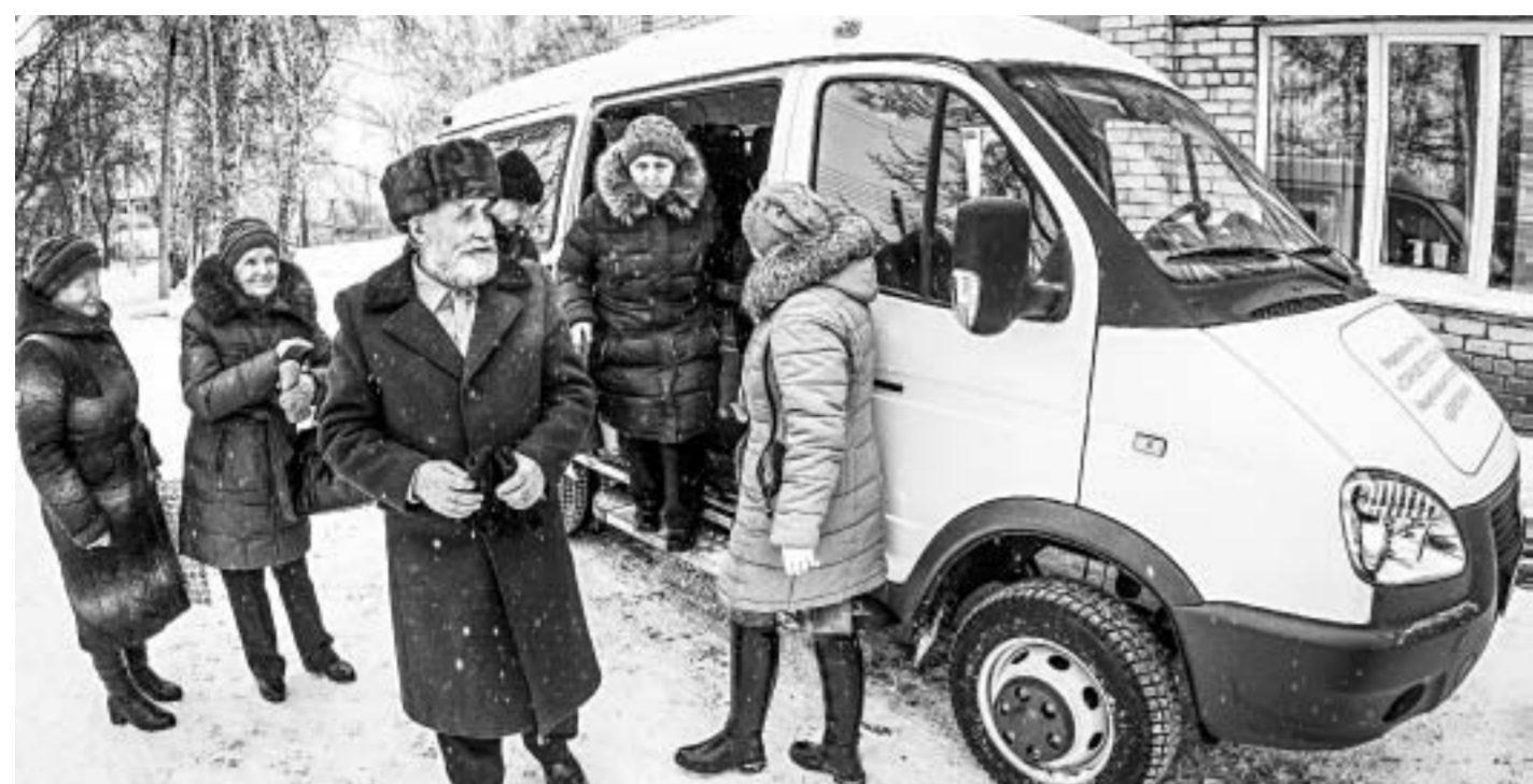
В ЦРБ приехали пенсионеры села Урюпино.