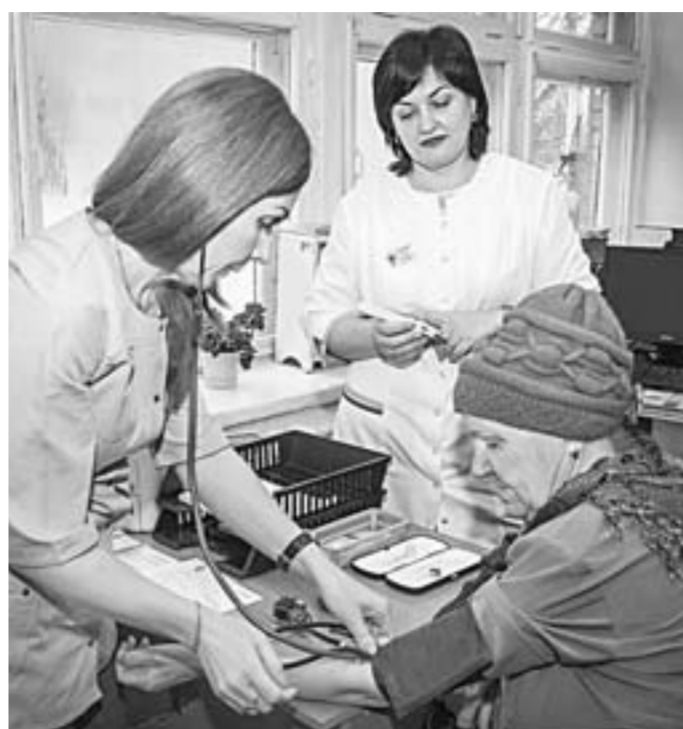
Приём в отделении медпрофилактики.

Заболел – иди к врачу. Аксиому эту, казалось бы очевидную, не разделяют многие сельчане, особенно пожилые. Для жителей Алейского района, например, каждая поездка становилась настоящим испытанием. Но на наших глазах ситуация меняется к лучшему. С 1 января 2020 года там запускают «больничный трансфер».