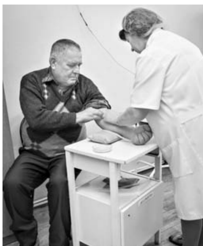
Диспансеризация начинается с обследования.

В отделении медицинской профилактики урюпинцев