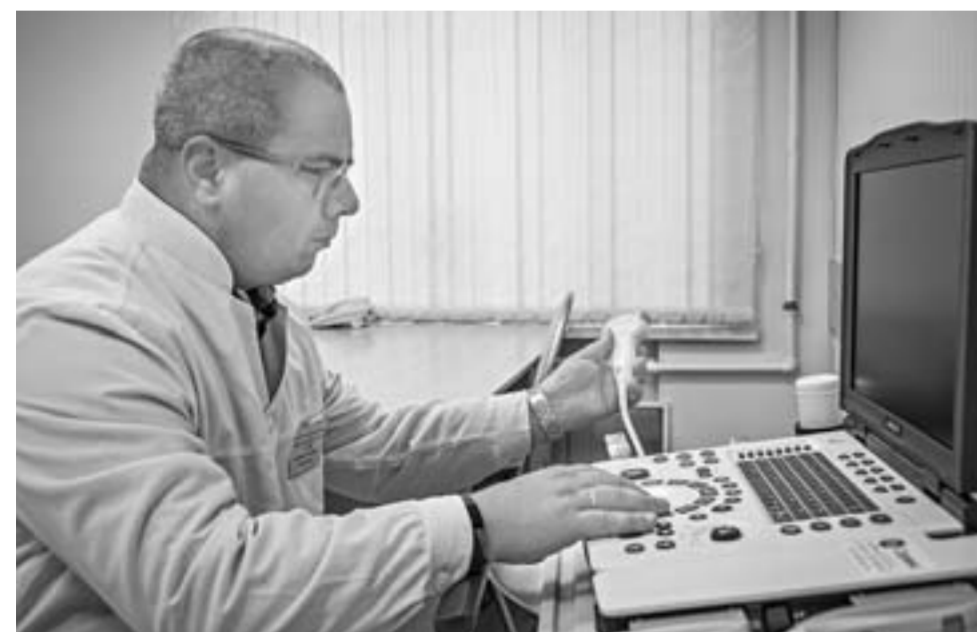
Новый УЗИ-аппарат для Благовещенской детской поликлиники уже работает.