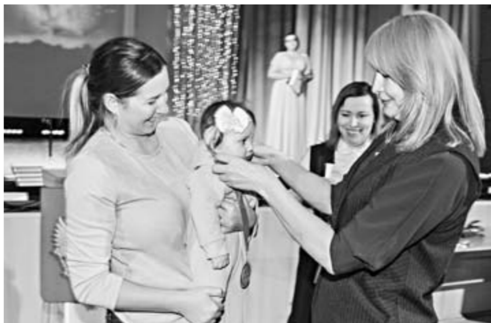
Вручение медали одному из малышей, родившемуся в Сибирском.