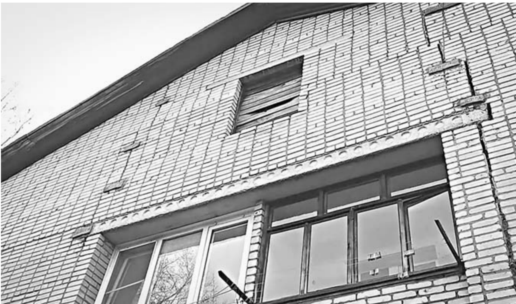
Трещины в стенах видны невооруженным глазом.

Как призналась жительница, ночевать в квартире сегодня страшно, а ведь еще и зима на носу.