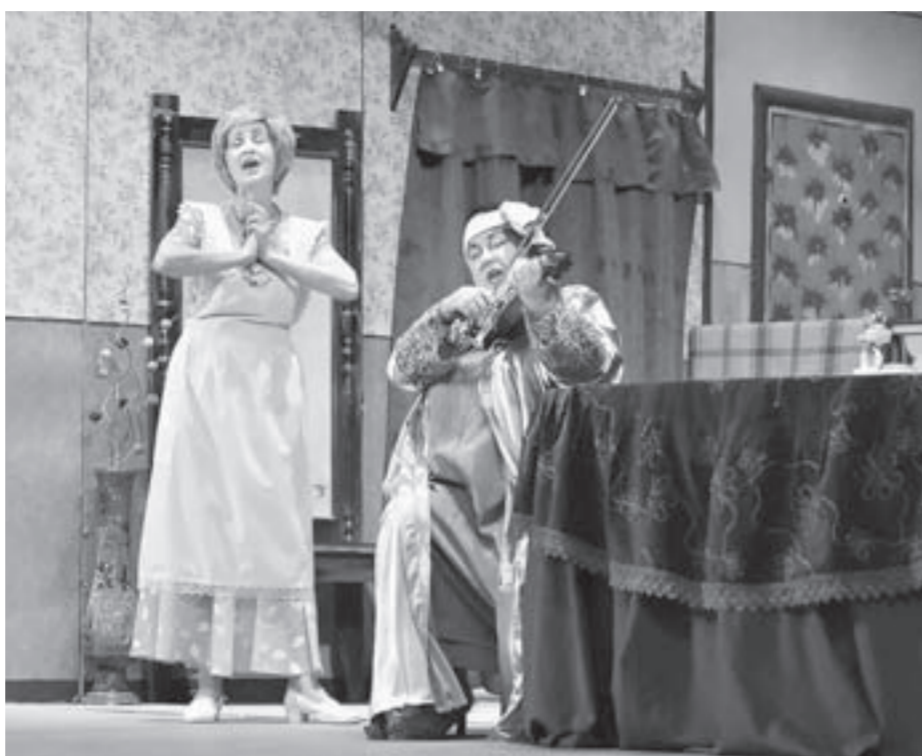
Казахские зрители с восторгом приняли показы постановок Рубцовского драмтеатра.

Рубцовский драматический театр вернулся с гастролей в городе Усть-Каменогорске Республики Казахстан. Всего за три дня рубцовские артисты показали восемь спектаклей, которые посмотрели около двух с половиной тысяч человек.