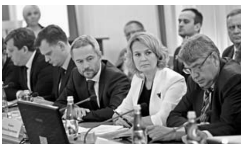
Совещание прошло с участием руководителей профильных министерств и ведомств.

— Мы действительно очень серьезно продвинулись в разработке проектов индивидуальной программы, — сказал губернатор. — В ходе работы над документом у нас было много спорных и сложных дискуссий с различными ведомствами. Все они детально обсуждались. На сегодняшний день утверждена методика подготовки документов и нам понятен окончательный вид этой индивидуальной программы. В соответствии с ней мы подготовили перечень первоочередных мероприятий, которые могли бы быть реализованы в течение пяти лет. Общий объем финансирования превышает 10 млрд рублей.