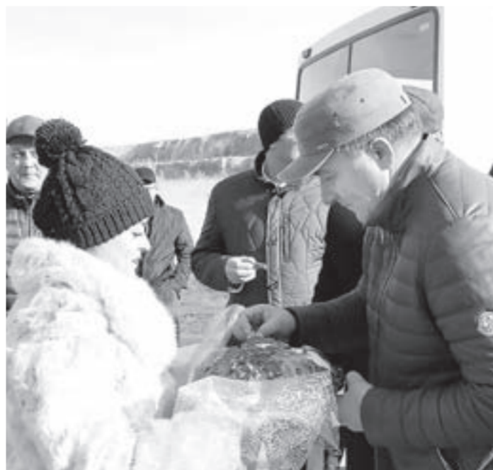
Хлеб-соль для участников торжества.

то понемногу: слишком трудоемкой оказалась добыча щебня. Но началось строительство Алеиской оросительной системы, возникла необходимость в новых автомобильных дорогах, и, как следствие, на карьер в