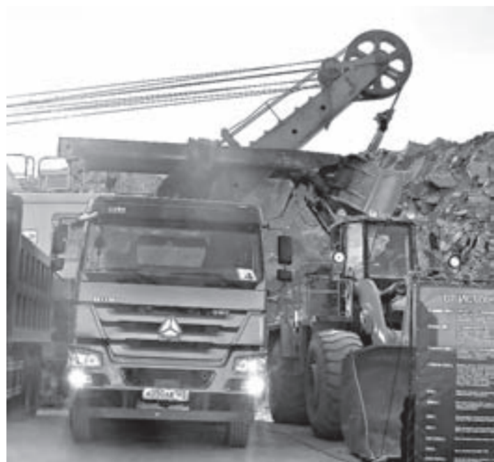
На смену приходит современная экономичная техника.

Веселоярский щебеночный завод отметил свое 60-летие. К этой круглой дате он подошел с рекордными показателями производства: более 400 тыс. тонн щебня разных фракций. К концу года цифра должна увеличиться до 450.