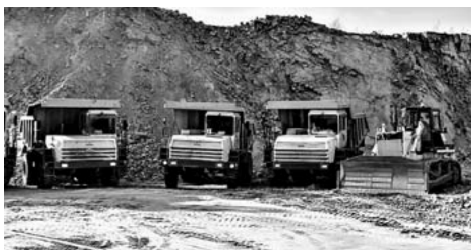
На карьере работает 30 единиц техники.

В праздничный день для гостей организовали экскурсию на карьер с пре-