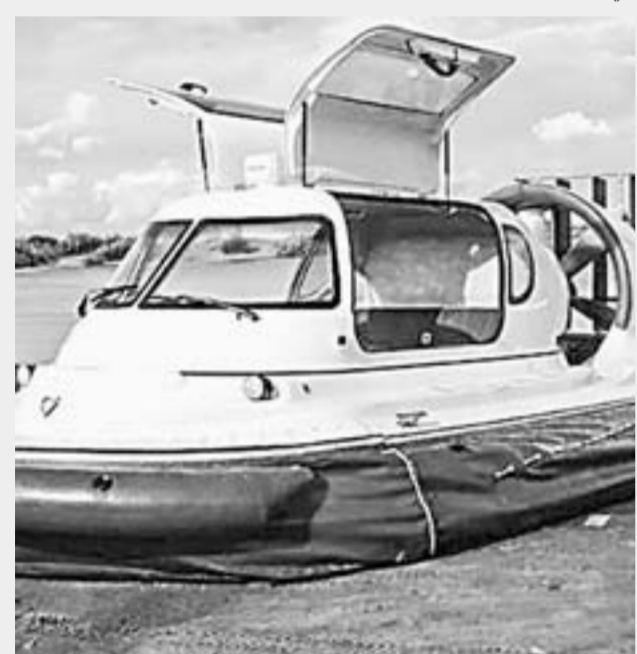
Пока проезд на катере будет бесплатным.