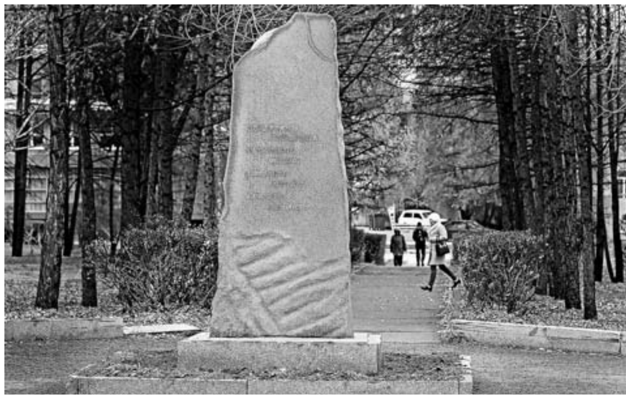
На месте нынешнего закладного камня вскоре может появиться памятник вдовам фронтовиков.

и баба, и мужик» – женщина прошла весь этот страшный путь, памятник нужно ставить ей. «Эта смиренная баба двужилна, как Русь. Знаю, вынесет все, за неё не боюсь. Надо – вспашет полмира, надо – выждит бой. Я горжусь, что и мы тоже бабы с тобой!» – так писала про нее Юлия Друнина.