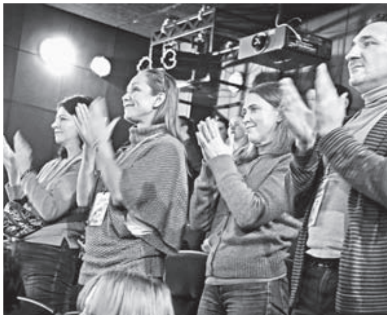
Четыре спектакля в афише фестиваля были предназначены для взрослой публики.