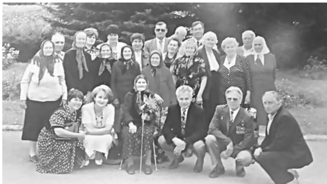
Участники 1-го слета вдов героев Великой Отечественной войны. Начало 90-х.