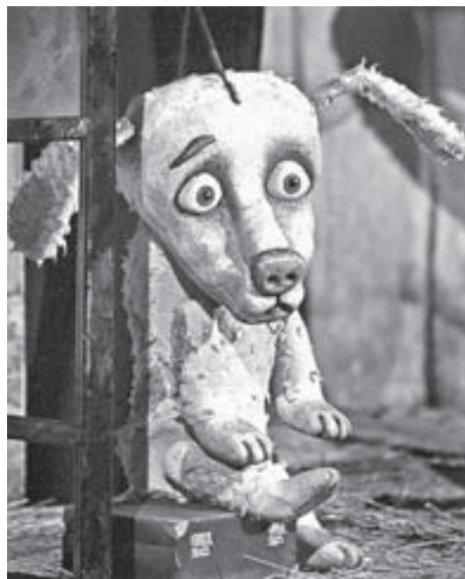
Главный герой спектакля «Бах-бах-бах» теряет и ищет друга.