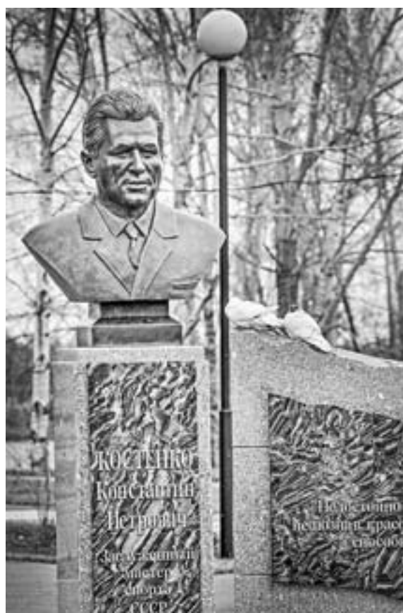
Бюст легенды отлит из бронзы.