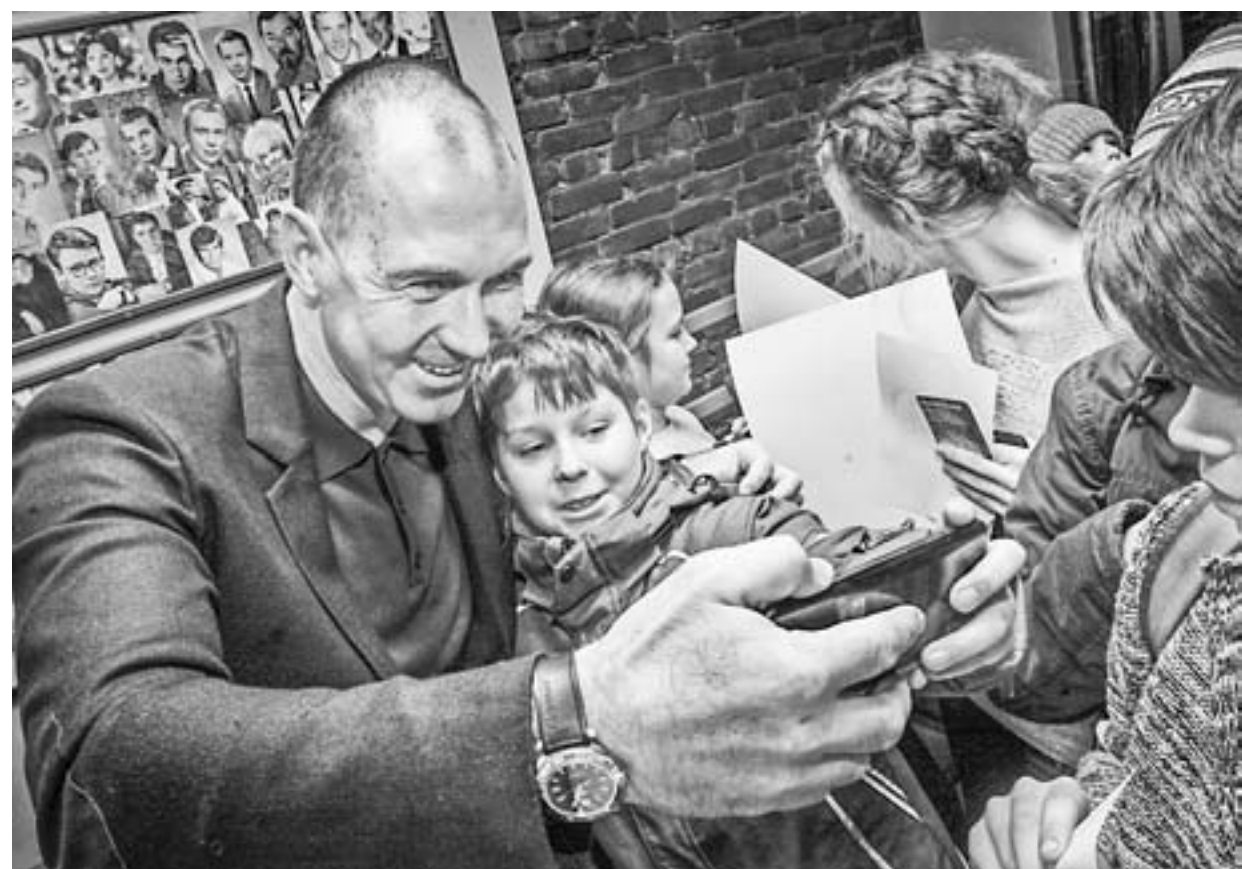
Самый титулованный российский гребец Максим Опалев с одним из юных поклонников.