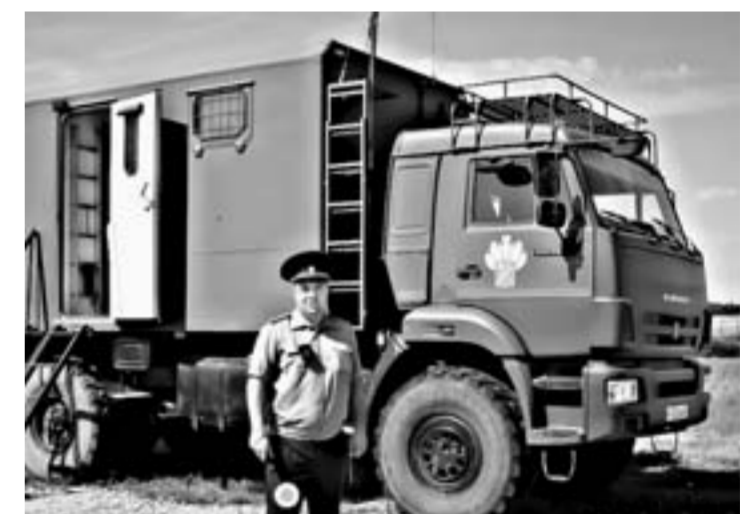
Мобильный пункт готов к работе.