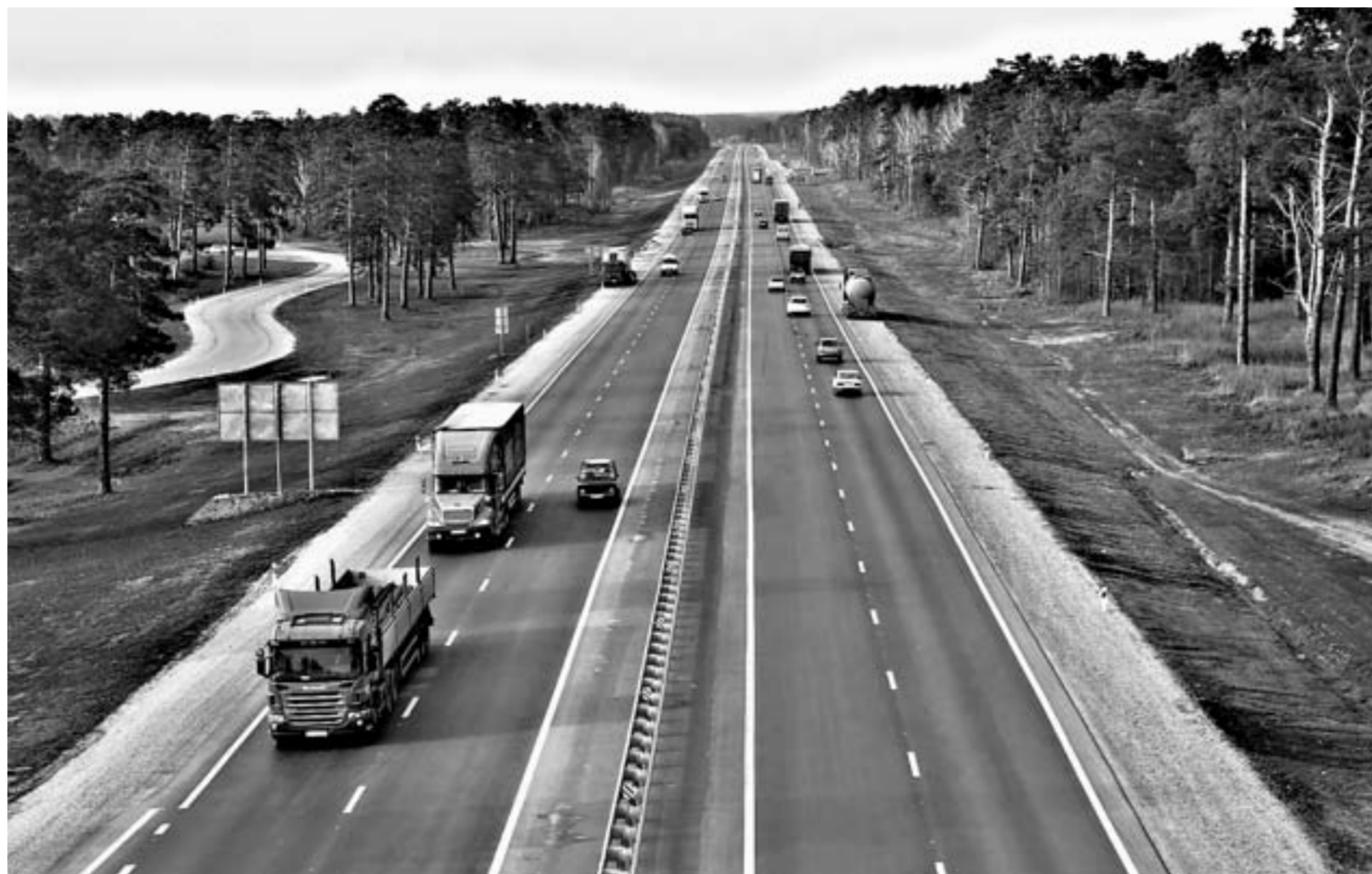
Работы проводились более чем на 200 автодорогах.

— Аварийность снижается, но возрастает тяжесть ДТП, — заявил Дементьев. — Мы строим новый участок и уже понимаем, что там будет повышенная скорость движения. Приходится сразу устанавливать камеры и искусственные неровности. Но и это