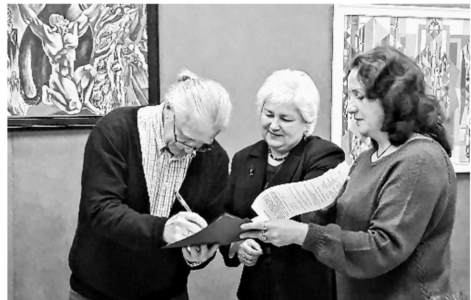
Автограф от известного живописца.

Идея построить беседку на месте, где стоял родовой дом Константиновых, принадлежит инициативной группе села. Курьянцы выиграли краевой конкурс проектов поддержки местных инициатив, и сегодня на берегу озера в Курье красуется новенькая беседка со скамей-