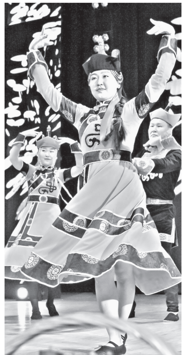
Во время концерта.