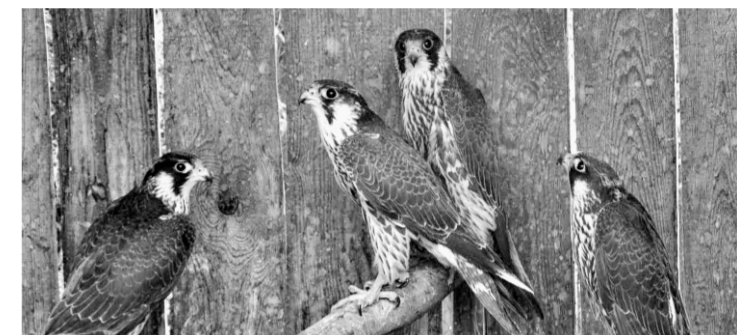
Сейчас птицам ничего не угрожает.

Торговать сапсанами запрещено во всем мире. Дикие сапсаны ценятся охотниками на пернатую дичь в арабских странах.