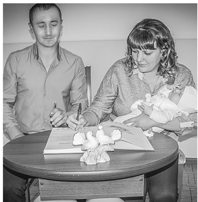
Семья Коршуновых из Советского района.