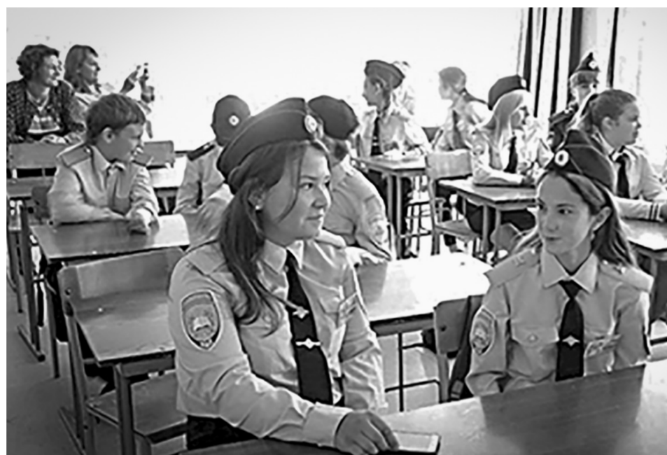
Профильный класс в школе села Косиха.