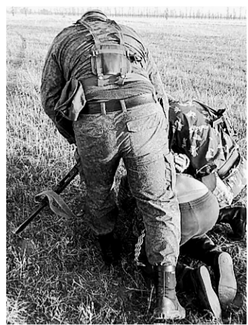
Преступникам грозит лишение свободы и штраф.

Силовики возбудили уголовное дело о незаконной добыче и обороте особо ценных диких животных, занесенных в Красную книгу РФ. Преступникам грозит до трех лет лишения свободы и штраф до 1 млн рублей. Ущерб от контрабанды оценили в 4 млн рублей.