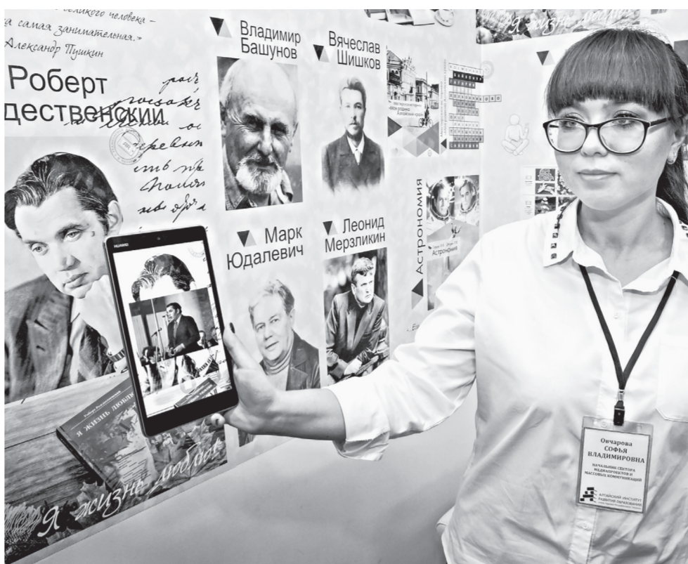
В Алтайском институте развития образования внедряют современные технологии.

17 октября в Барнауле обновили экспозицию «Педагогическая слава Алтай» перед зданием Алтайского института развития образования имени Адриана Топорова.