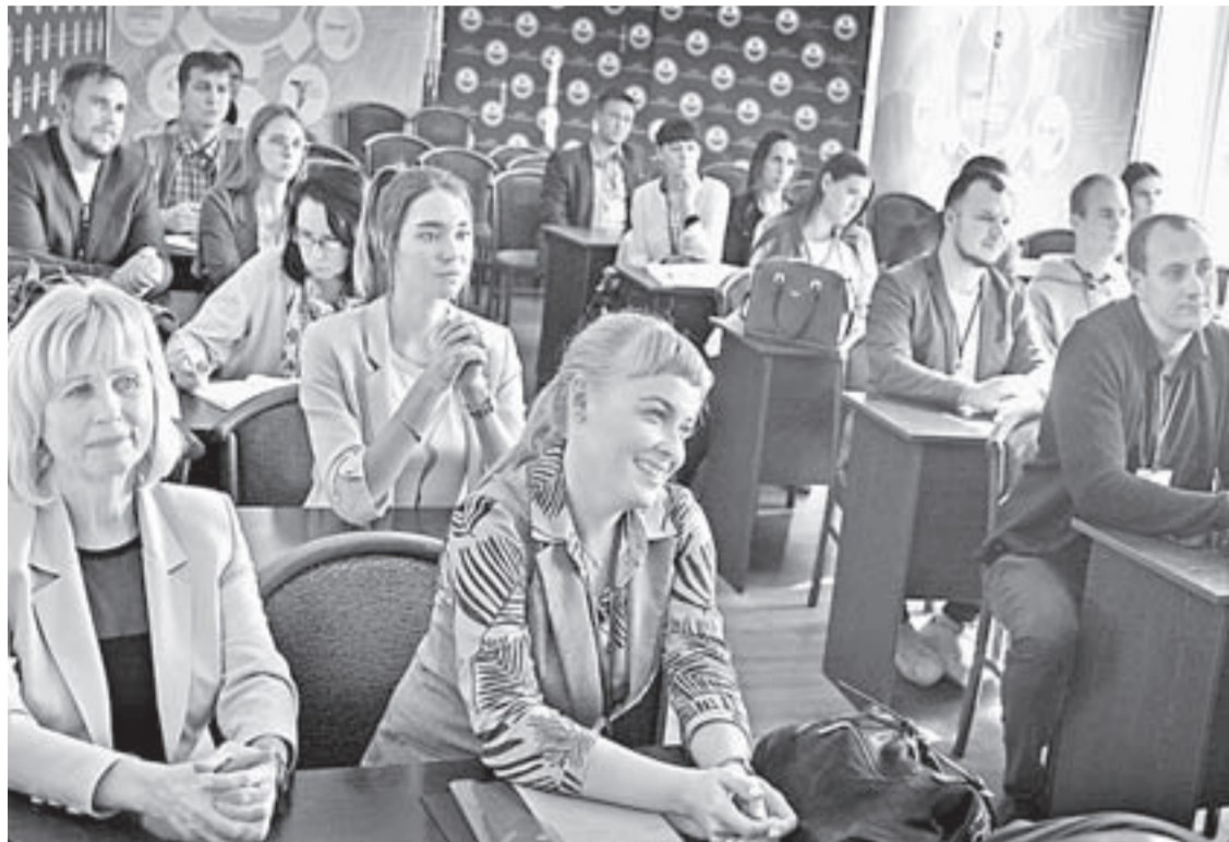
В конкурсе участвовало 24 предпринимателя.

Лучших молодых предпринимателей региона выбрали в Барнауле. Победители отправятся на всероссийский этап конкурса в Казань.