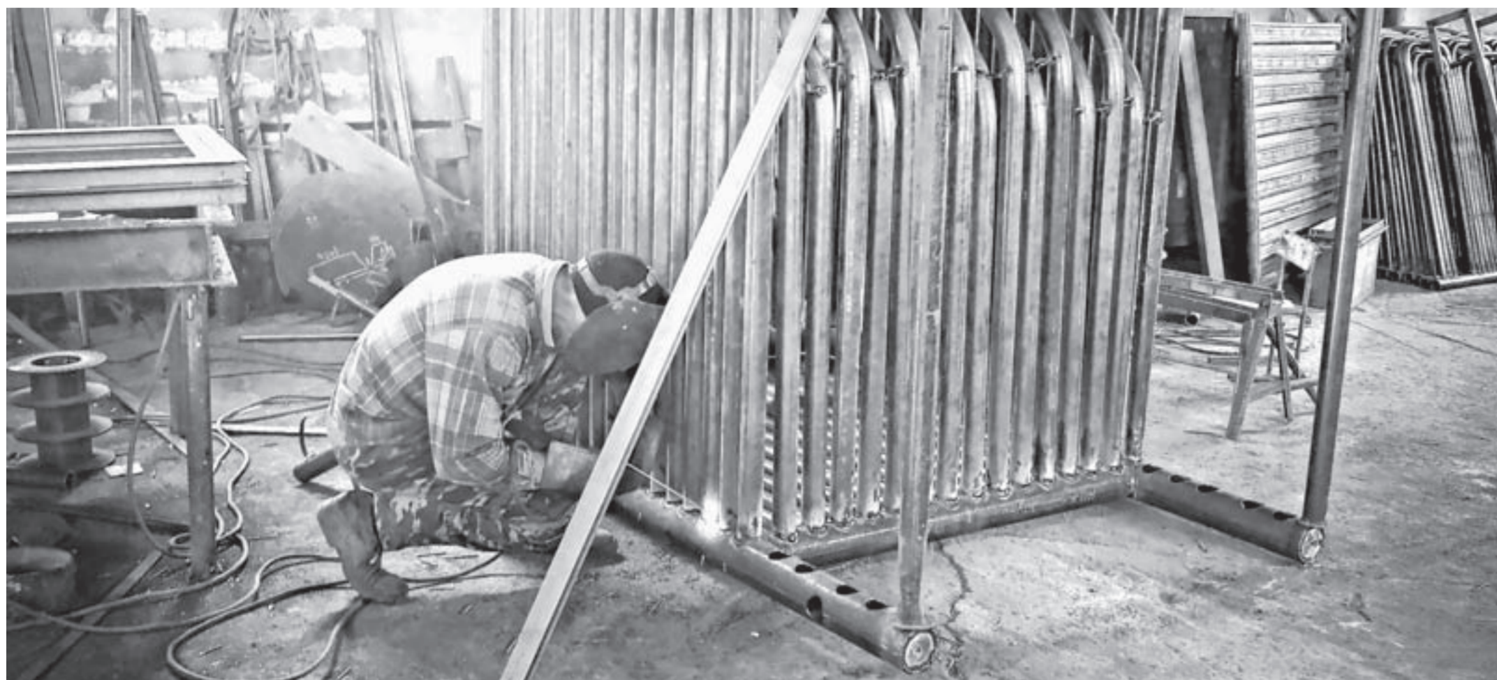
В цехе «Алтайводсервиса» идет работа.

В Барнауле сформированы запас материально-технических ресурсов и резерв оборудования для оперативного устранения аварий на объектах ЖКХ во время очередного отопительного сезона.