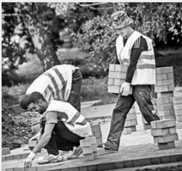
Осталось сделать лицевую часть фонтана.