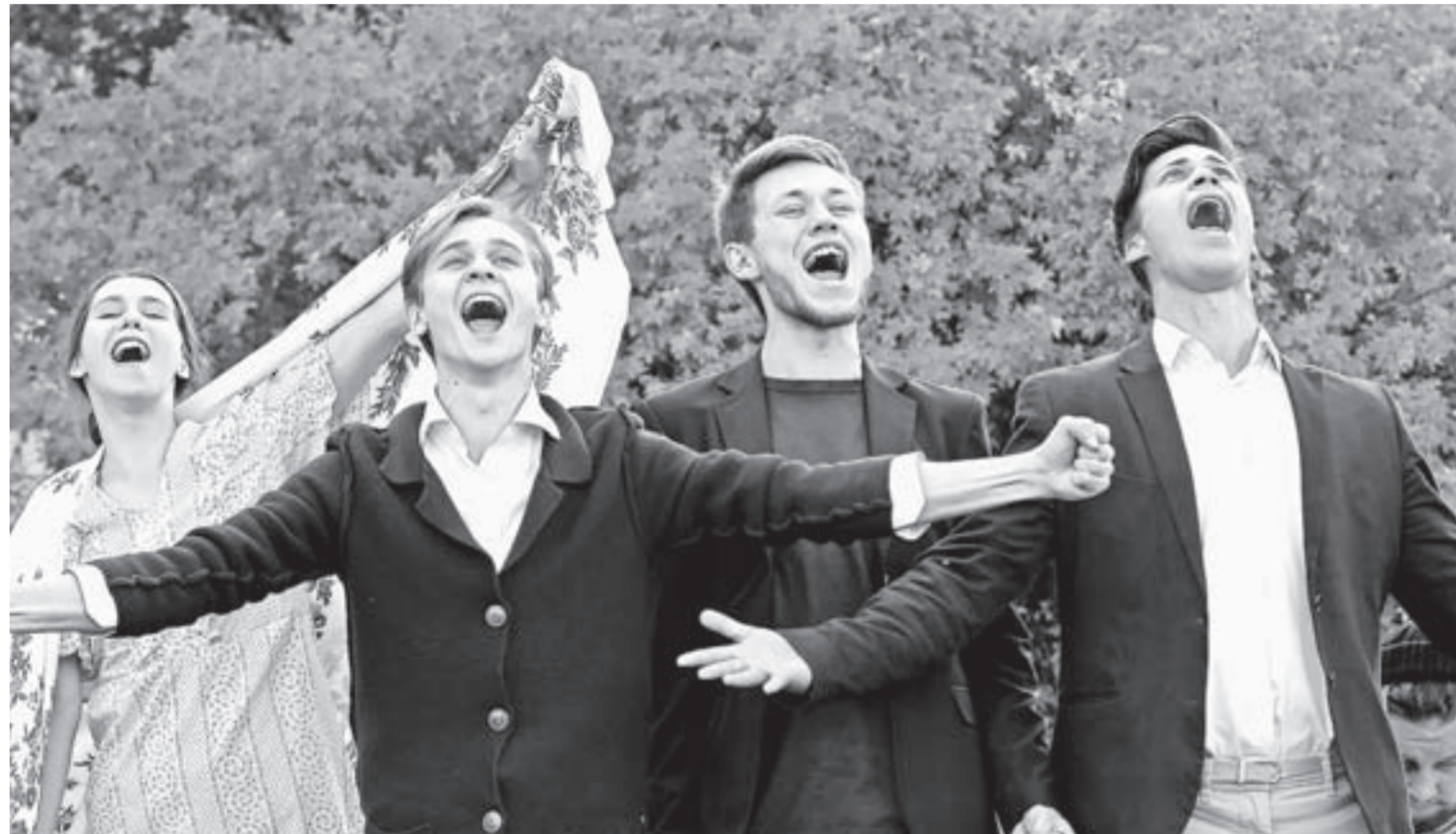
Открытие прошло в формате open-air и стало праздником для горожан.