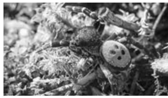
Ядовитые пауки похожи на божьих коровок.