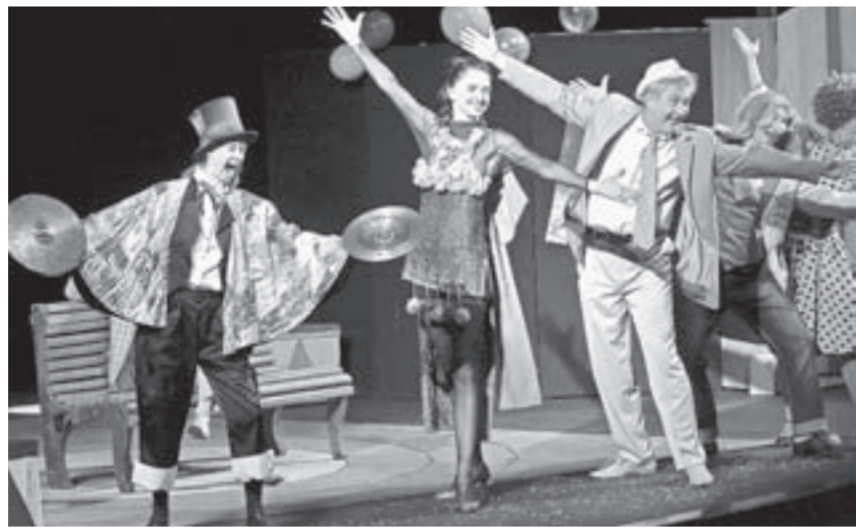
Сцена из спектакля «...и ЦИРК!» театра «У Никитских ворот».

Открытие 9-дневного марафона искусства прошло в стиле open-air: перед краевым театром драмы силами артистов и студентов АГИК был воссоздан мир произведений Шукшина, населенный его героями. В театре объясняют, что такой фестиваль – событие не только для театралов и знатоков творчества писателя, но и для всех земляков Василия Макаровича, и потому он не должен был ограничиваться рамками сцены.