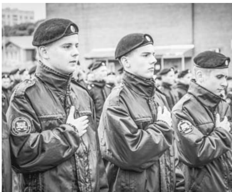
84 мальчика вступили в Алтайский надетский корпус.

Кулундинцы продолжают активно обсуждать, в каких селах какие объекты строить и ремонтировать по программе поддержки местных инициатив. За время действия программы в районе