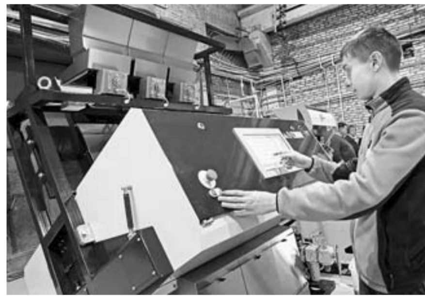
Предприятие «СиСорт» – одно из успешных в крае, развивающихся в том числе при господдержке.

Заниматься популяризацией предпринимательства в регионах будут 149 команд, которые создадут из муниципальных органов власти и организаций инфраструктуры.