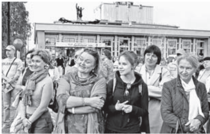
Зрители готовы возвращаться к творчеству Шукшина снова и снова.