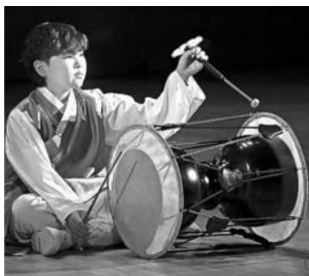
Юные музыканты молодежной группы «Соль Хьянг» из южнокорейского города Каннин выступили на этой неделе в Барнауле.

Название коллектива переводится как «Утренняя свежесть Восточного моря». На Алтай ансамбль приехал в рамках культурного сотрудничества между нашим краем и Республикой Корея. На сцене концертного зала «Сибирь» ребята исполнили балладу «Гарьён», «Песнь четырех времен года» и «Песнь о богатом урожае», а также современную корейскую музыку на таких традиционных инструментах, как каягым, тэгым и пири. Коллектив «Соль Хьянг» был создан в 2016 году при поддержке регионального отделения Корейской ассоциации традиционной музыки в городе Каннин.