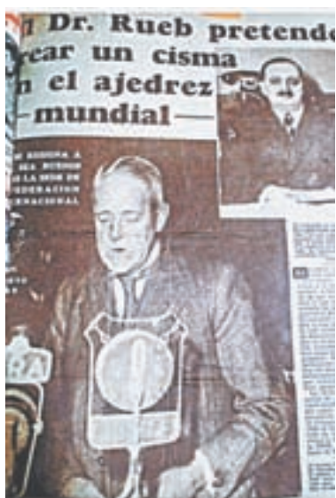
Присланный ведущему «Игротеки» из Аргентины коллаж: Рюэб держит речь на Конгрессе ФИДЕ в Буэнос-Айресе, в правом углу – фото избранного на этом конгрессе премьера Рюэба Аугусто де Мура.

80 лет назад, 19 сентября 1939 года, в столице Аргентины Буэнос-Айресе завершилась 8-я Всемирная шахматная олимпиада, занимающая особое место в истории подобных масштабнейших соревнований. А особенность этой Олимпиады в том, что в самый ее разгар, когда дошло дело до финальных матчей команд, прошедших через сито отборочных олимпийских турниров, в Европе запылала Вторая мировая война.