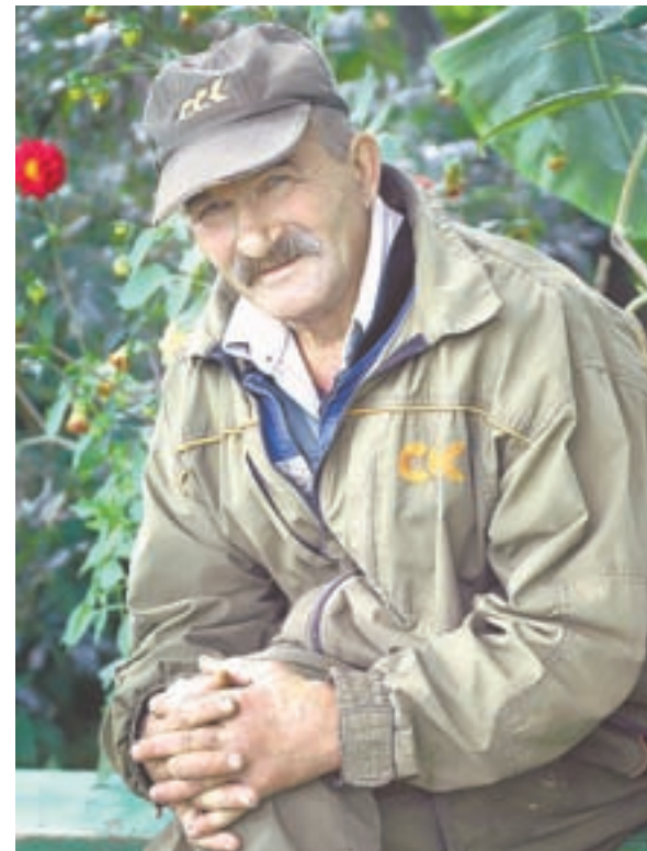
Хозяин базы: «У нас горы знаменитые».