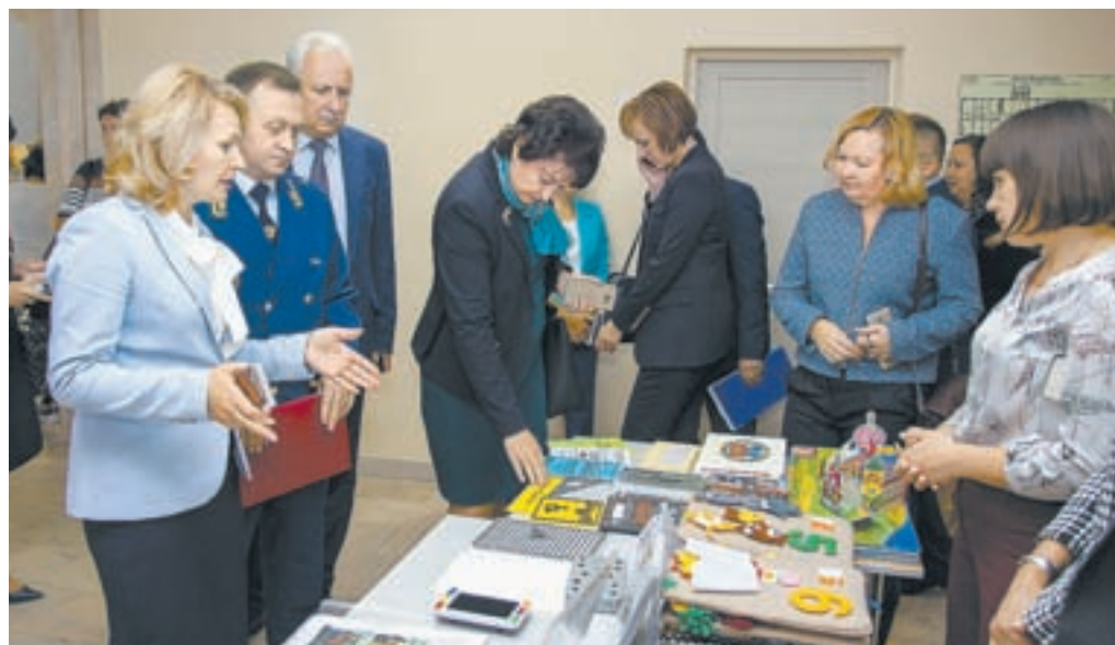
Представители различных ведомств объединяют ресурсы поддержки «особых» людей.