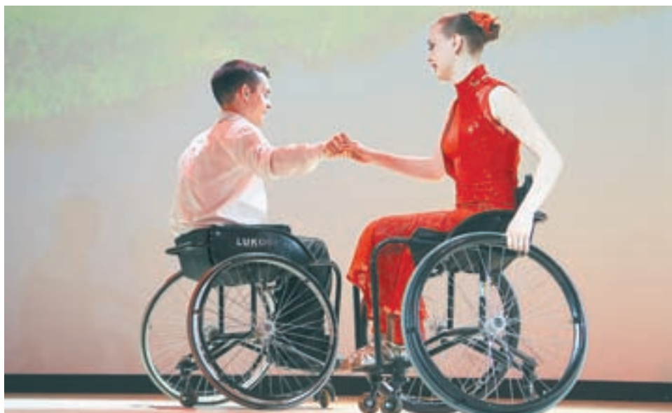
Инвалидность не приговор.