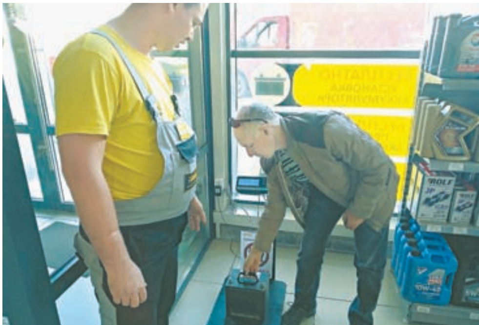
Прием старых аккумуляторов.