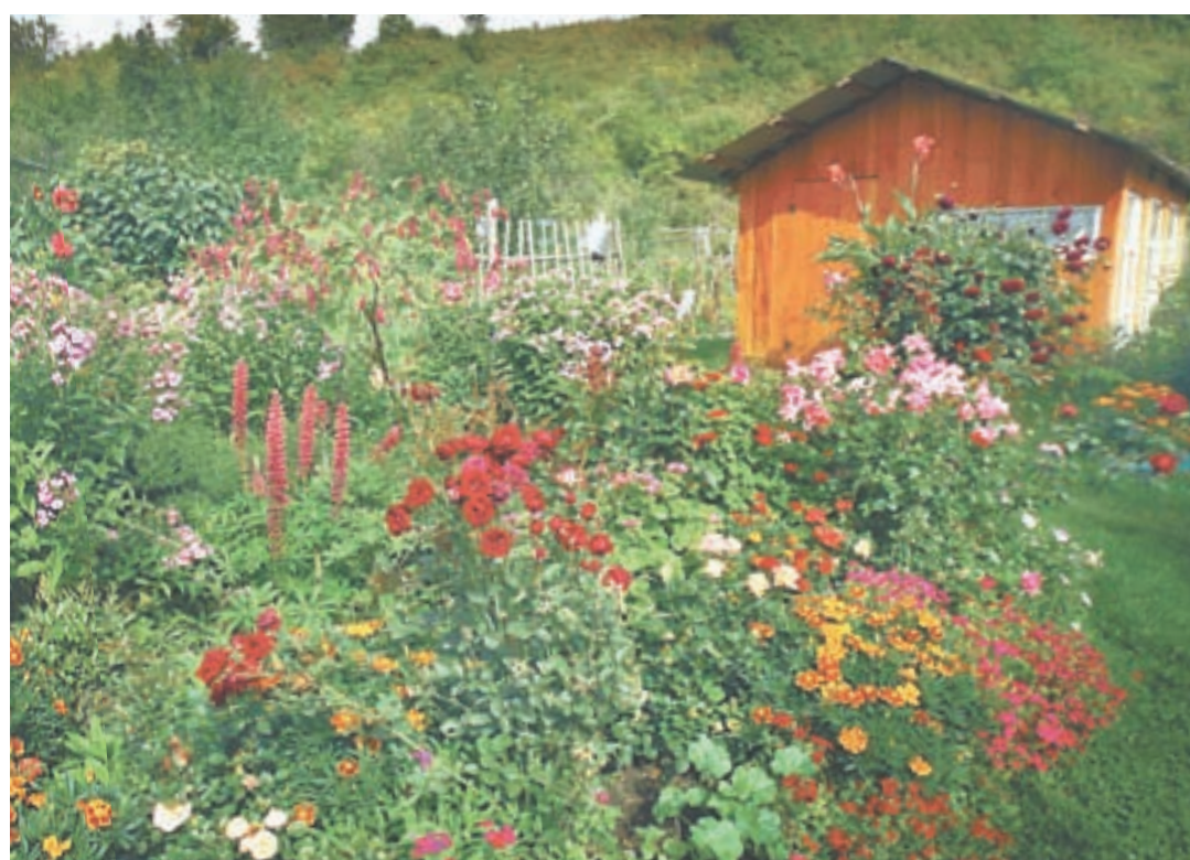
Наверное, так же выглядят райские кущи.