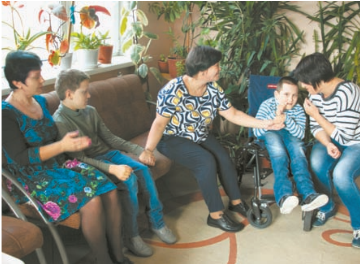
Центр дистанционного образования стал спасением для особых детей.