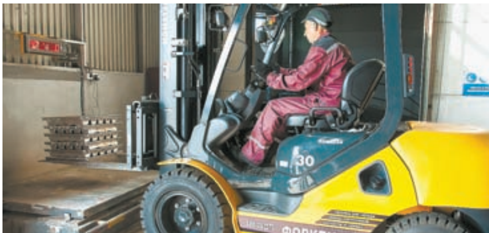
Взвешивание готового сплава.

«Единый центр утилизации». Сотрудничая с общественной организацией, которая занимается сбором вторсырья. Отходов хватает, поскольку у нас филиалы в Томске, Новосибирске, Новокузнецке, – говорит коммерческий директор.