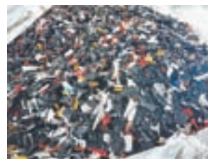
Результат переработки аккумуляторов: сплав, сульфат натрия и кусковой полипропилен.