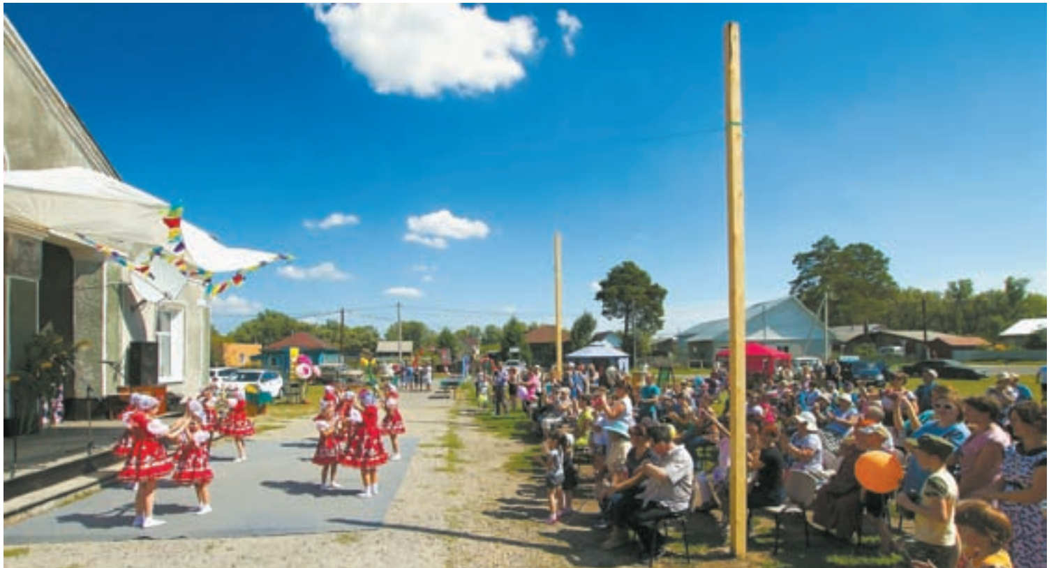
В августе прошлого года селу исполнилось 270 лет.