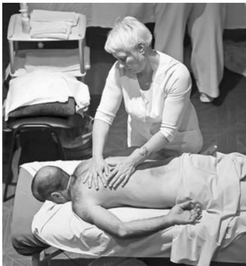
Путь к крепкому сибирскому здоровью.

Представители Европейской курортной ассоциации оценили санатории главной алтайской здравницы на предмет качества оказания услуг.