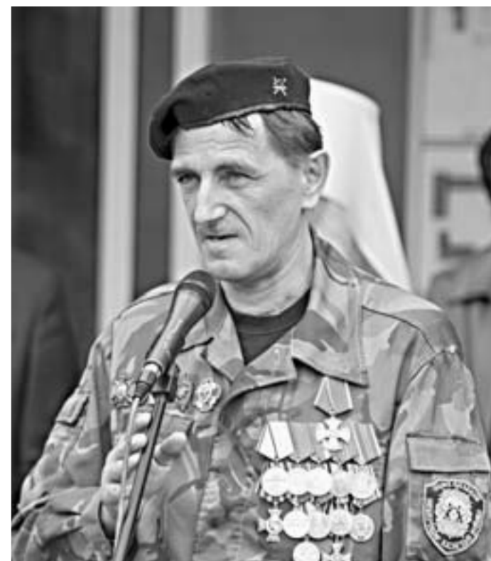
Вадим Турлаев: «Терроризму нет оправдания».