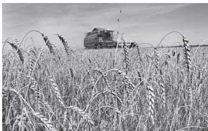
Ныне уборка зерновых идет опережающими темпами.

В этом году в Алтайском крае собирают больше, чем в прошлом, пшеницы четвертого класса с высоким содержанием клейковины. А в некоторых хозяйствах удалось вырастить даже второй класс, которого раньше практически не встречалось в здешних местах. Такую информацию дает Алтайский филиал ФГБУ «Центр оценки качества зерна».