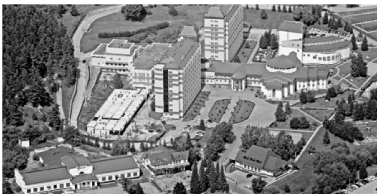
Город-курорт с высоты птичьего полета.