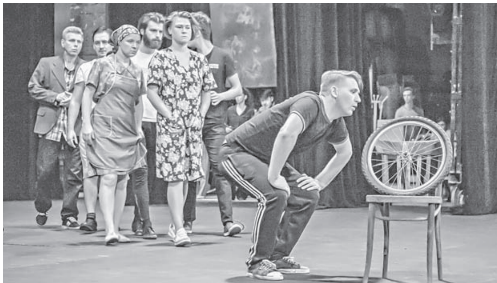
Репетиция спектакля «И разыгрались же кони в поле...» по рассказу Шукшина.

Краевой театр драмы поделился планами на ближайший год. В них – фестивали и обменные гастроли, сотрудничество с новыми и уже знакомыми режиссерами, а также просветительский проект.