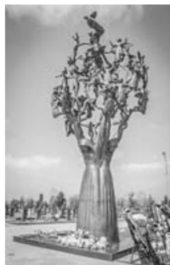
Митинг в память о трагедии в Беслане, случившейся 15 лет назад, прошел в Барнауле.

...Студенты нескольких барнаульских вузов в этот день все подходили к главному корпусу Алтайского технического университета, чтобы поучаствовать в митинге. Невольно подумалось: вот и те первоклашки, что погибли в 2004 году от рук чеченских сепаратистов, сейчас учились бы в вузе. А кто-то, может быть, уже бы и стал выпускником. Не случись той страшной трагедии.