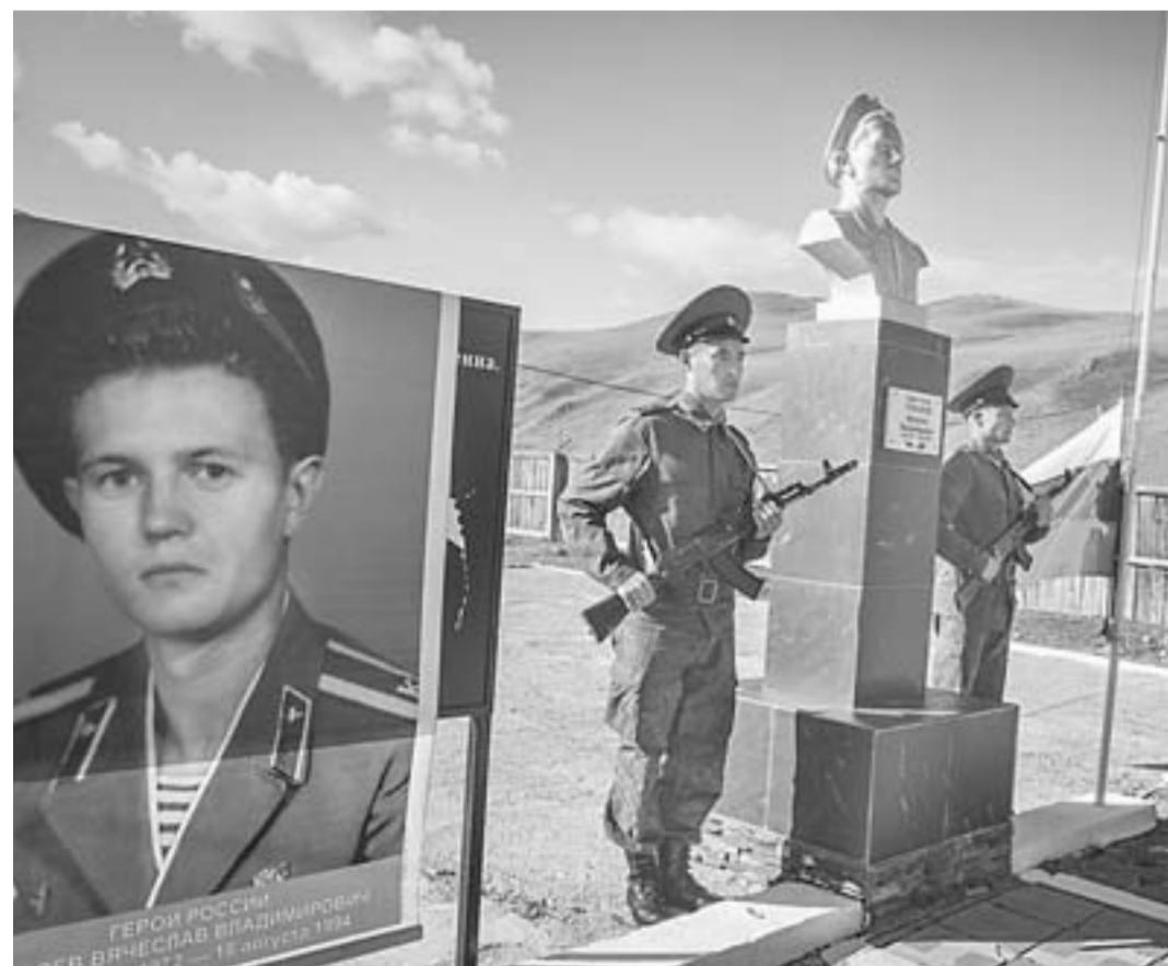
Застава имени Героя России Вячеслава Токарева.