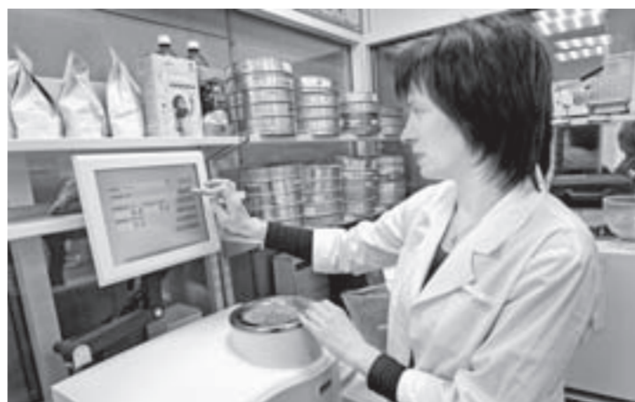
В лаборатории «Центра оценки качества зерна».

В отличие от предыдущих лет уже на первых этапах мониторинга выявлена пшеница 2 класса, выращенная в Михайловском районе. Пшеница выгодно отличается качественными характеристиками – количеством клейковины – 33,0%, массовой долей белка – 16,2%, высочайшей натурой 791 г/л и стекловидностью 60%, что в