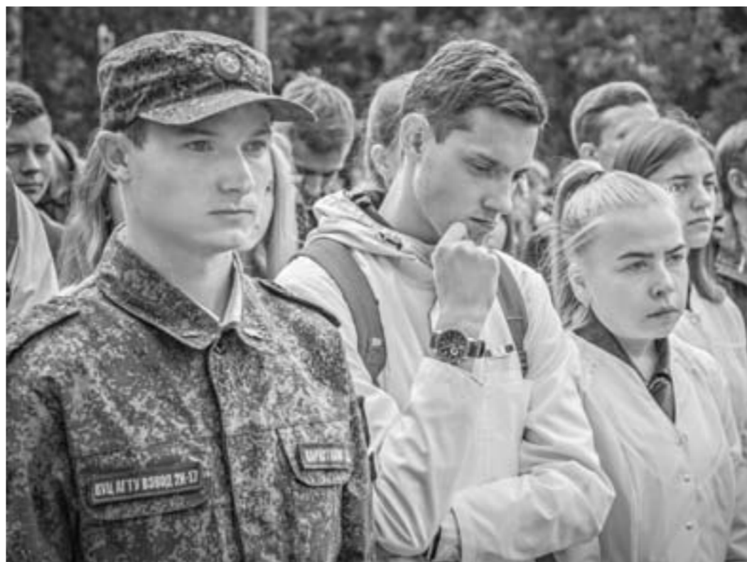
Они были совсем маленькими, когда случилась трагедия в Беслане.

Выступая перед собравшимися, председатель АКЗС Александр Романенко отметил, что в Беслане тогда был совершен теракт, масштаба которого Россия еще не знала. Тысячу