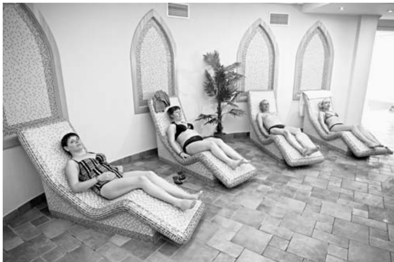
Комплекс «Водный мир» санатория «Белокуриха».