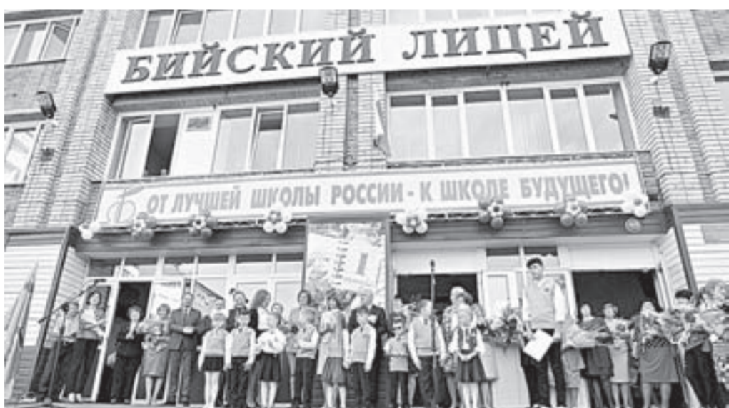
Это образовательное учреждение – одно из лучших в регионе.

Среди лидеров традиционно находится Бийский лицей-интернат. На протяжении