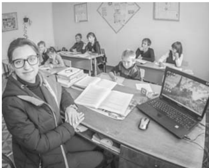
В селах края ждут молодых учителей.

Для разработки проблемы создана рабочая группа, в которую вошли представители разных ведомств. Были проведены встречи с главами муниципалитетов, молодыми специалистами, приехавшими работать в село. В процессе работы выяснилось, что положительного опыта на местах достаточно в сфере образования, здравоохранения и сельского хозяйства и его нужно распространять по всему краю.