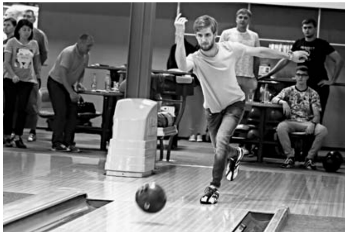
На одной из 16 дорожек bowling-центра.