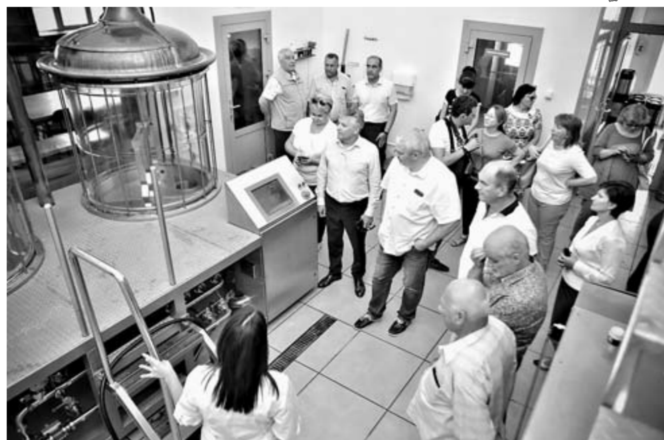
Мощности комбината позволяют одновременно накормить вкусной и полезной едой 1,5 тыс. человек.

– Для развития города необходимы предприятия санаторно-курортного лечения и те, кто занимается гастрономическим туризмом, – комментирует глава Белокурихи Константин Базаров. – Это напрямую отражается