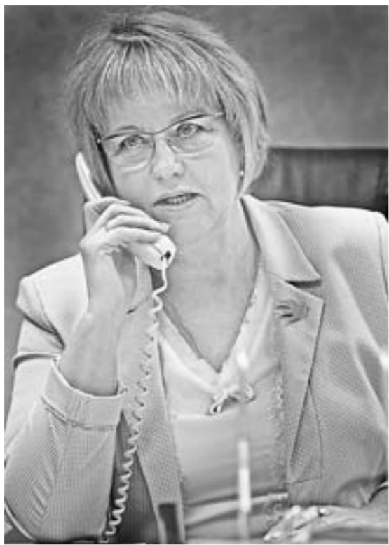
В Алтайском крае реализуется множество программ трудоустройства людей предпенсионного возраста.