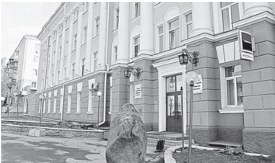
В медицинский университет в этом году поступили представители 25 регионов и шести стран ближнего зарубежья.

Кстати, в вуз поступили 32 участника проекта «будущие кадры здравоохранения»,