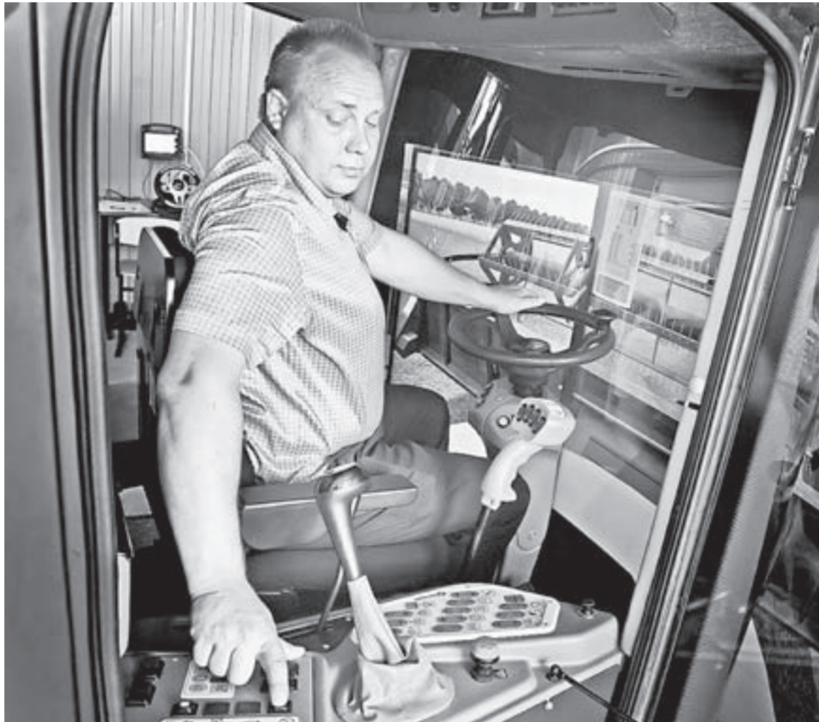
Новая сельхозтехника поступила в лабораторию.