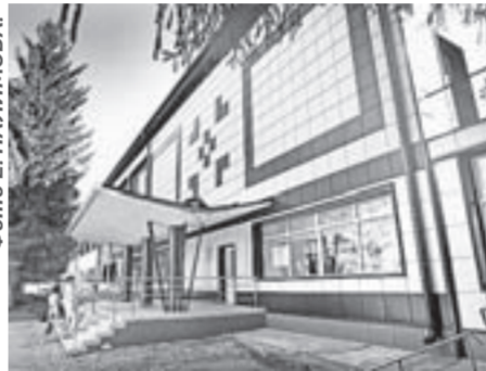
Главный корпус изменился как снаружи, так и внутри.