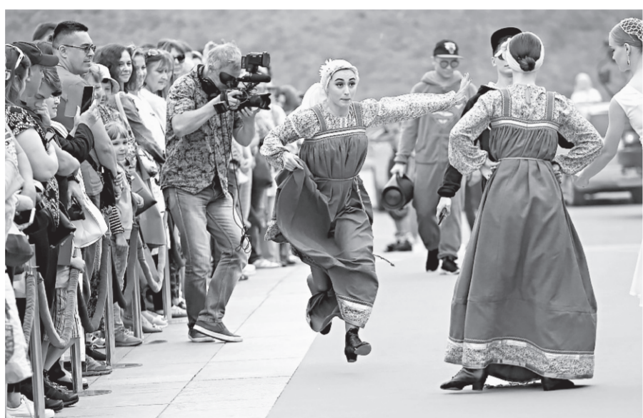
В ожидании гостей.