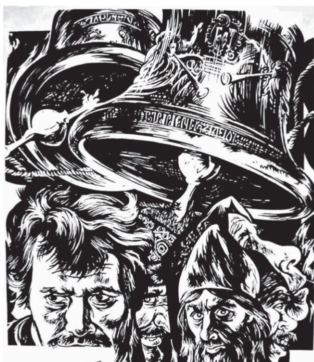
Иллюстрация художника Александра Дерявского.