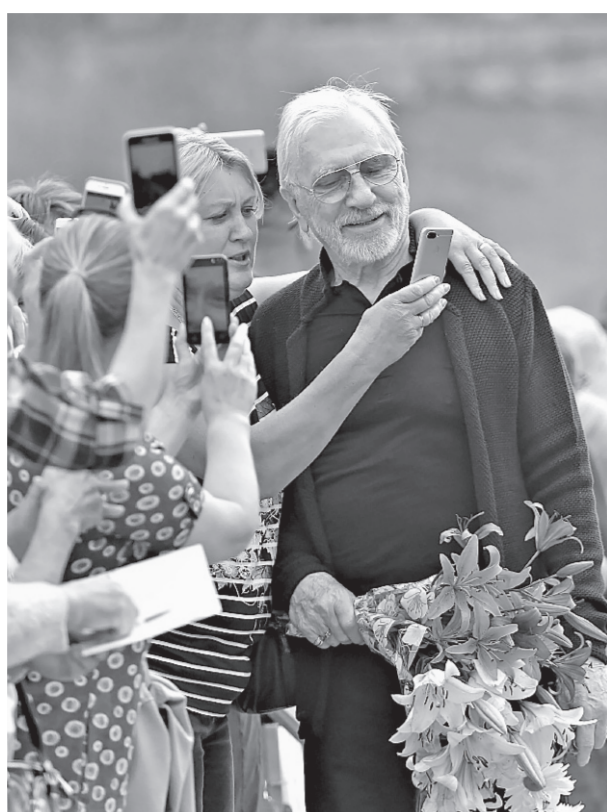
Селфи с президентом ВШКФ.

Губернатор сказал, что к подготовке к празднику в год 90-летия Шукшина в крае подошли с особой ответственностью. В программу Шукшинских дней вошло более 40 основных мероприятий, расширилась их география. Немало добрых слов услышали в тот вечер гости открытия фестиваля. Со сцены их произносили президент кинофестиваля Виктор Мережко, артисты Андрей Мерзликин, Алиса Гребенщикова, писатель Павел Басинский и другие. В год 55-летия всенародно любимого первого полнометражного фильма Шукшина «Живет такой парень» немало радости доставило гостям торжества появление в зале давних друзей нашего края, известных кинематографистов Рениты