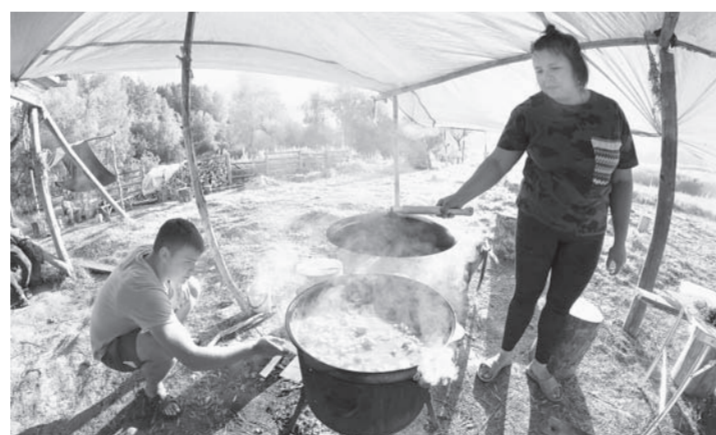
В палаточных лагерях отдыхают дети со всего края.