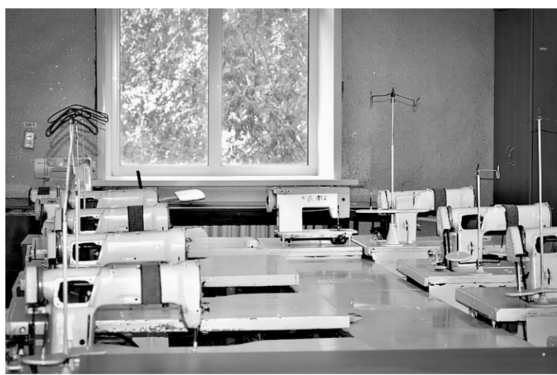
Устаревшее швейное оборудование заменят на современное.

Финансирование Рубцовской общеобразовательной школы-интерната № 1, в котором 191 уча-