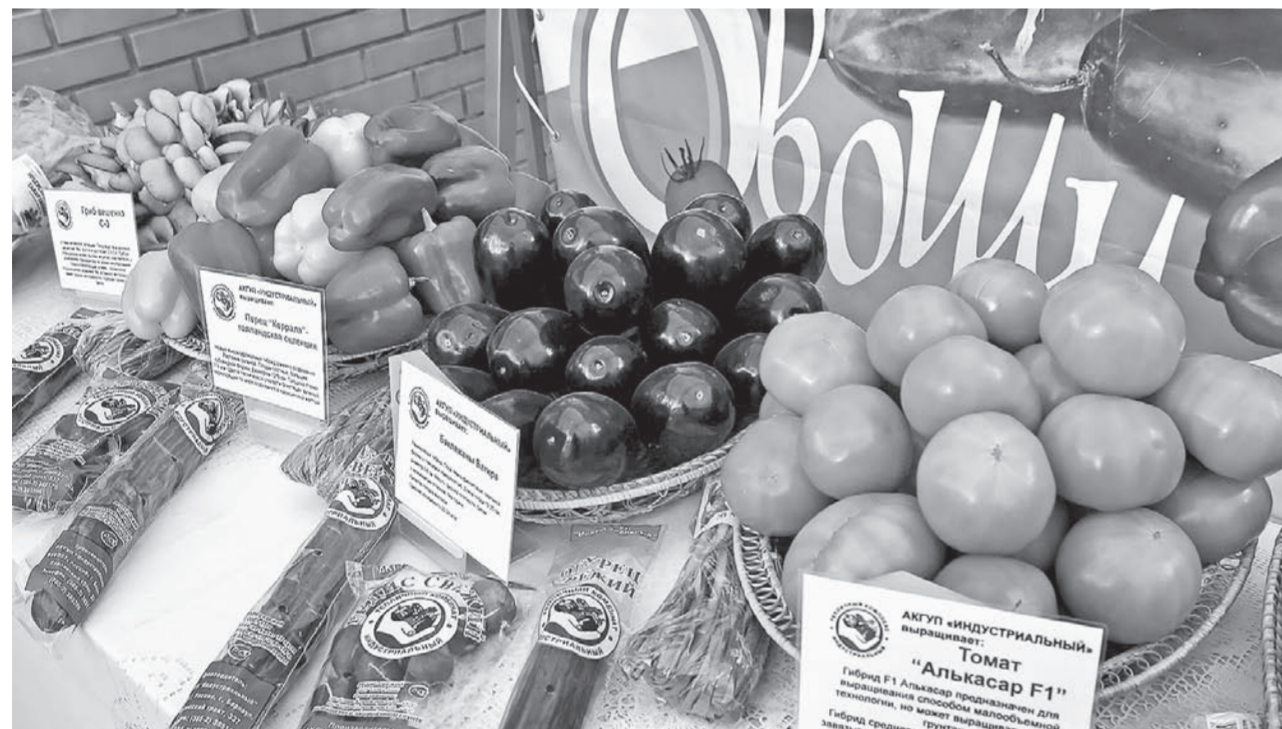
Арендатор планирует сохранить отрасль на Алтае.

Власти рассказали о судьбе теплично-комбината «Индустиальный». Вчера на заседании регионального правительства один из вопросов был посвящен мерам по сохранению производства.