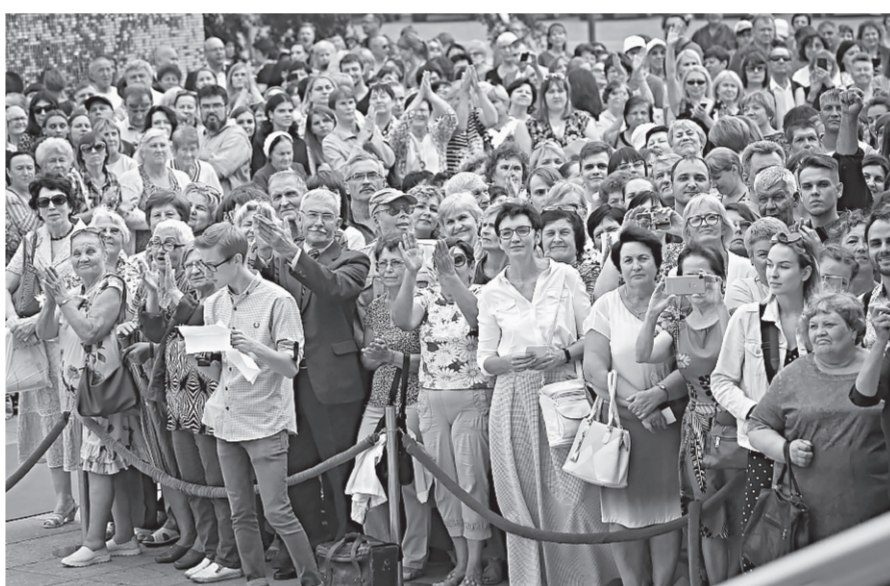
Барнаульцы приветствуют участников фестиваля.