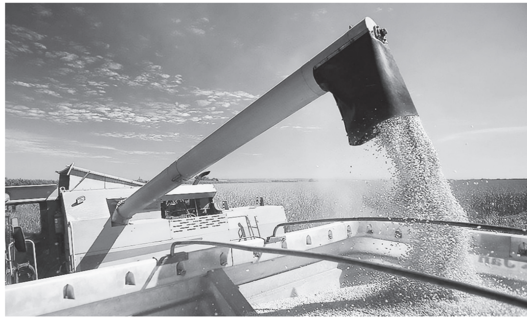
Алтайский край включен в работу по реализации нацпроекта «Международная кооперация и экспорт».

До конца 2019 года будет закончено исследование рынка целевых стран-импортеров для оценки экспортных возможностей продукции АПК Алтайского края. Полученные результаты лягут в основу пла-