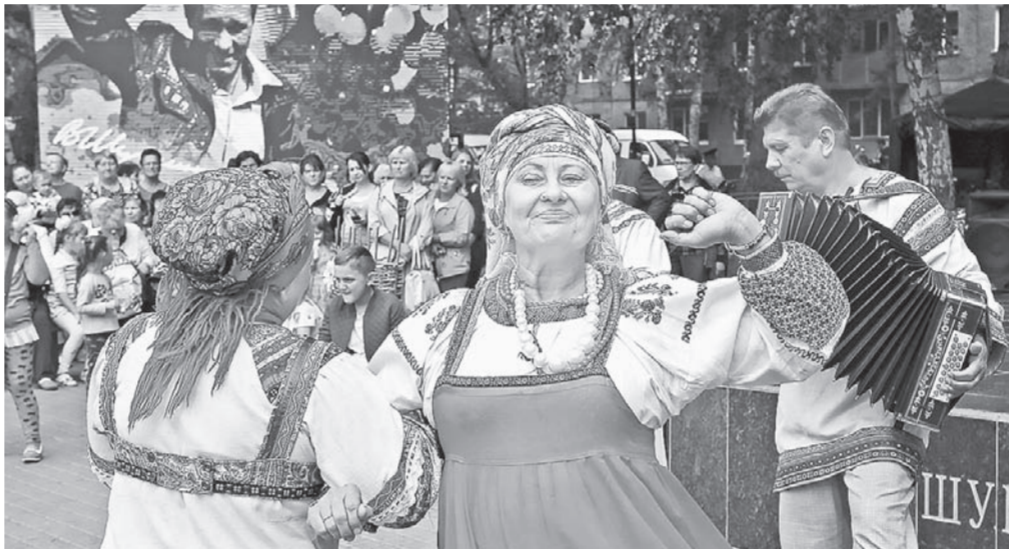
Выступают «Вечерни» из Сросток.