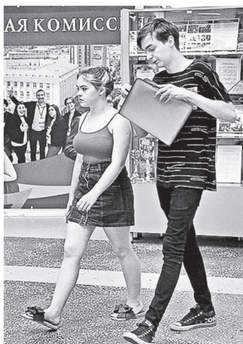
Будущее начинается здесь!