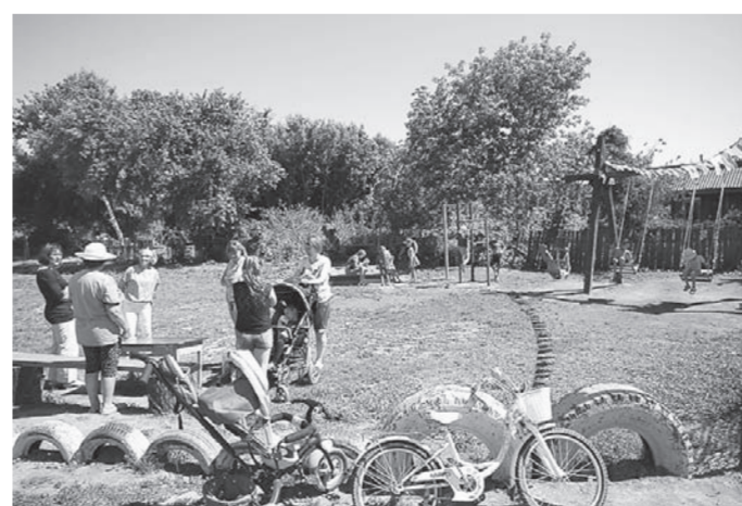
Детскую площадку соорудили всем миром.