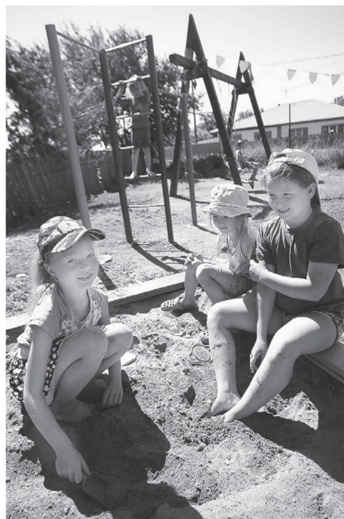
Детвора играет с утра до ночи.