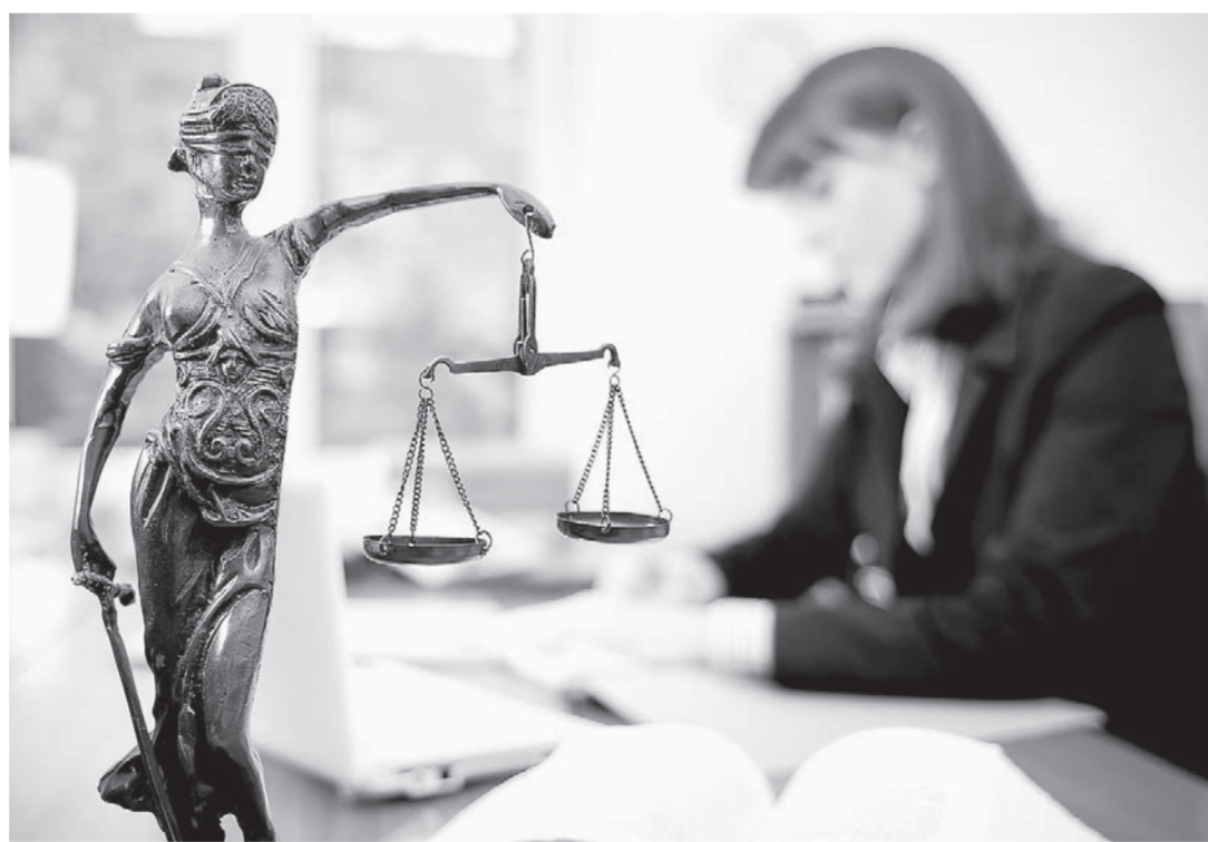
Назрел вопрос создания центра защиты прав граждан.

В Алтайском крае есть проблемы с предоставлением бесплатной правовой помощи. Решать их будут как в регионе, так и на федеральном уровне.