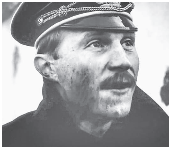
Из фильма «Моонзунд» (1987 г.).