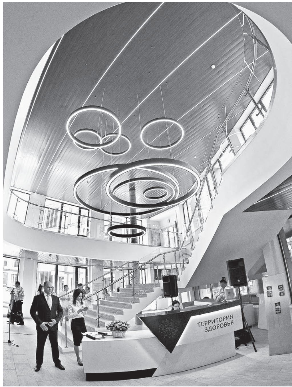
В холле медучреждения красиво, как в театре.