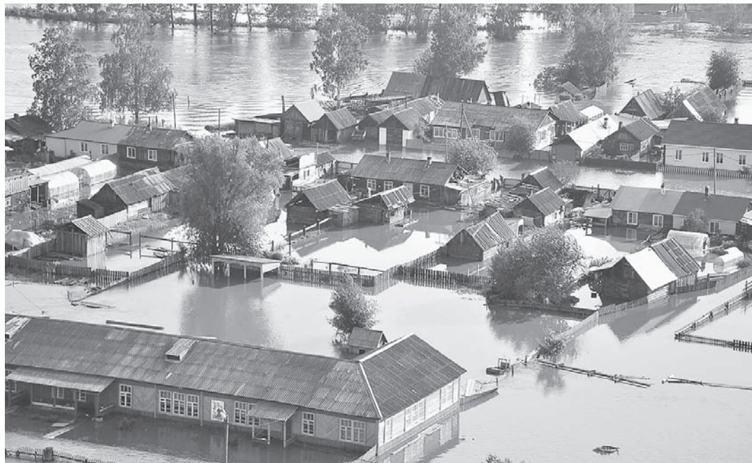
Паводок в Иркутской области не оставил равнодушными жителей края.

Как известно, в нашем регионе отработана схема помощи детям из зоны затопления. В 2018 году детские оздоровительные учреждения края в срочном порядке организовали отдых для пострадавших от паводка ребятшек Алтайского края. Как правило, для них проводится общеукрепляющее санаторно-курортное лечение, в случае имеющихся у ребенка заболеваний врачи обращают внимание и на них.