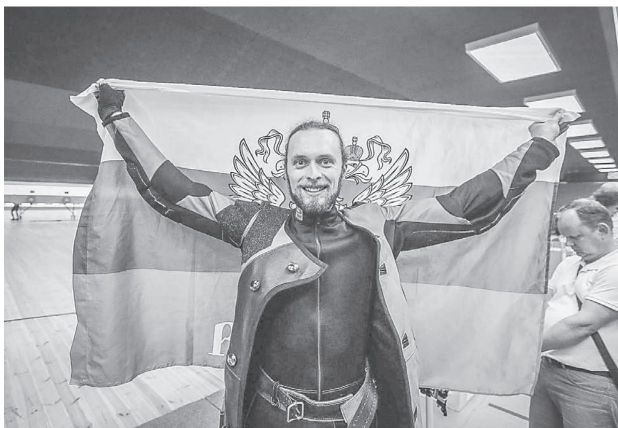
Сергей Каменский пронес флаг России на церемонии закрытия игр.

Это первый случай, когда представитель Алтайского края исполнил столь почётную миссию. В 2009 году на торжественной церемонии открытия Универсиады в Белграде знаменосцем российской команды был уроженец Барнаула фехтовальщик Алексей Якименко, но на тот момент он уже проживал в Москве. Вторые Европейские игры в Минске стали для Сергея Каменского главным стартом нынешнего сезона. На выбор его кандидатуры в качестве знаменосца, возможно, повлияло и то, что в коллекции бийчанина есть «серебро» Олимпийских игр в Рио-де-Жанейро, также он является двукратным чемпионом мира и семикратным чемпионом Европы. Вот что написали о нашем земляке на сайте Европейской конфедерации стрелкового спорта после выступления на Играх в Белоруссии: «Стрельба Каменского сильна, как игра сборной Советского Союза по хоккею. Они делали, что хотели, забивали, когда хотели, и выигрывали. Каменский – это такой спортсмен, который мог бы быть хуми-ром для всех. Его отличает хорошее поведение, превосходный талант.