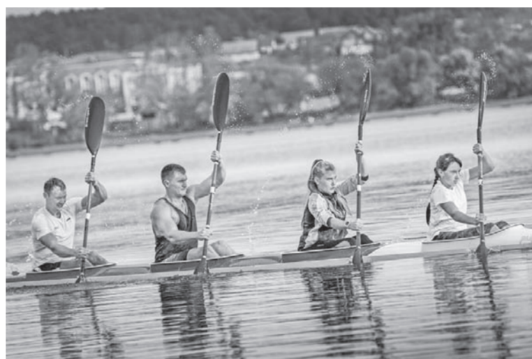
В одной байдарке – павловские спортсменки и звезды.

Основа успеха гребли в Павловске – это треугольник. Так я называю взаимодействие «тренер – ребенок – родители». Когда только начинали работу, родительские собрания проводили вместе с детьми. Я говорил, что спортсмены должны быть под