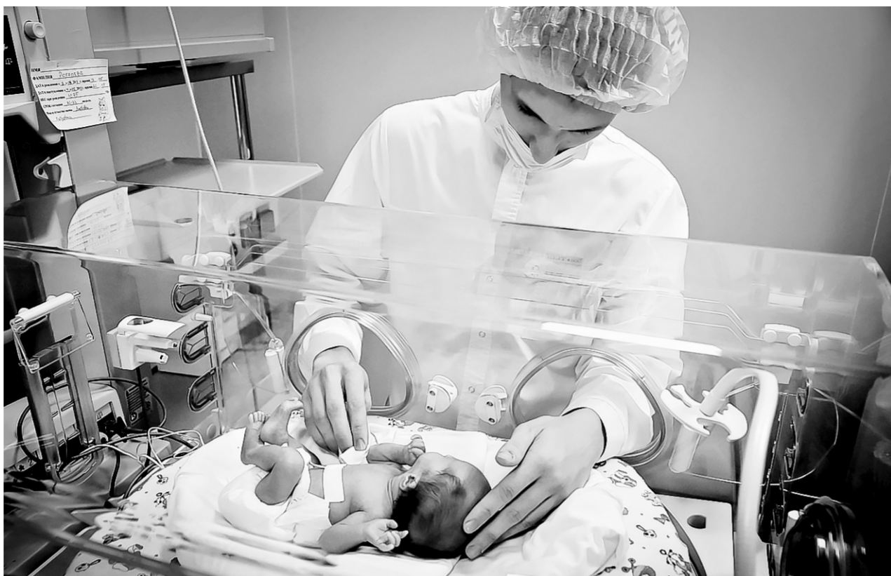
Еще одна спасенная человеческая жизнь.

– Сравнения с другими странами некорректны, так как расстояния несопоставимы. Если лететь недалеко, подходят легкие вертолеты, для них