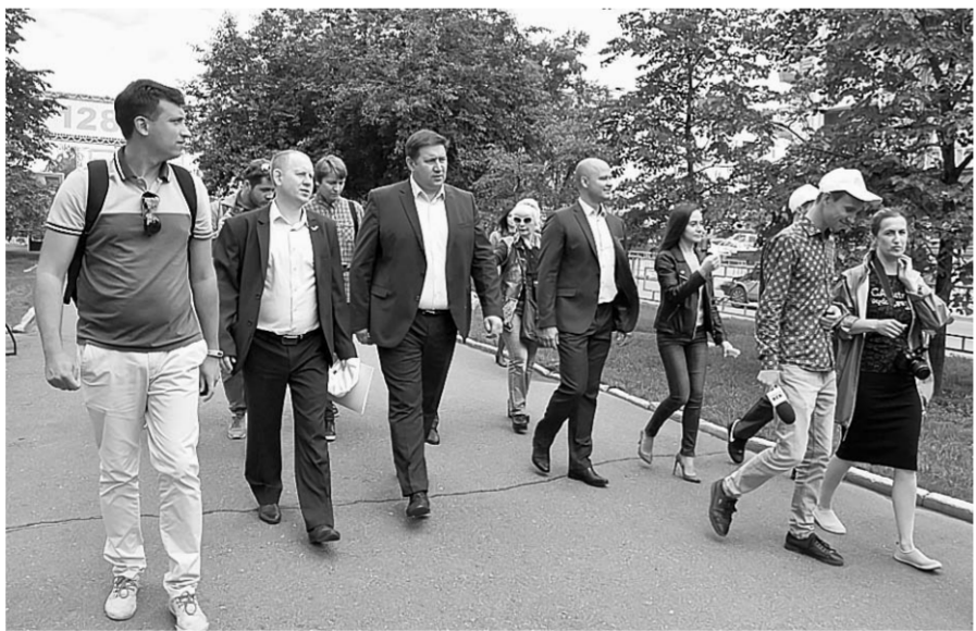
Эксперты ответили на все вопросы барнаульцев.

Если барнаулец бросит взгляд на дороги города, то в его голове может созреть ряд вопросов. Чтобы избежать недоумков и недопониманий, работники Министерства транспорта Алтайского края совместно с представителями комитета по дорожно-благоустроительному комплексу городской администрации прошли по улицам краевой столицы и рассказали гражданам о ремонтно-строительных работах.