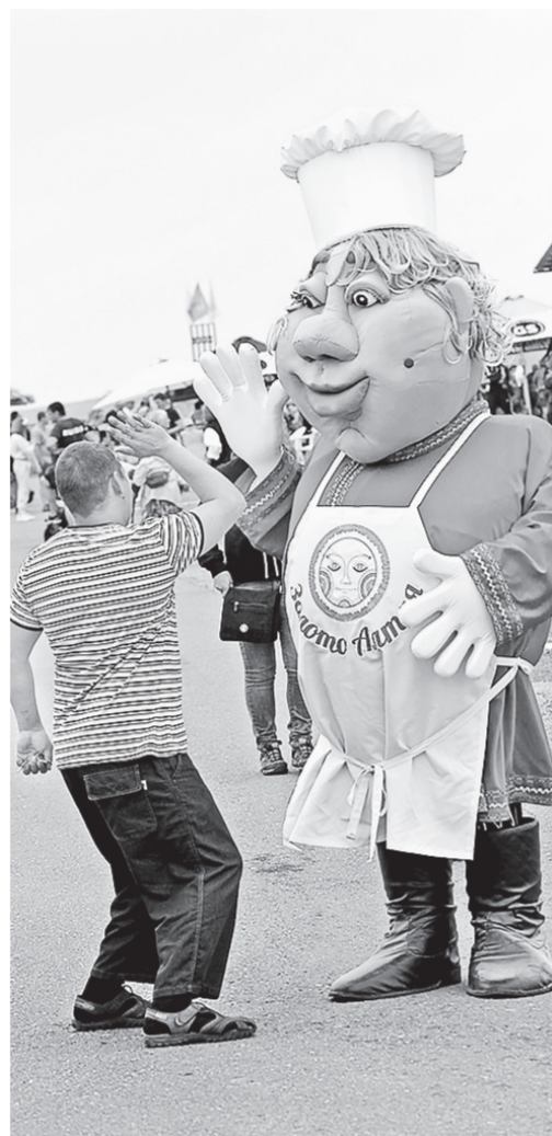
Привет, «Золото Алтая»!

Один из счастливиц уехал с «АлтайФестом» в выигранном автомобиле – после небольшого перерыва на Алтае вновь в размахом прошел межрегиональный фестиваль напитков.