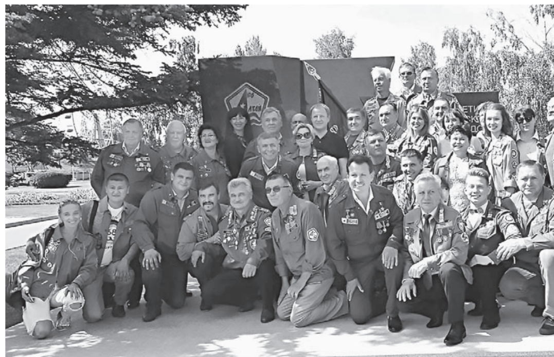
Руководители края и несколько поколений стройотрядовцев.

— Очень важно, что сегодня здесь объединились разные поколения. Мы знаем о выдающихся успехах разных лет нашего краевого студенческого