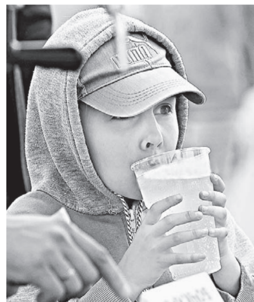
Напитки на любой вкус для любого возраста.