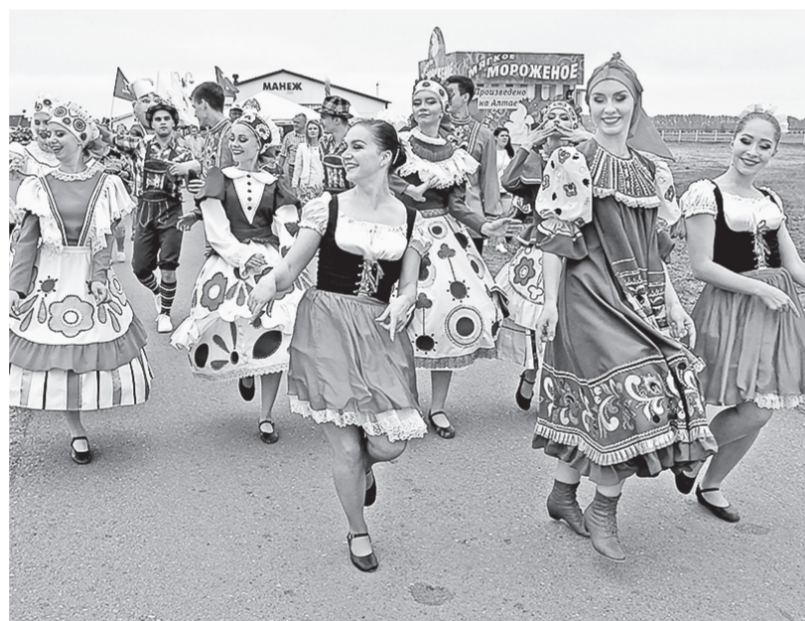
На фестивале одна концертная программа сменяла другую.