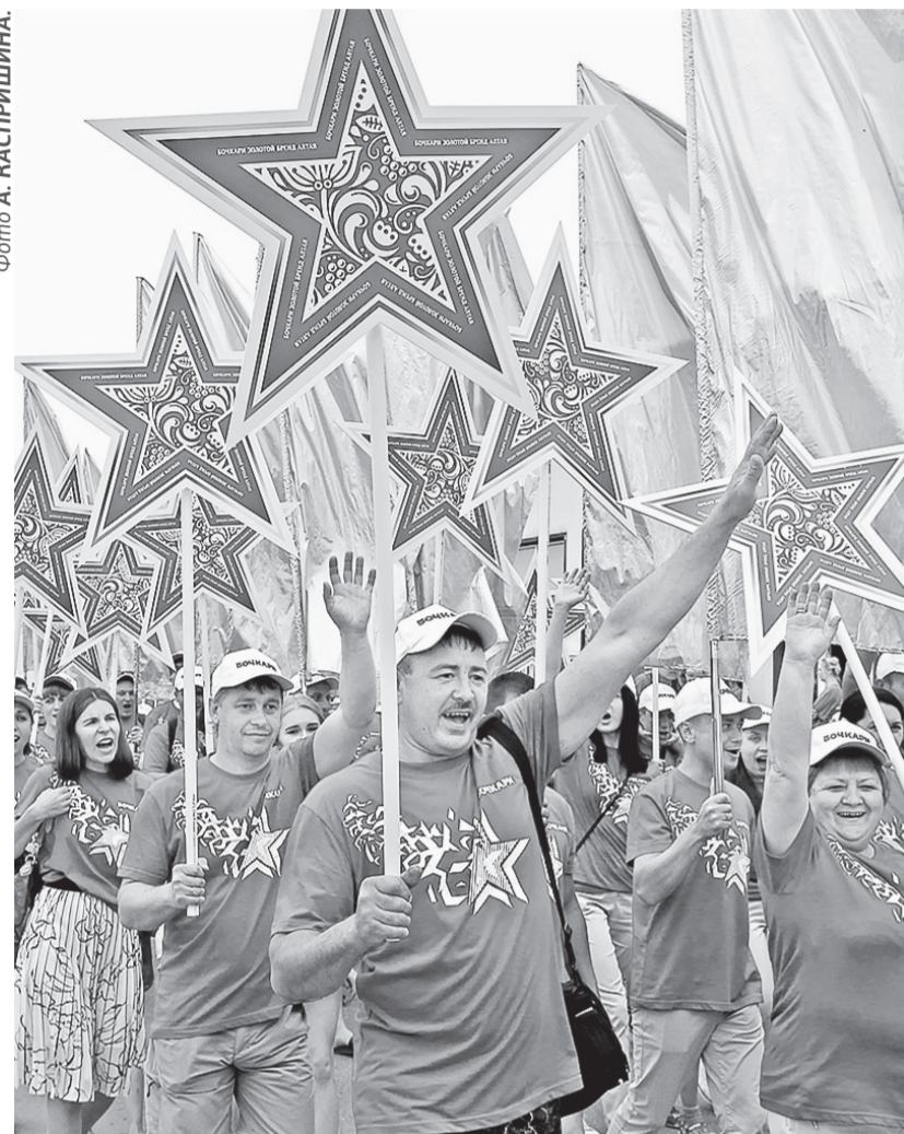
На праздничном шествии.