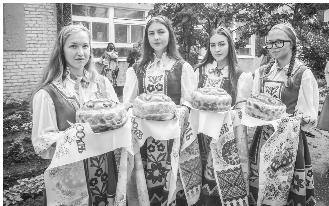
На празднике представили национальное многоцветие Бурлинского района.