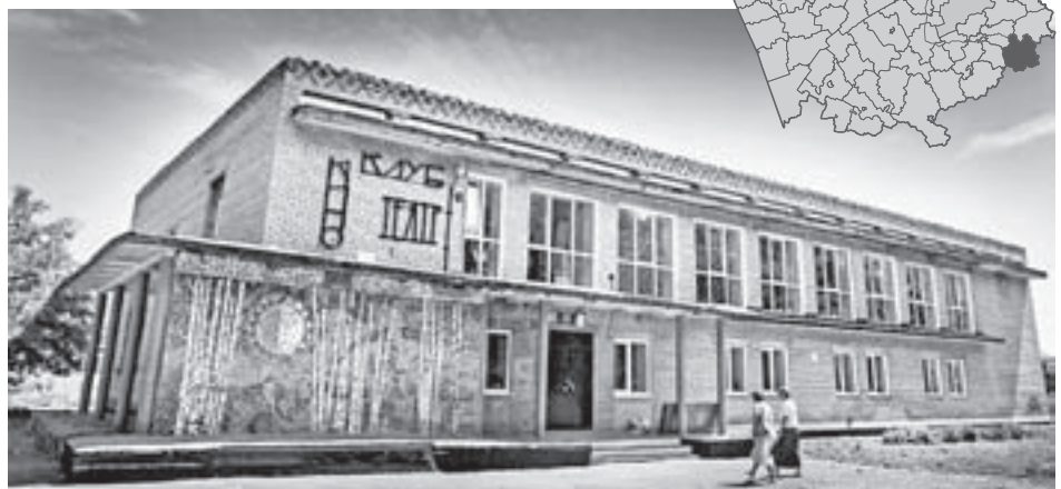
После ремонта сельский ДК помоддел.