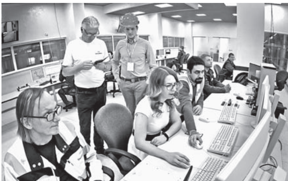
Иностранные специалисты помогают местным добиться максимальной производительности оборудования.