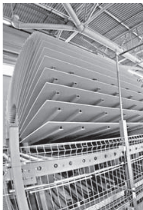
Так охлаждают плиты MDF.

«На самом деле мы еще находимся в начале пути. Еще учимся работать на этом оборудовании, еще только разбираемся с технологиями, которые нам передали, и процесс обуче-