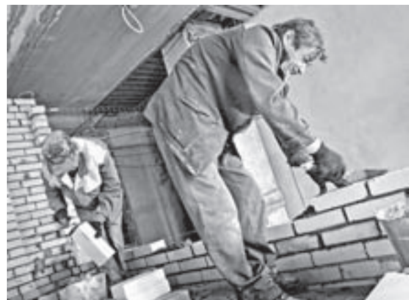
У строителей еще много работы.