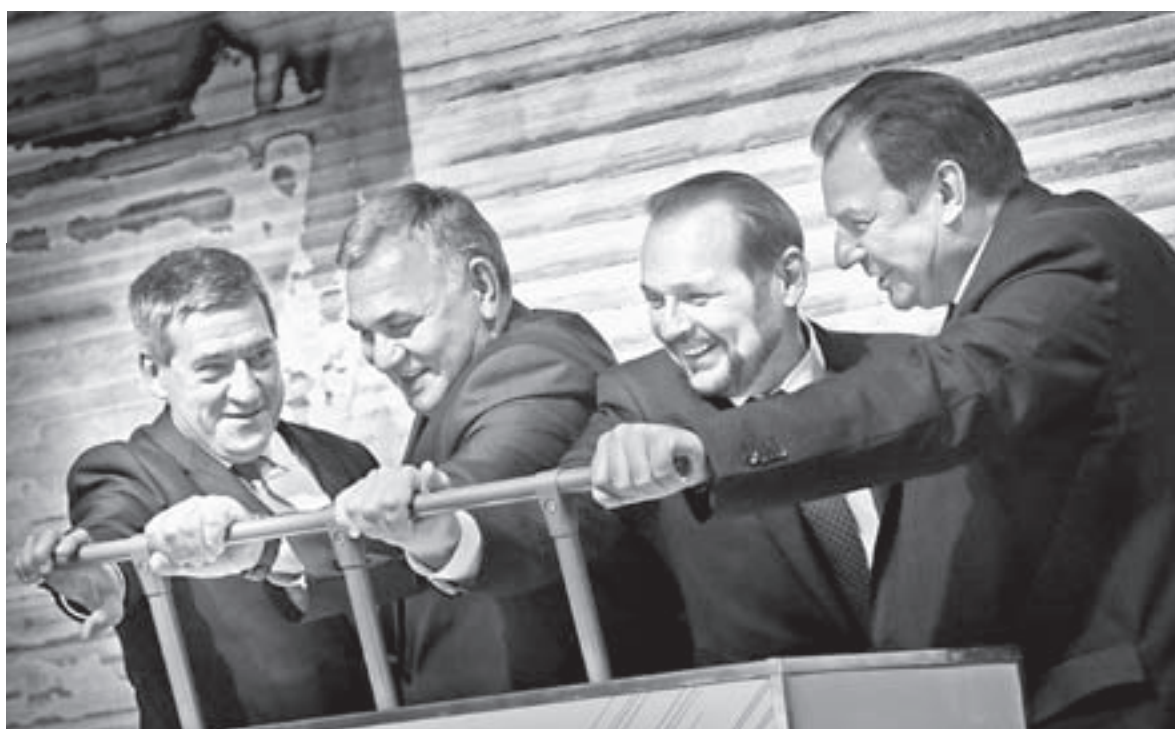
Символический рубильник включили почетные гости праздника.