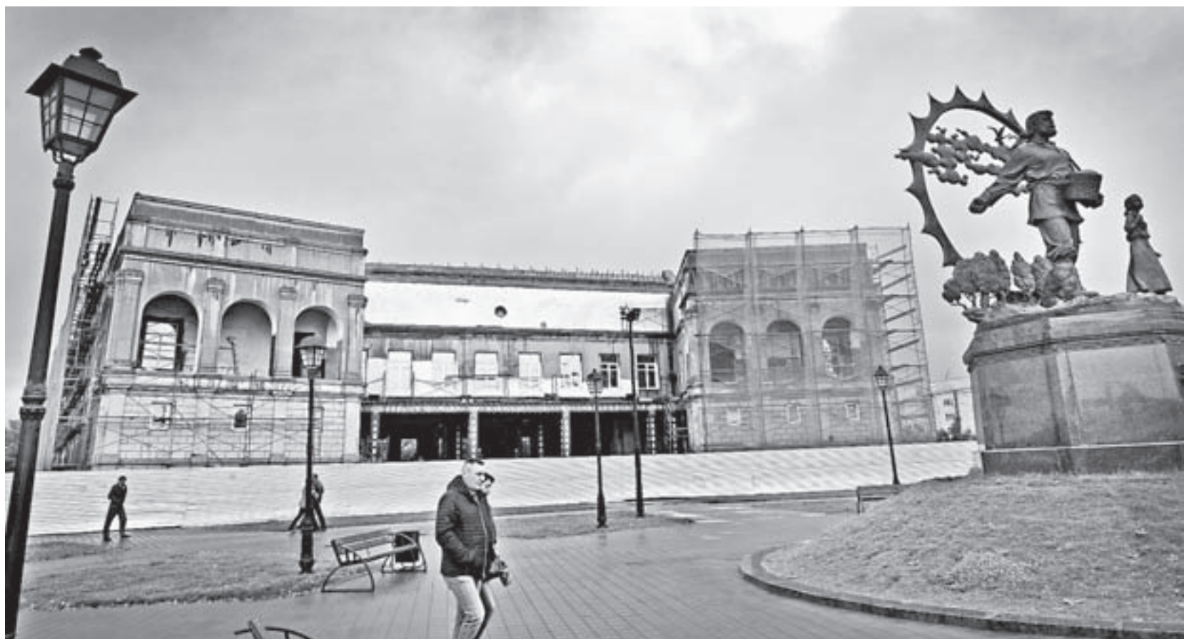
В краевом министерстве строительства и ЖКХ обещают, что обновленный музей откроется во втором квартале 2021 года.

На этой неделе строительную площадку Художественного музея посетили министр строительства и ЖКХ края Иван Гилев и министр культуры Елена Безрукова.