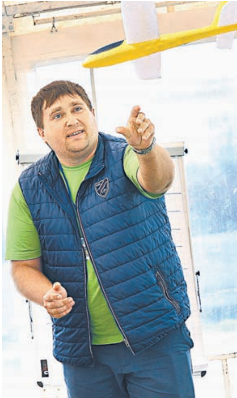
АТР дает проектам ребят «крылья» и направления развития.

Что особенно запомнилось с последнего форума? Конечно, новые площадки. На «Медиадвиж» работали мои коллеги из региональных СМИ, но больше всего молодежь ждала встречи с московскими экспертами. Среди них отдельно хоте-