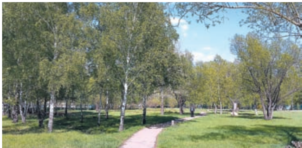
Сквер Победы нуждается в благоустройстве.

Сквер и несколько десятков дворов благоустроят в Рубцовске по программе «Формирование комфортной городской среды».