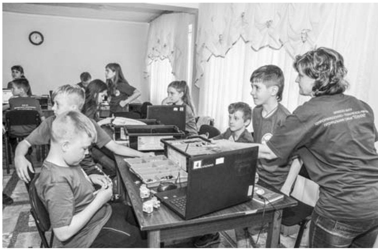
Школьники из отряда «ТехнUP» собирают и программируют роботов.

На прошлой неделе в крае открылись загородные оздоровительные лагеря и детские санатории. В некоторых из них сразу стартовали профильные смены.