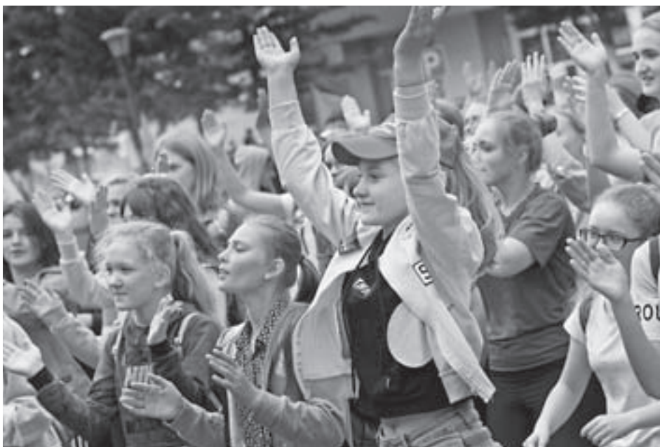
Зрители приветствуют участников игр.