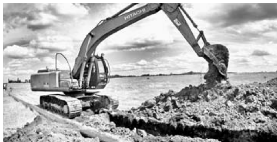
Полиэтиленовые трубы прослужат как минимум 50 лет.