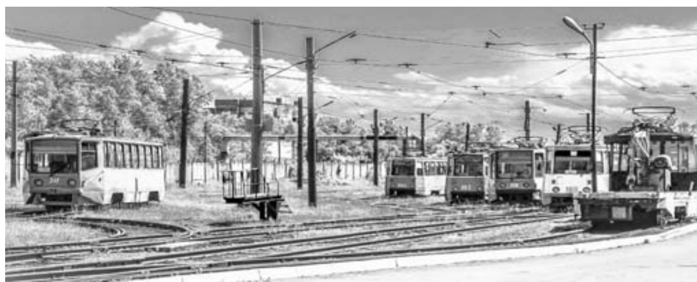
Бийчане будут продолжать ездить на трамваях.

Судьба электрифицированного транспорта в современной России вообще в целом нелегка. Только за 2016 год, согласно данным «Российской Газеты», трамваев лишились шесть крупных городов. Главной причиной этого местные власти называли изношенность инфраструктуры и подвижного состава, поддерживать которые очень тяжело, так как это довольно капиталоемкая отрасль. С бийским трамваем происходила практически такая же история. При этом городские власти искусственно пытались сдерживать тарифы. Еще несколько лет назад на городском трамвае можно было проехать на рубль дешевле, чем в автобусе. Конечно, городской бюджет субсидировал предприятие все это время, но вместе с этим средств катастрофически не хватало не только