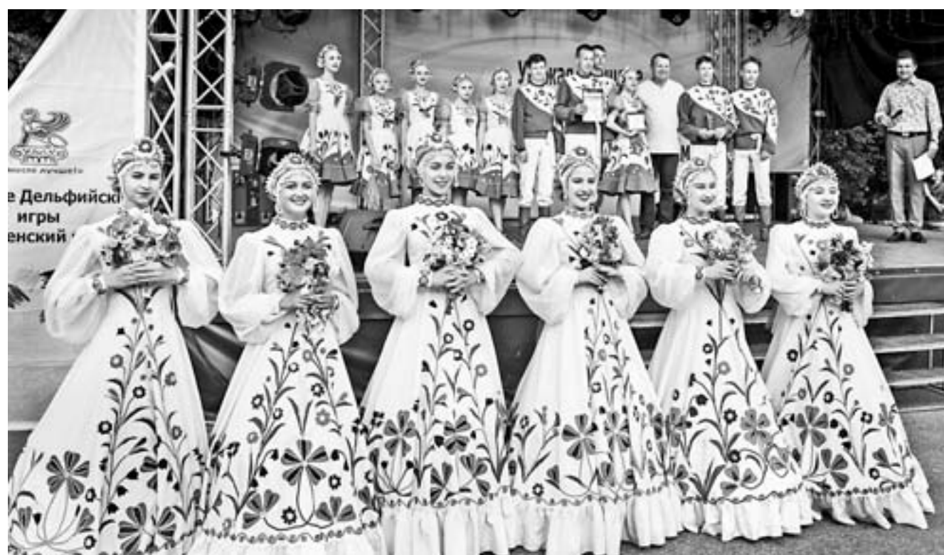
Ансамбль «Коробейники» (г. Новоалтайск).

– В Дельфийских играх я участвую в третий раз. Мне нравится, что в этом году другая местность. Мы выступили в номинации «Современная хореогра-