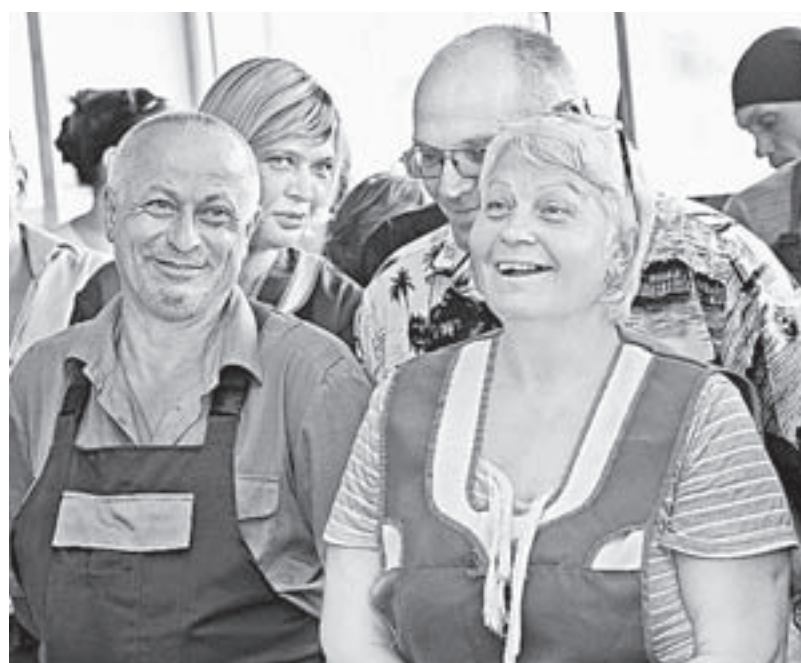
Дружный коллектив компании «Лакаса-Тэкс».