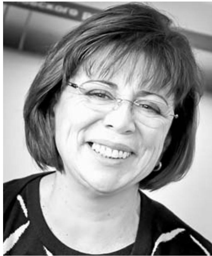
Ирина Роднина: «Не надо замыкаться на олимпийских видах спорта».

На прошлой неделе в Барнауле побывала легендарная фигуристка Ирина Роднина. С 2010 года она возглавляет Всероссийскую федерацию школьного спорта. У прославленной спортсменки был насыщенный график работы в краевой столице, и тем не менее она нашла время ответить на несколько вопросов журналиста «Алтайской правды».