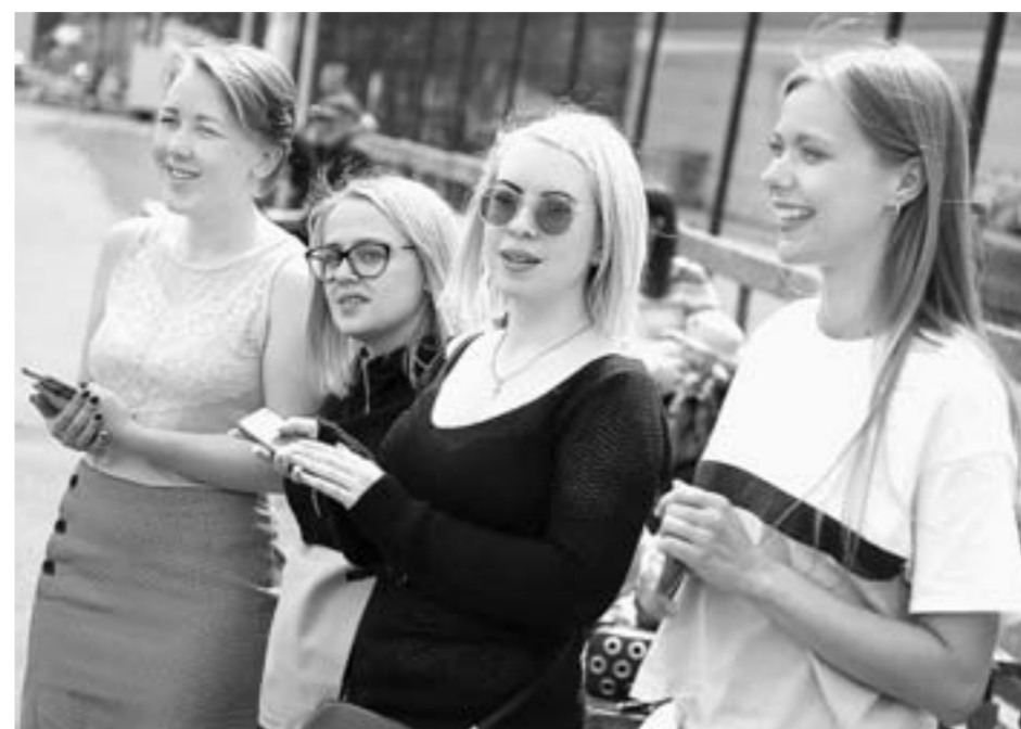
Болельщицы «Катунь 24».