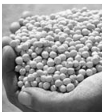
Хозяйство сеет только элитные семена.

большим спросом у северян, ценящих экологически чистую и натуральную продукцию с Алтая.