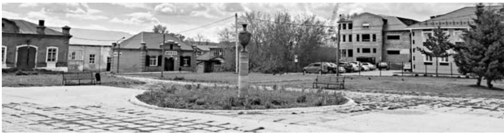
В этом году будет благоустроена центральная площадь Змеиногорска.