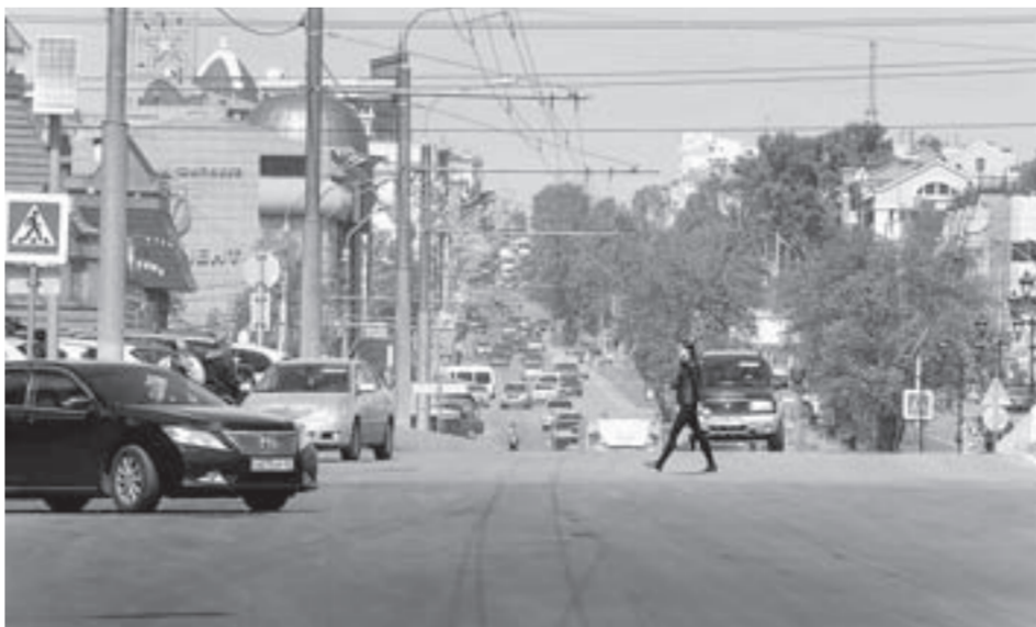
Ленинский проспект ждет масштабная реконструкция.

Согласно проектной документации на проспекте Ленина предстоит выполнить разборку покрытия проезжей части, демонтаж бортовых камней, работы по регулированию высотного положения горловин колодцев. Потом будут установлены бортовые камни, заменено покрытие на парковочных карманах, отремонтированы