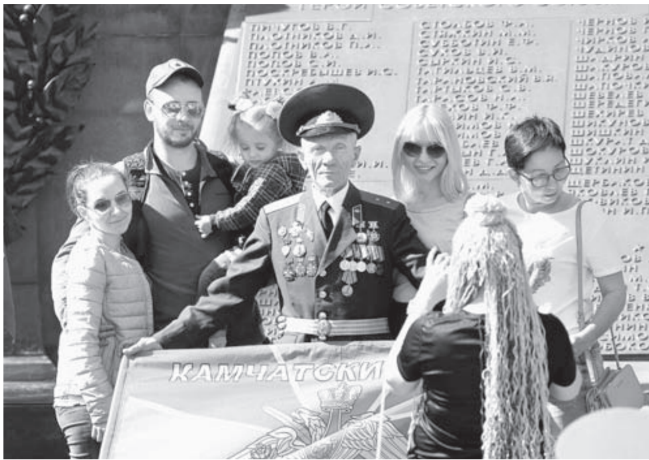
На митинг пришли целыми семьями.