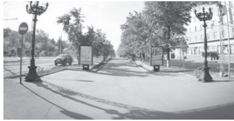
Так выглядит Ленинский проспект сегодня...