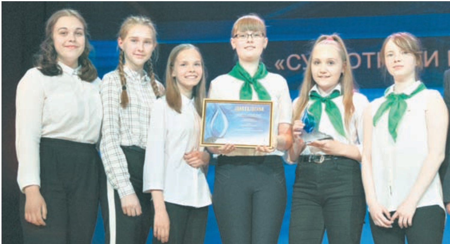
Проект «Усынови заказник» получил широкое признание.

– Список добрых дел неисчерпаем. Очень приятно здесь, в зале, видеть людей неравнодушных, активных, думающих не только о собственных проблемах, но и о тех людях, кто живет рядом, и о том, как можно улучшить жизнь других не ожидая взамен никаких наград. Вы совершаете добрые дела по велению души, сердца, не задумываясь о собственной выгоде, а просто понимая, что помогаете тем, кто в