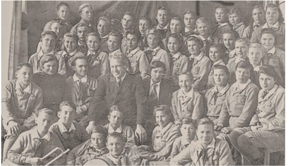
Военная смена в Белокурихе.

– Я неспроста назвала документальный фильм «Артековский закал». В сочетании этих слов – большой смысл. Принципы дружбы и взаимовыручки, неукоснительно соблюдавшиеся всю длинную военную смену, сплотили ребят, закалили их характеры, дали им важные жизненные ориентиры и навыки. Все, с кем мы встречались, с радостью вспоминали непростое,