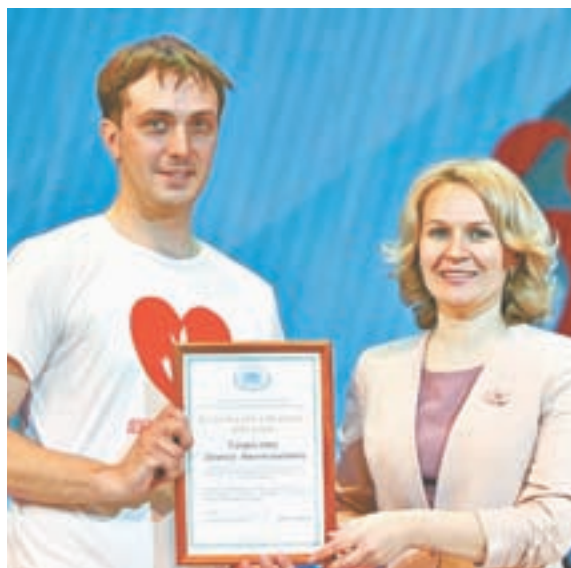
Во время награждения.