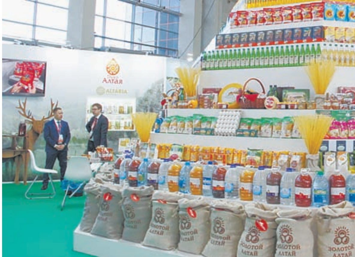
Производители края в начале апреля демонстрировали свою продукцию на XV Всероссийском форуме-выставке «Госзаказ».

Но обязательная экспертиза продержалась месяца два, и мы не успели тогда поработать. Тем не менее у нас было зафиксировано 2–3 случая поставки нека-