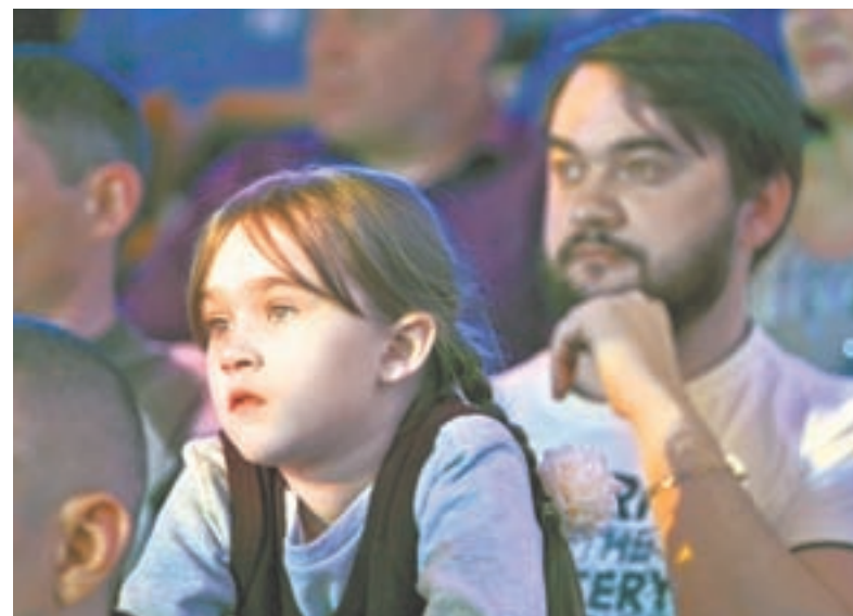
Папы приехали на торжество с детьми.