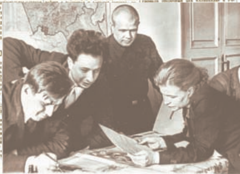
В редакции «АП».