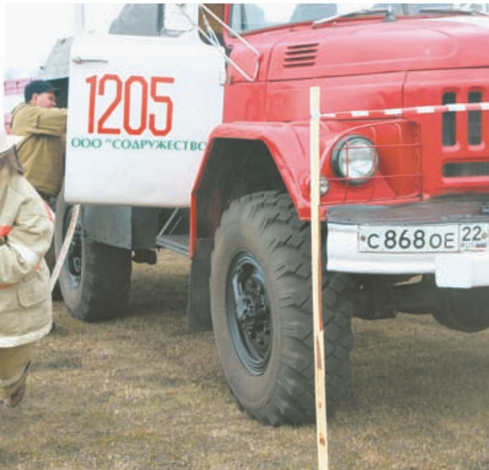
Бежать в спецкостюмах не так-то просто.

Чувствую себя Карлсоном, а ведь предстоит еще бежать и как-то справляться с пожарным рукавом. Пожарные показывают порядок действий: раскатать рукав,