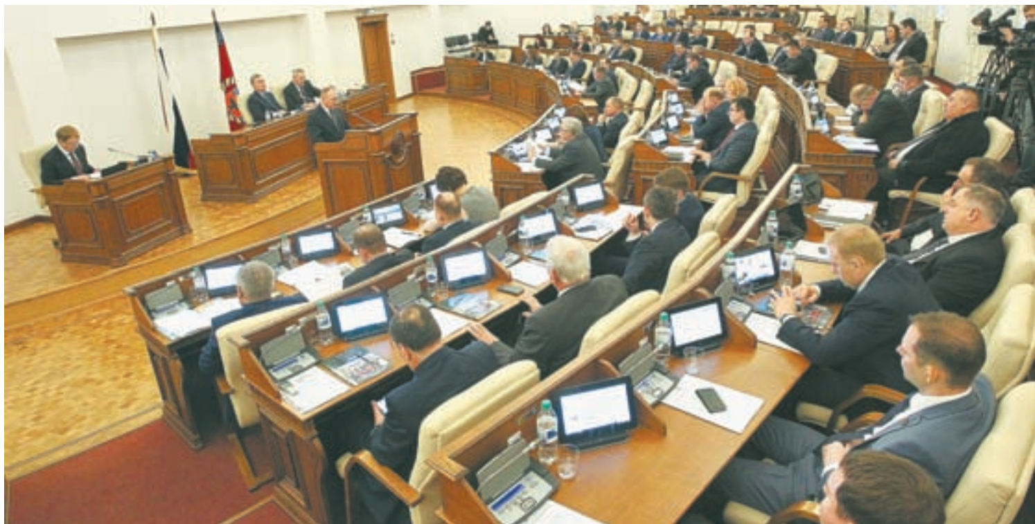
На 31-й сессии депутаты АКЗС рассмотрели около 20 вопросов.

Депутаты единогласно проголосовали за запрет на продажу вейпов и электронных сигарет несовершеннолетним. Покупать такие устройства теперь можно только после 18 лет. Если продавец сомневается