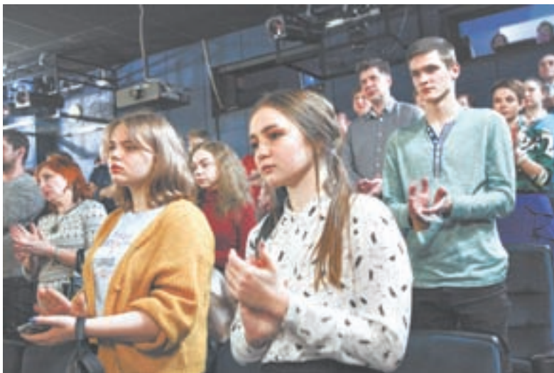
У спектакля не только эстетические, но и просветительские задачи.

Он надеялся, что станет учителем и никогда не будет ругать