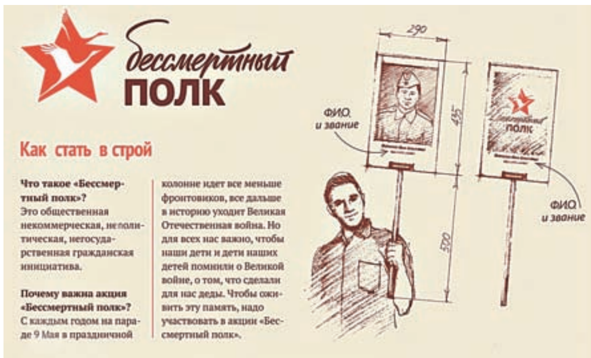
Плакаты с портретами солдат может изготовить фирма «Графикс».

Построение участников «Бессмертного полка» в Барнауле начнется в 8 часов 30 минут.