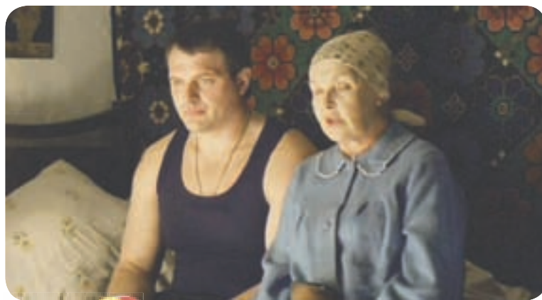
10.20 Х.ф. «Тёмные воды» (16+)