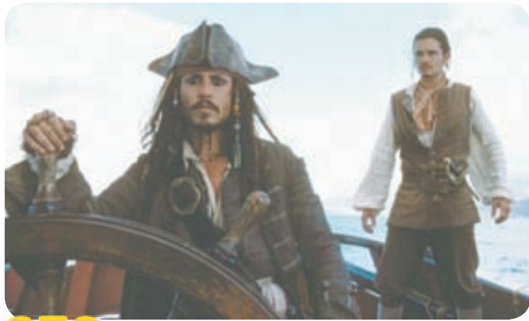
СТС 16.20 Х.ф. «Пираты Карибского моря. Проклятие «Черной жемчужины» (12+)

10.20 Т.с. «Морские дьяволы» (16+) 13.00 Сегодня 13.20 Обзор. Чрезвычайное происшествие 13.50 Т.с. «Морские дьяволы. Северные рубежи» (16+) 16.00 Сегодня 16.20 Следствие вели... (16+) 19.00 Сегодня 19.35 Т.с. «Юристы» (16+) 21.40 Х.ф. «Дед» (16+) 23.55 «Захар Прилепин. Уроки русского» (12+) 00.20 Х.ф. «Свои» (16+) 02.55 Т.с. «Пасечник» (16+)