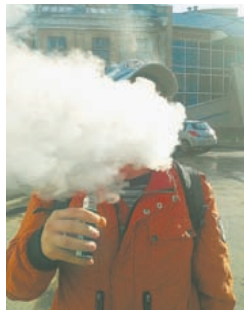
Вейпы вредят здоровью.

Закон был принят без поправки эсеров. Несмотря на это, многие депутаты призна-