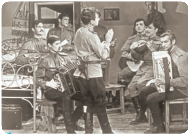
21.30 Х.ф. «В бой идут одни «старики» (12+)

05.15 «Спето в СССР» (12+) 06.15 Х.ф. «Они сражались за Родину» (0+) 08.00 Сегодня 08.20 Х.ф. «Они сражались за Родину» (0+) 09.55 Х.ф. «Один в поле воин» (12+) 13.35 Х.ф. «Последний бой» (16+) 13.55 Сегодня. Спецвыпуск 14.00 Москва. Красная площадь. Парад, посвященный Дню Победы