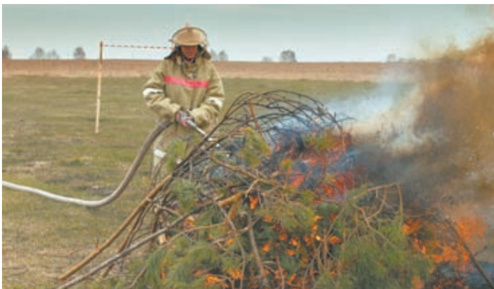
Потушить горящий валежник просто. Лес – гораздо сложнее.

прикрепить к бочке, надеть наконечник, добежать до пламени и залить. На все у профессионала ушло секунд 30. Посмотрев на наши озадаченные лица, задание нам существенно упростили – рукав раскатают без нас, наконечник уже закреплен... Задача: правильно выпасть из машины, добежать с рукавом до огня, а там уж играй в бравого пожарного!