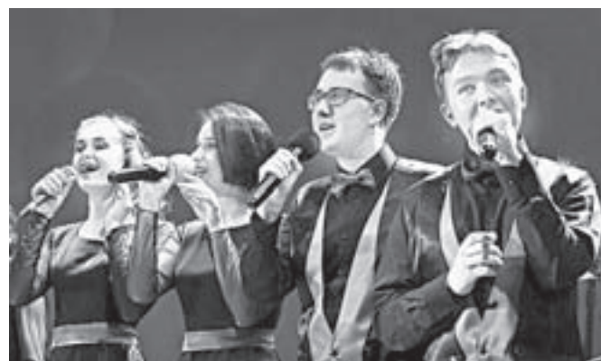
Во время открытия.