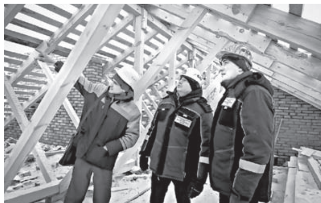
Контрольный выезд специалистов на объект.

танциях по оплате ЖКХ появилась новая строчка – плата за капремонт, а с сентября 2015 года Региональный оператор приступил к капремонту многоквартирных домов.