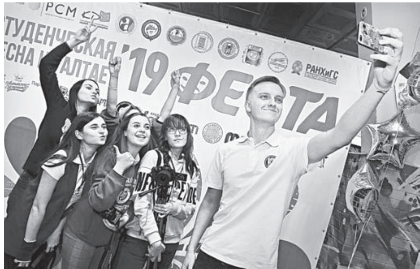
«Феста» собрал на одной площадке самых талантливых студентов края.

«Феста-2019» всю неделю проходит на Алтае.