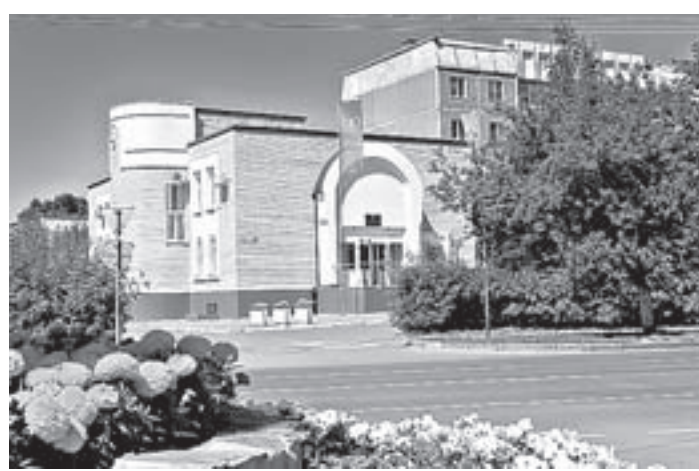
Здание фонда капремонта Алтайского края.

«Новые требования законодательства вызвали большой резонанс по всей стране. Большинство горожан живут в многоквартирных домах. И если в частном доме по определению понятно, кто отвечает за имущество, то в многоквартирном не все жильцы осознавали, что тоже несут ответственность за содержание общедомового имущества и являются