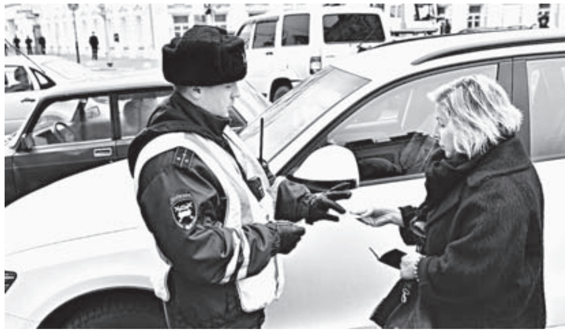
Безаварийная езда позволяет меньше платить по ОСАГО.

Раньше в ФНС нужно было приносить копии бумаг, подтверждающих транспортировку товаров, которые отправляются