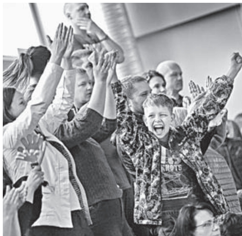
Трибуны «взрывались» после каждого забитого гола.

этому сын надевал шерстяные носки и выходил в них на поле. Победители получили рюкзаки от компании Nike, серебряные призы – спортивную экипировку, а обладатели бронзовых медалей – мячи. Кроме того, отдельными призами были награждены луч-