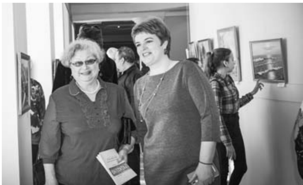
Посетители выставки проходят по залам галереи.

– Вся моя жизнь связана с творчеством, – признается он. – Не представляю себя