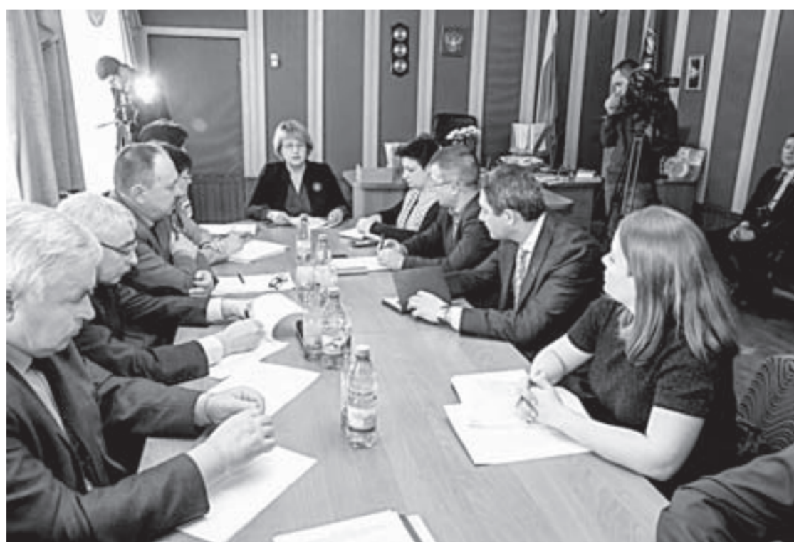
На заседании рабочей группы в администрации Зонального района.