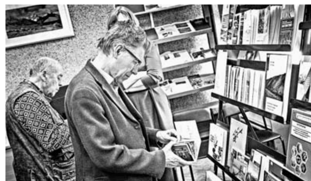
Лучшие книги Алтай выбрали из более 850 изданий.

тареи, где существовали древние обсерватории.