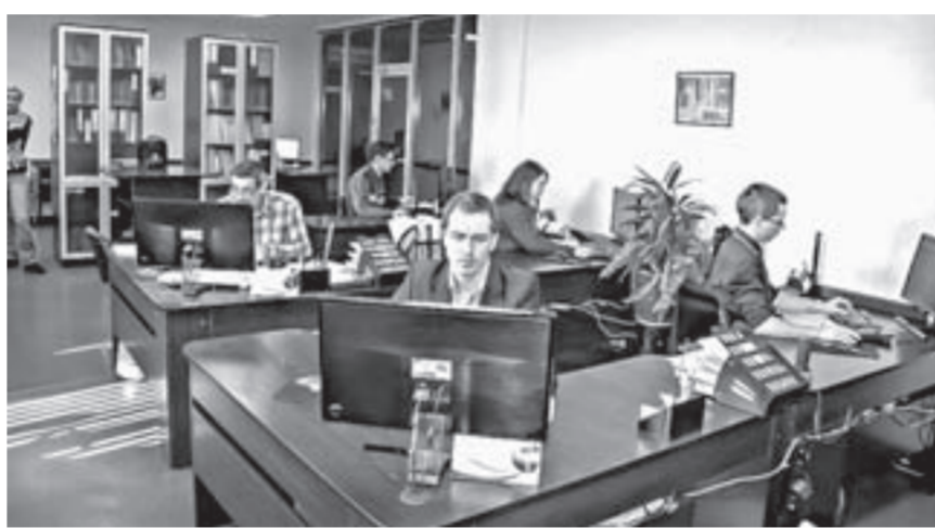
Жизнь котла зарождается в компьютерах конструкторов.