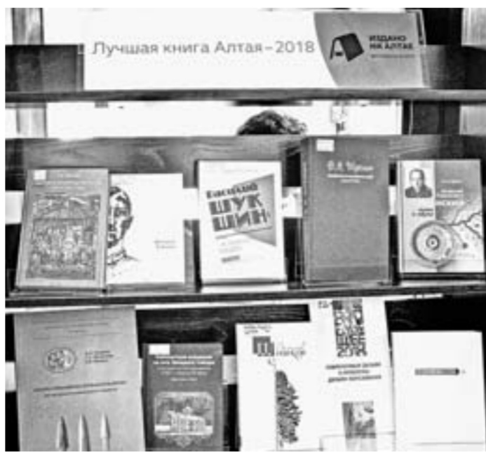
Стенд победителей и лауреатов конкурса.