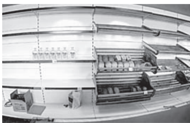
Заводской магазин: полки пусты.

Она также пояснила, что краевая и районная службы занятости ведут работу и с 93 сотрудниками, получившими уведомления о сокращении. Причем из списка на сокращение исключены те, кто относится к социально незащищенным слоям населения: воспитывает детей, является инвалидом, предпенсионеры и так далее. Попавшим под сокращение будут предложены