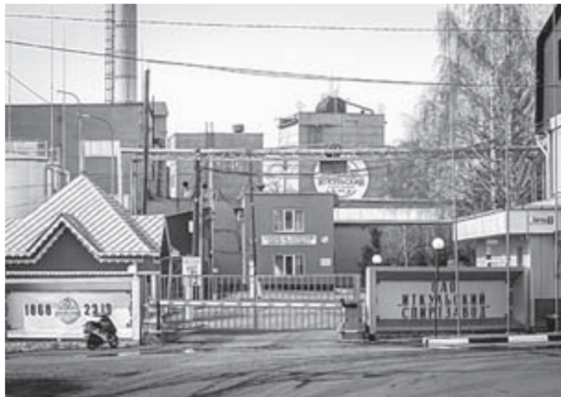
Завод с полуторавековой историей могут закрыть из-за банкротства собственника.