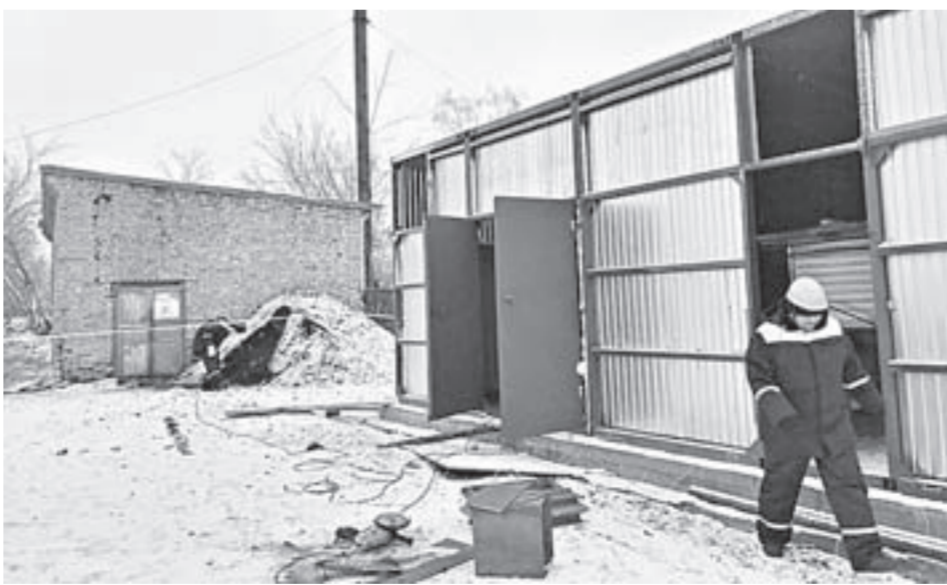
К строительству новой котельной приступили с начала 2019 года.

Вопрос о необходимости ремонта встал все острее, особенно когда все здания,