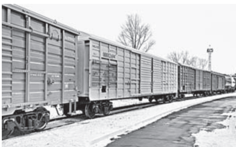
Опытные образцы вагонов.