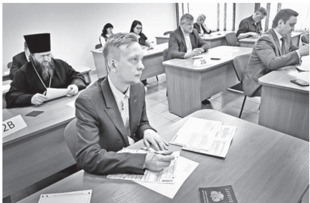
Процедуру сдачи «экзамена с родителями» провели по всем правилам.

В Барнауле в третий раз прошла Всероссийская акция «Единый день сдачи ЕГЭ с родителями», инициатором которой выступила Федеральная служба по надзору в сфере образования и науки. Сдавали русский язык.