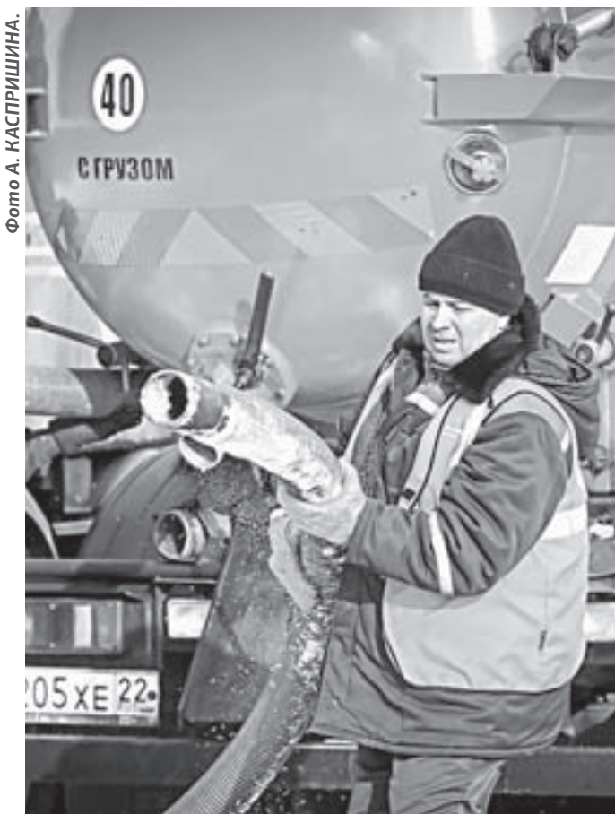
Власти и энергетики намерены резко сократить аварийность на сетях.