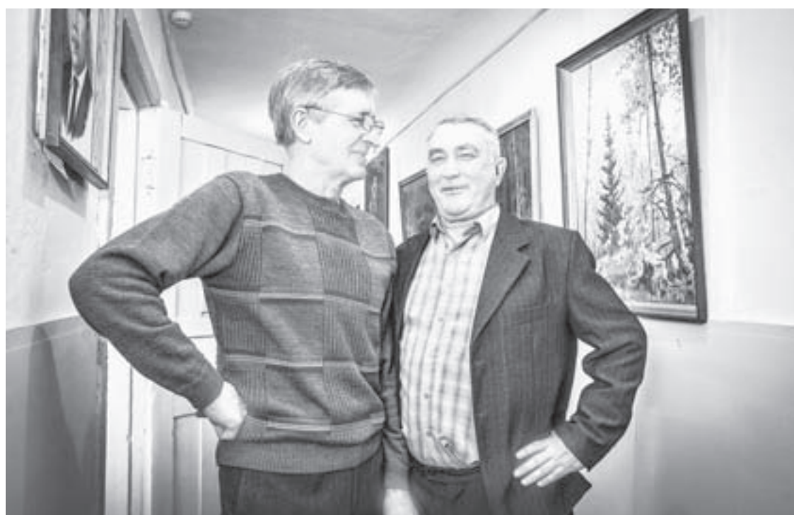
Два художника, два товарища.