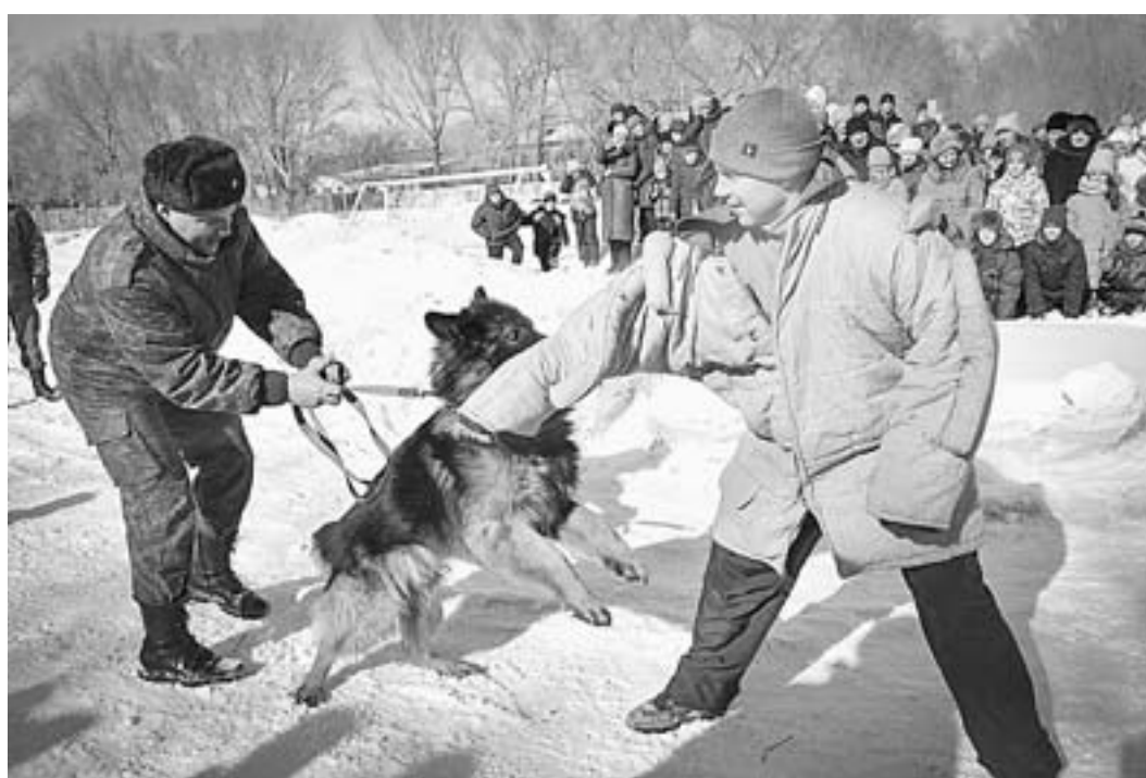
Нарушитель не пройдет.

На другой площадке зрители демонстрировали свое мастерство саперы — с искусственными подразами, транспортников пострадавшего. Неподдельный интерес вызвали выступления служебных собак. Гостям праздника продемонстрировали,