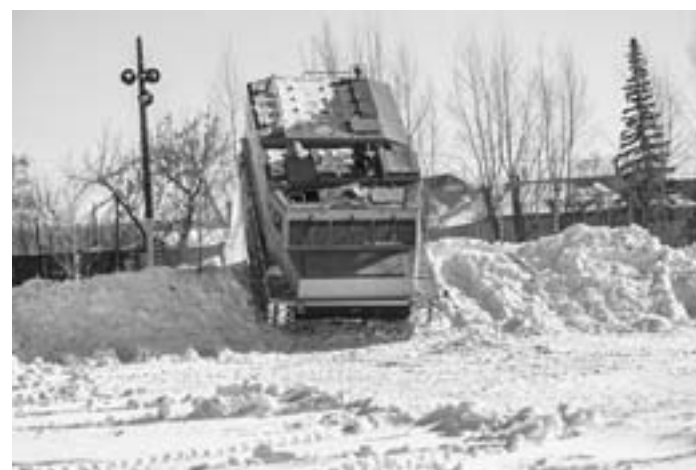
«Марал» преодолевает самый крутой склон.

как проводится задержание нарушителя границы. Всеобщей похвалы удостоился спаниель Мона Лиза, несколько раз безошибочно определивший местонахождение спрятанных наркотиков. — Попривалило, как овчарки бросались на преступников. Я