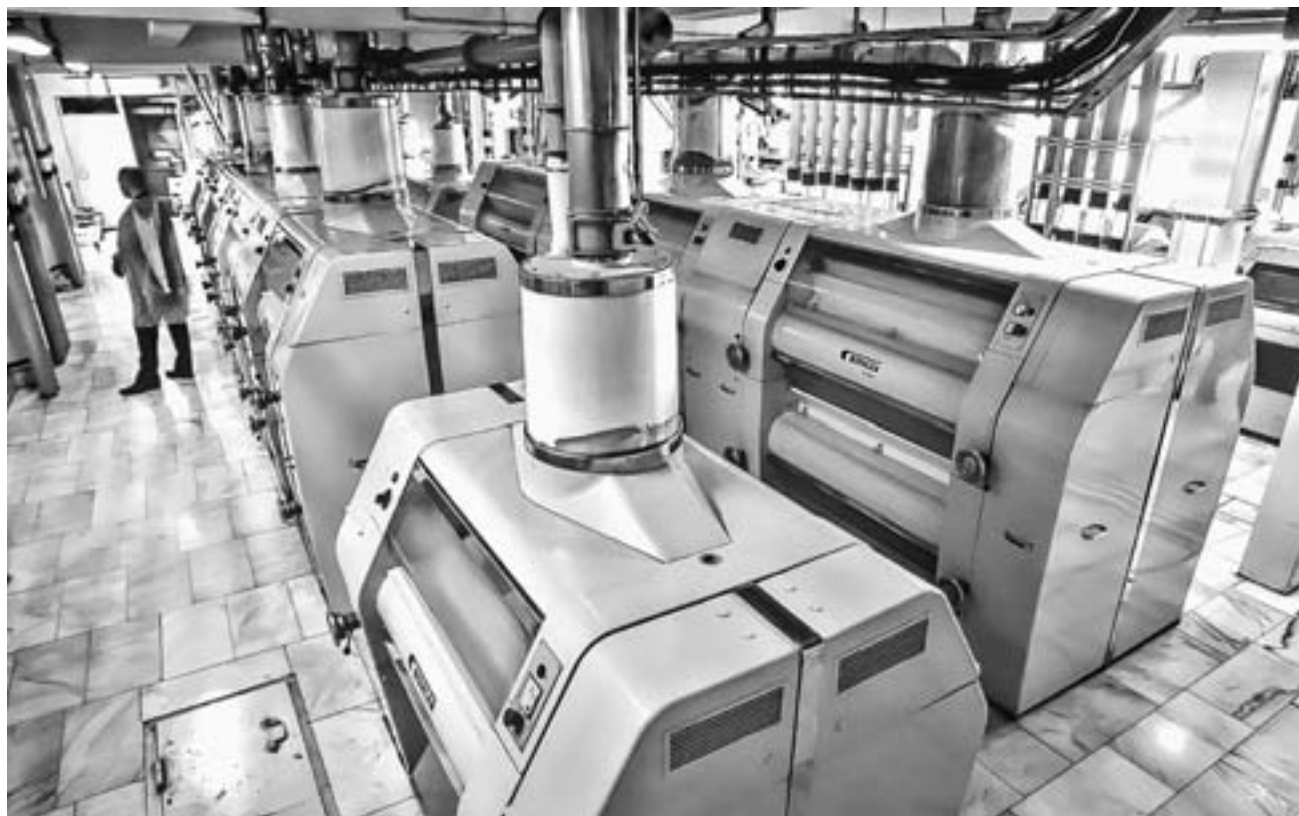
Алтайским зернопереработчикам удается конкурировать на рынке благодаря современному высокопроизводительному оборудованию.

сии вызвали колоссальный рост запасов зерна, которые серьезно давили на рынок, снижая цены. Однако в этом году тренду удалось переломить. Во-первых, в 2018 году в стране собрали зерна хоть и много, но меньше, чем в 2017-м на 20 млн тонн, при этом экспорт остался такой же активный, как и в минувшем сезоне. К тому же начали расти мировые цены на пшеницу. Эти факторы и привели к ее подорожанию в Алтайском крае почти вдвое – до 12,5 – 13 тыс. рублей за тонну, соответственно и муки до 18 тыс. рублей.