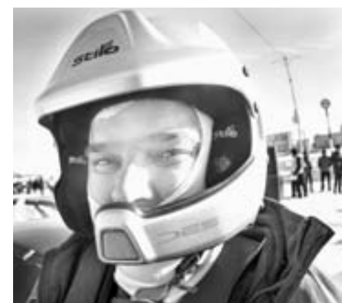
Автомобиль – вещь незаменимая.

В прошедшие выходные в краевой столице состоялся чемпионат Алтайского края по зимним трековым гонкам.