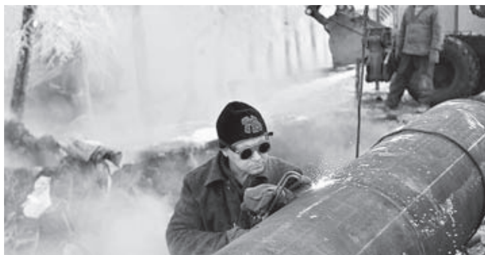
Ремонтные работы провели в сжатые сроки.

В ночь с воскресенья на понедельник в Барнауле произошла серьезная коммунальная авария, оставившая без водоснабжения многоэтажки и административные здания в Железнодорожном и Октябрьском районах.