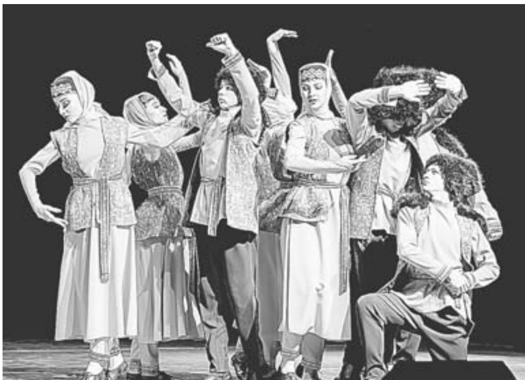
Барнаулский театр танца «Фиеста» получил гран-при.

– Мне кажется, детское кино – государственное дело. Снять его по нынешним временам дело не легкое, – считает он. – Частные инвесторы вкладываться не хотят, поскольку им проще покупать иностранные фильмы. Но российский Фонд кино дает только часть денег, осталь-