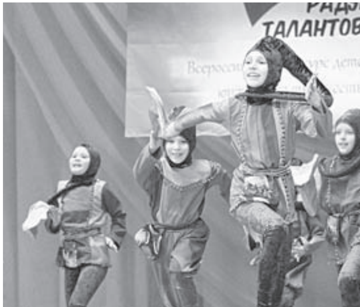
Импровизация по фильму «Формула любви».