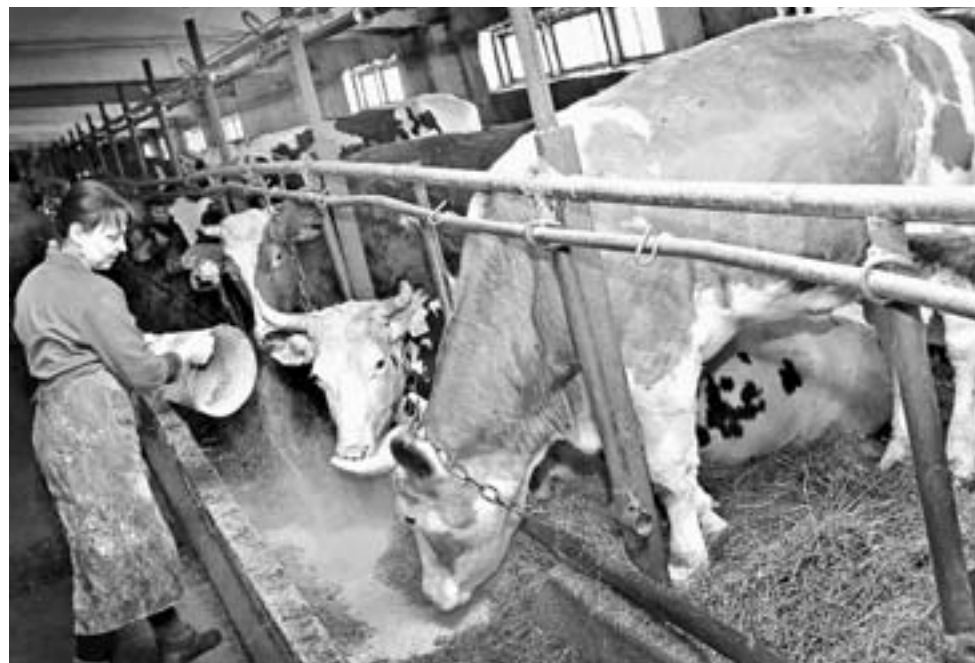
В холод коровам больше дают концентратов.