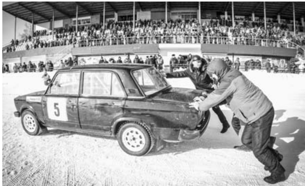
Подвела – не завелась...