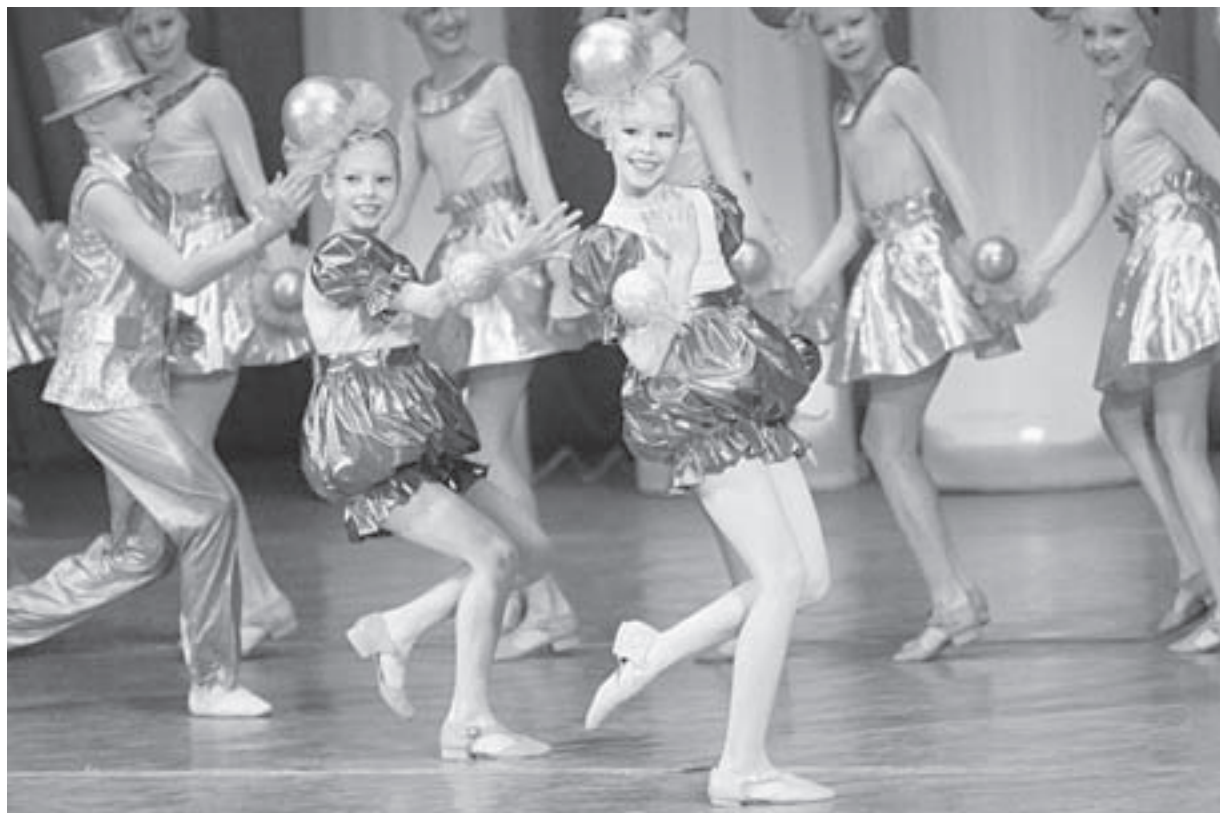
Театр танца имени Розы Фибер.