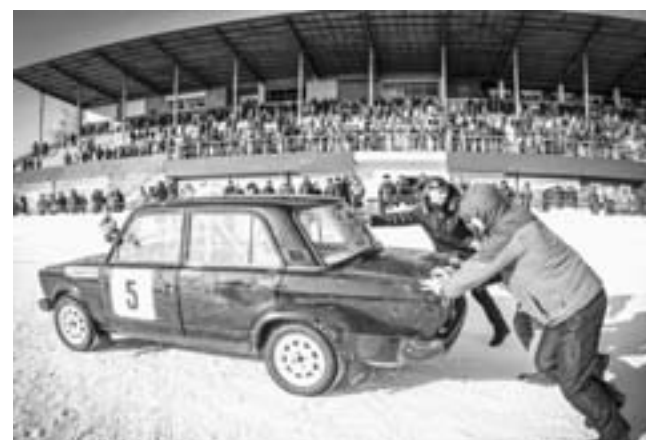
В упорной борьбе.