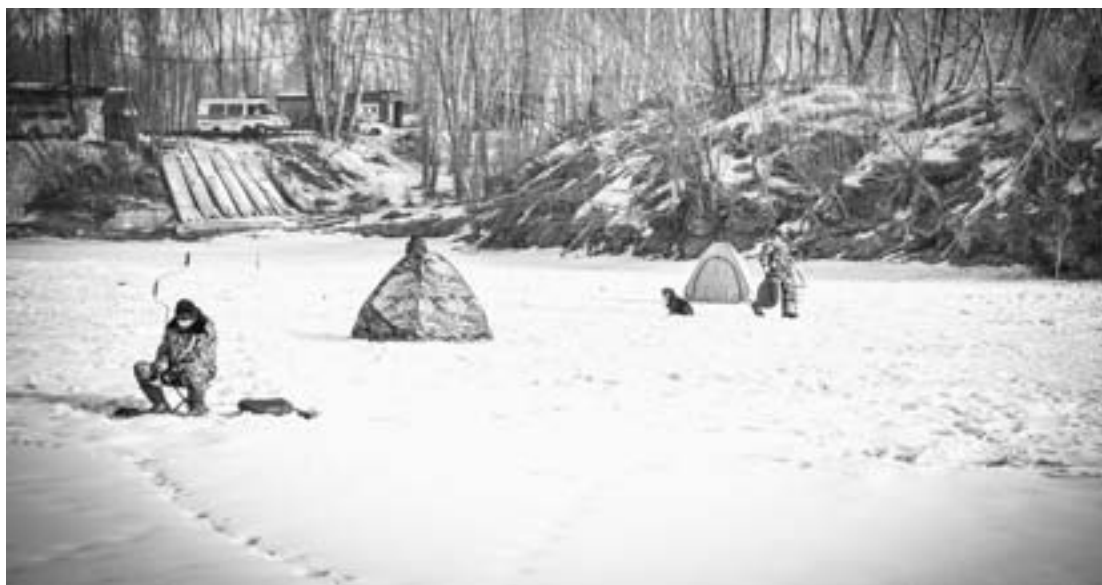
Зимняя рыбалка может быть опасной.