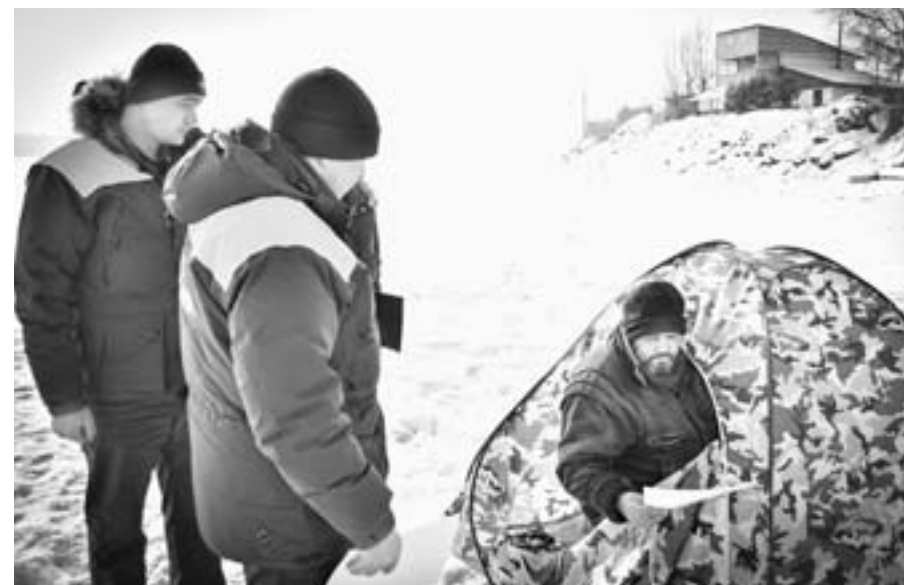
Вручение памяток о поведении на льду.

25 февраля на Алтае началась краевая профилактическая акция «Безопасный лёд».