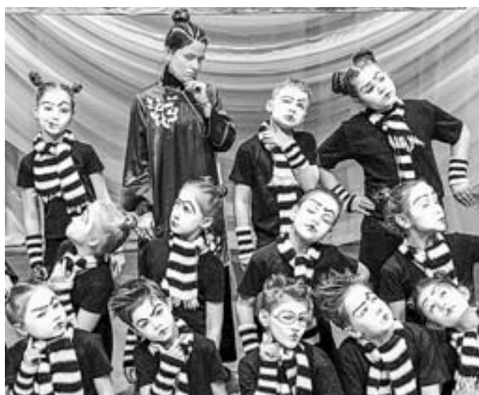
Барнаулский коллектив «ГимнаЗтерна».