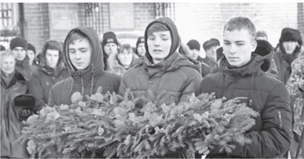
Возложение цветов к Вечному огню.