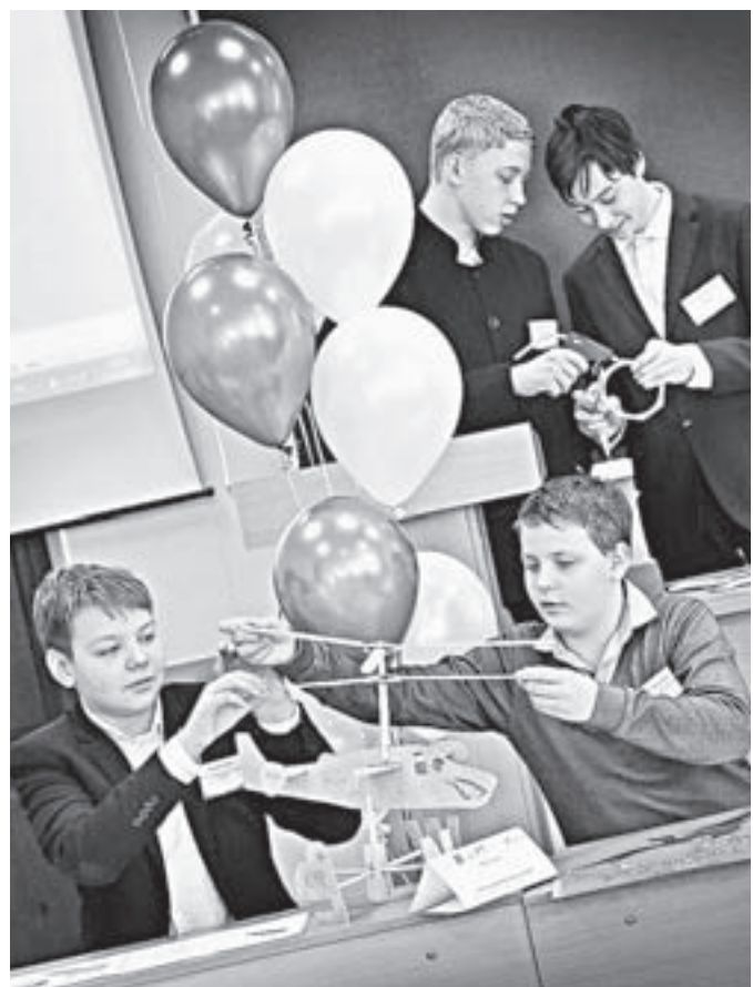
Ребята делились опытом во время состязаний.

– Цифровому прототипированию посвящаю много времени. На выходных приезжаю заниматься в краевой центр информационно-технической работы. Дома стоят модели автоматизированного улья, двигателя внутреннего сгорания. А еще занимаюсь спортом, хожу на борьбу. В прошлом году в крае занял третье место по самбо в своей возрастной категории.