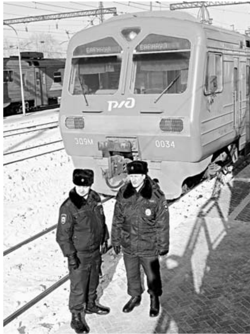
У алтайского управления – богатые традиции.

Считаю, что только благодаря работе всего нашего коллектива, добро-