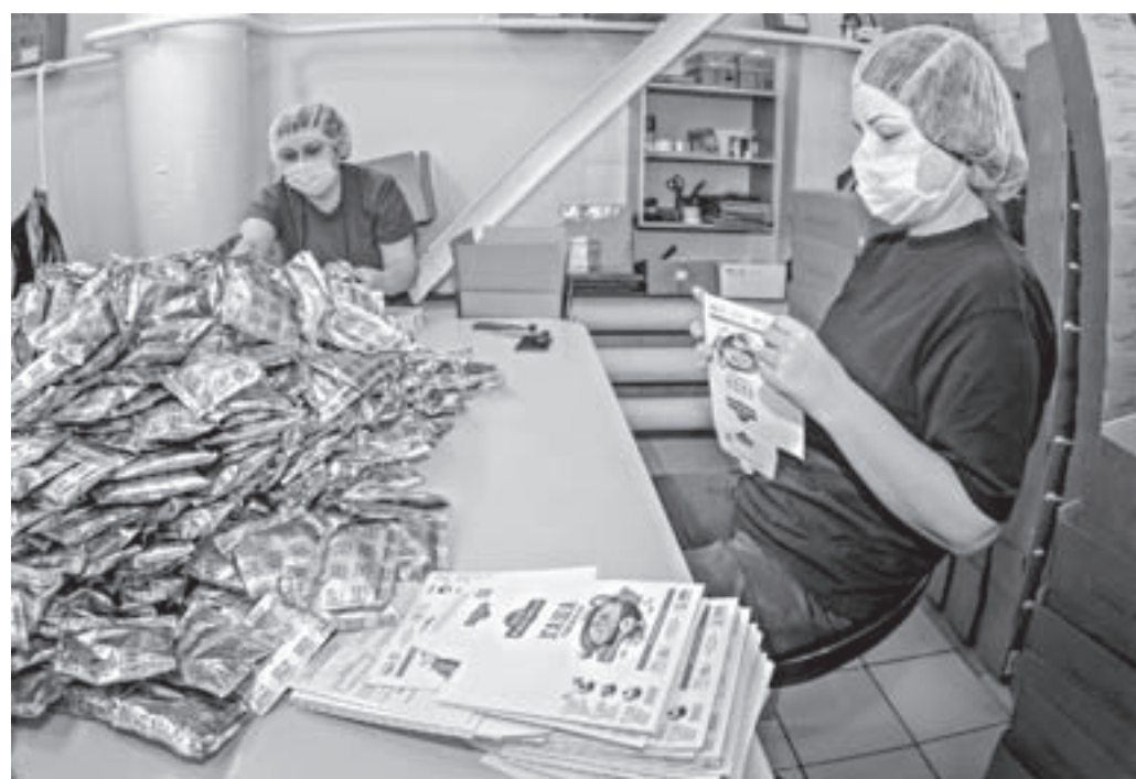
Процесс упаковки масла.