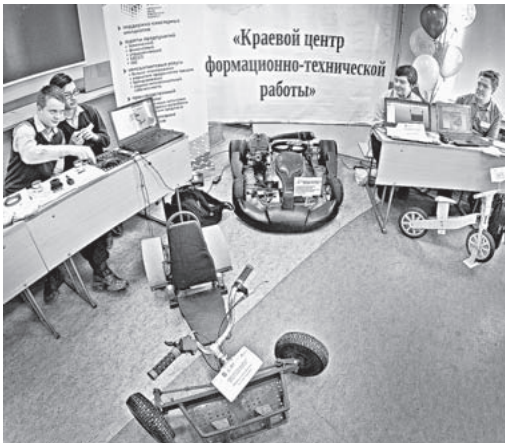
На олимпиаде-выставке по цифровому прототипированию.