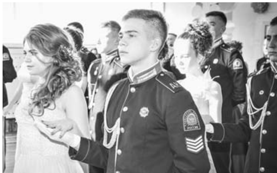
Кадетский бал в ЗАТО Сибирский.

В ЗАТО Сибирский прошел большой кадетский бал по случаю 18-летия образования Алтайского кадетского корпуса.