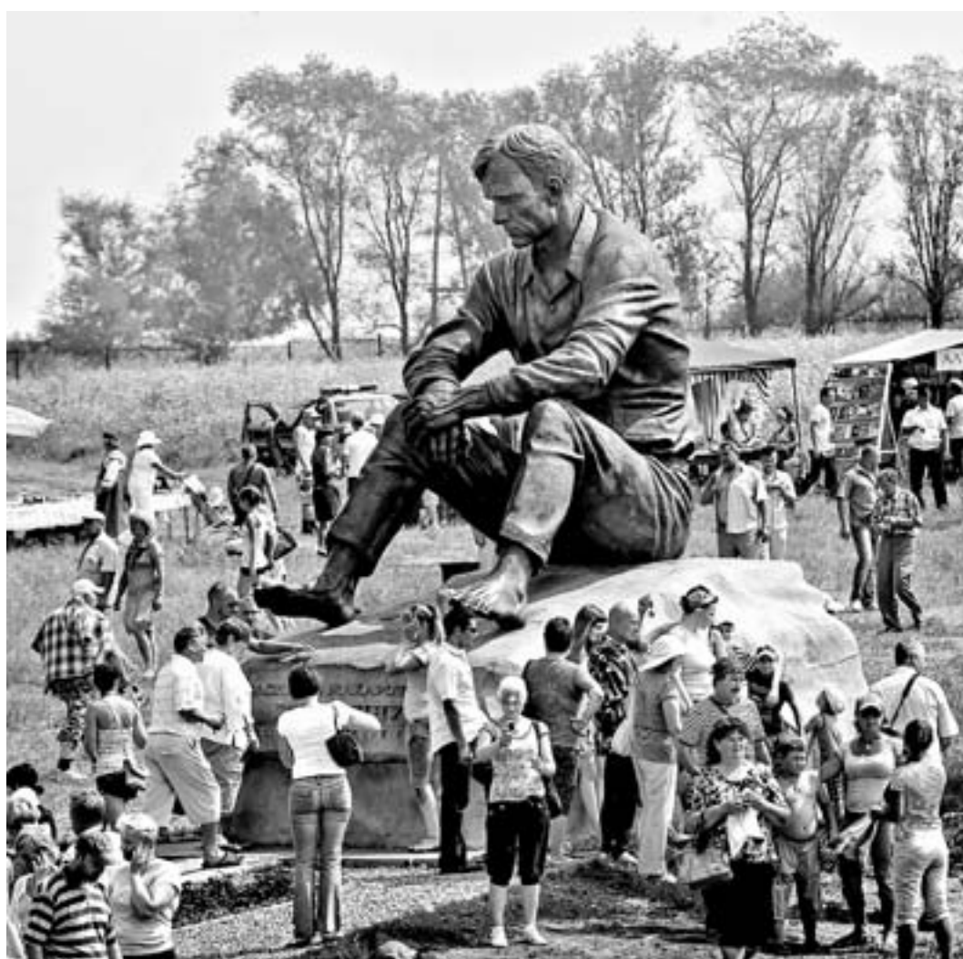
В прошлом году во время фестиваля Сrostки посетили примерно 20 тысяч человек.

Кроме того, дополнительным тиражом выпустят 9-томное собрание сочинений Шукшина и книгу для детей