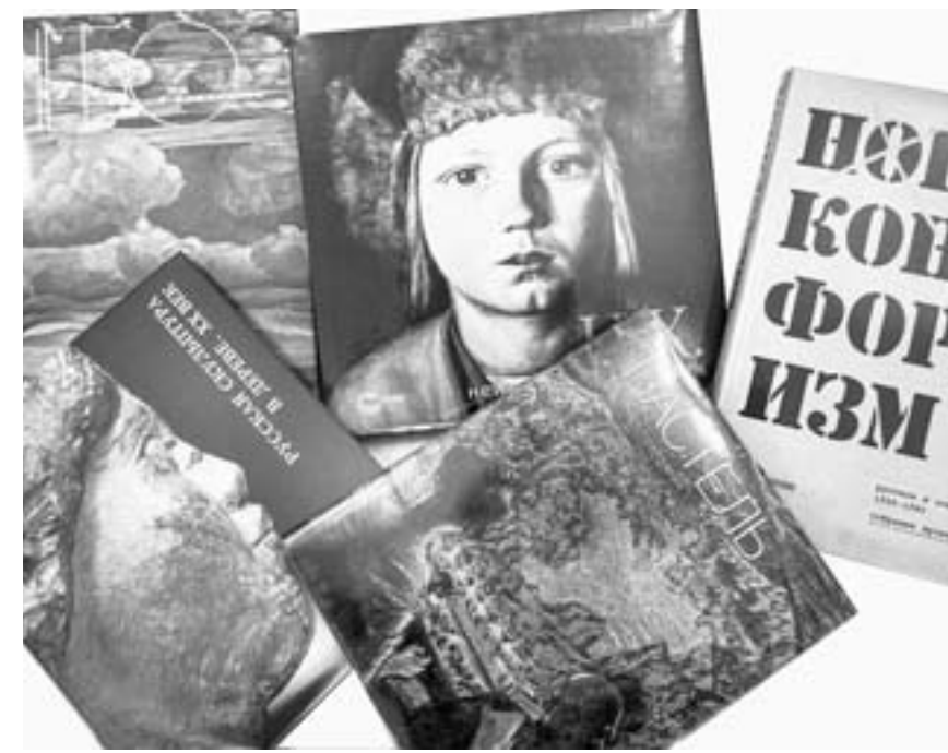
В библиотеке проекта – более 80 печатных изданий, посвященных выставкам, художникам и направлениям в искусстве.

600 МУЛЬТИМЕДИЙНЫХ ПРОГРАММ И ОБРАЗОВАТЕЛЬНЫХ РЕСУРСОВ СОБРАНО В ВИРТУАЛЬНОМ ФИЛИАЛЕ РУССКОГО МУЗЕЯ