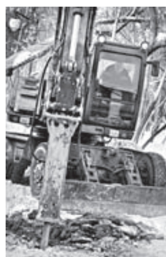
Порыв водопровода на ул. Эмили Алексеевой устранили оперативно.

Барнаульские коммунальные сети в морозы преподнесли жителям не один неприятный сюрприз.