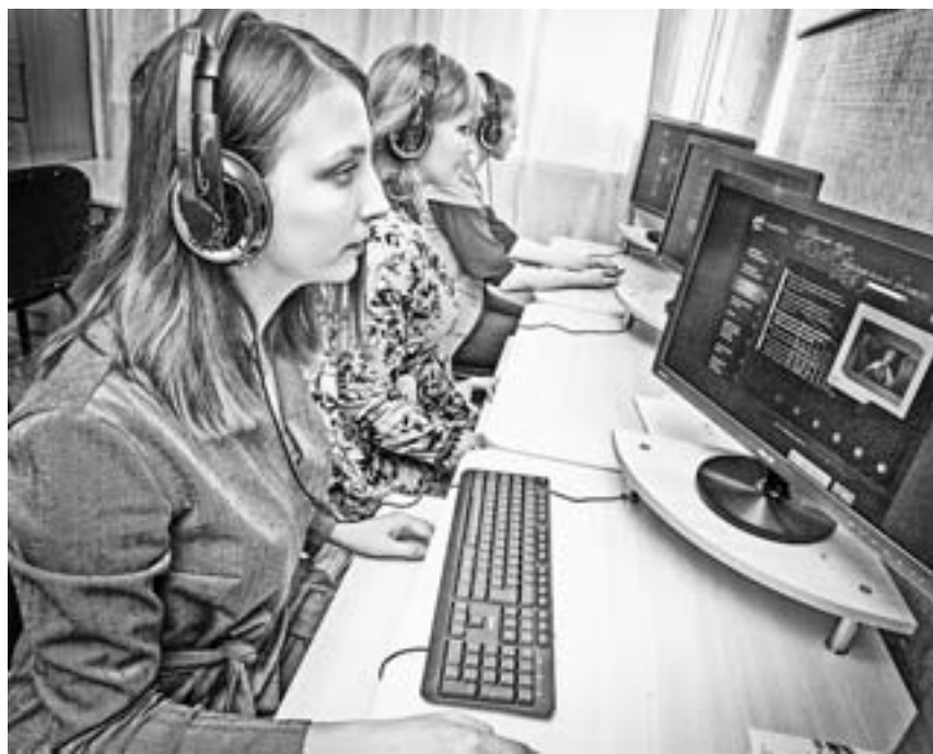
В информационно-образовательном классе виртуального филиала Русского музея можно заниматься индивидуально и с куратором.

– Может показаться, что сегодня в Интернете есть все. Но на самом деле вы заходите на один сайт, другой, третий, где всего понемногу, а информация зачастую очень поверхностная. «Русский музей: виртуальный филиал» предполагает более глубокий подход к образовательным