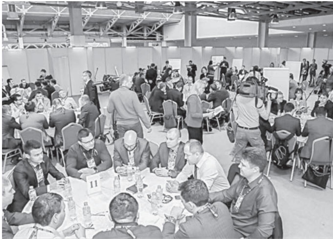
Современные лидеры России.

– Базовое качество, которым должен обладать лидер XXI века, – компетентность, – сказал глава региона. – Второе условие – успешность, она определяется результатами. Умение достигать результата – этим также должен обладать настоящий успешный лидер сегодняшнего дня. Инициативность – надо постоянно генерировать новые идеи, предложения, инициативы. И, конечно, целеустремленность, готовность идти к цели, несмотря на то что иногда бывают поражения, неудачи. Находить в себе силы и вести за собой людей – еще одно важнейшее качество и признак лидера. Вероятно, двое жителей Алтайского края таким набором качеств обладают: