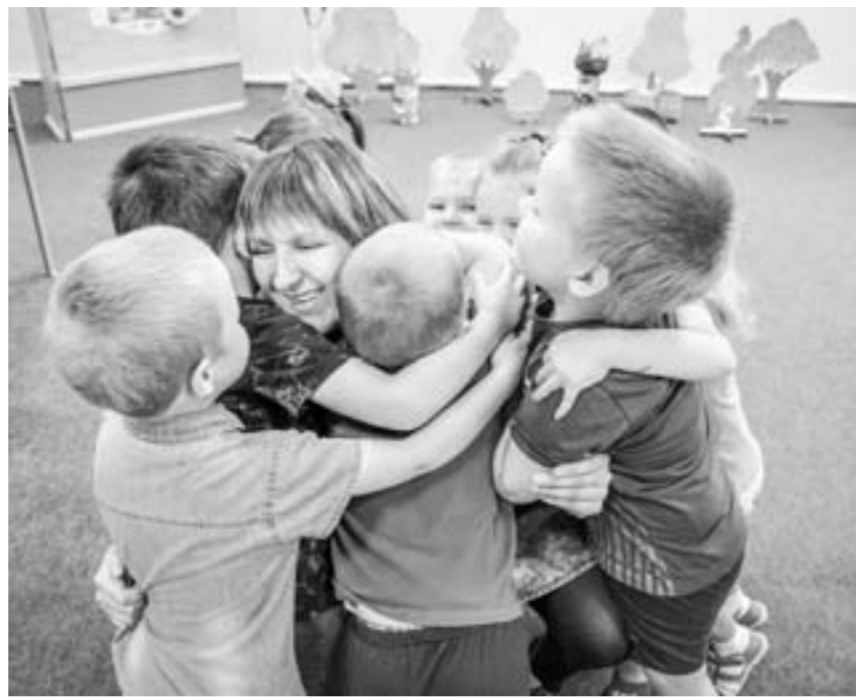
Воспитатель для детей — вторая мама.

Дополнительные группы для детей 2-3 лет созданы в каменских детских садах № 15, 17, 27 и 189. Все они расположены в густонаселенных микрорайонах города. В момент нашего визита в наибольшей степени готовности было помещение для но-