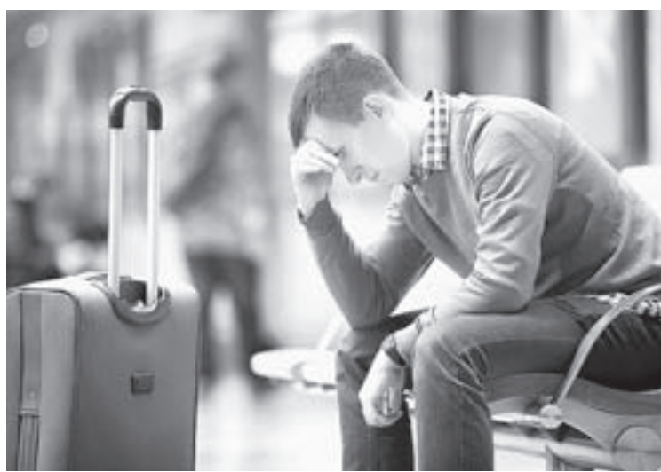
Отпуск может быть испорчен, если выбрать ненадежного туроператора.