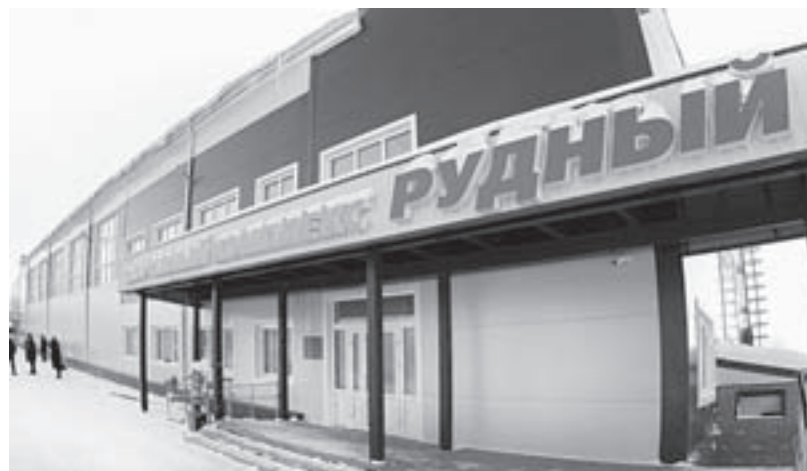
Современное здание стало украшением города.