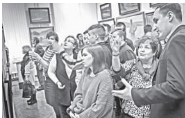
В зале краеведческого музея.