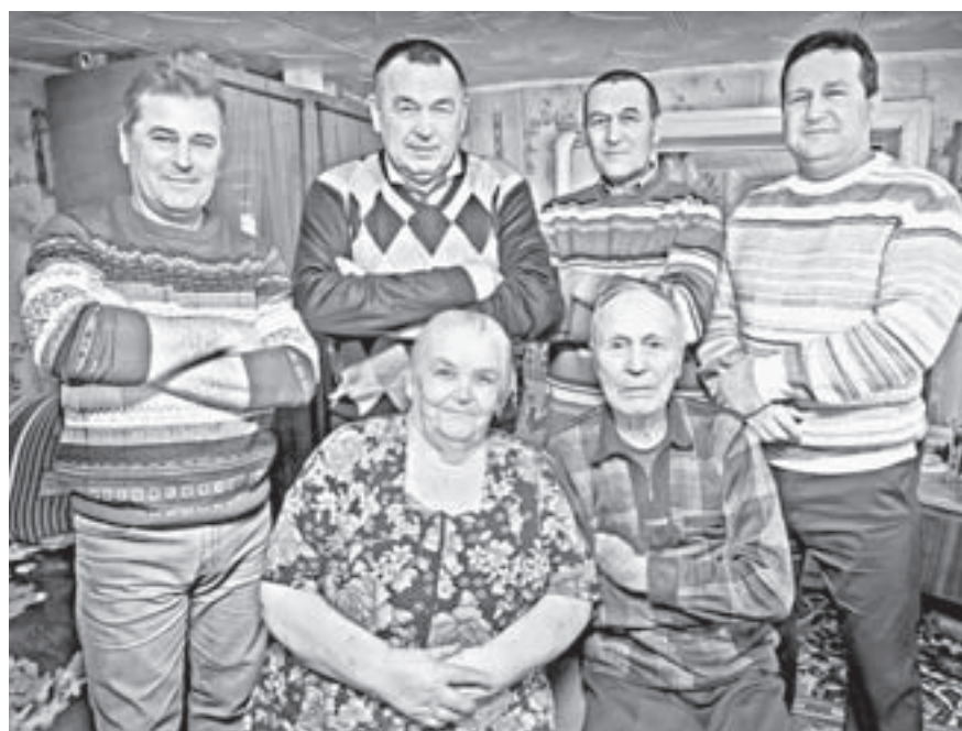
Хорошее дело – растить сыновей.