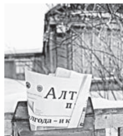
В почтовом ящике Онищенко – «Ал» более 60 лет.

Удивительно, что почти ушло из обихода понятие многопоколенной семьи, хотя сами эти ячейки общества, в которых хорошо всем, от бабушек до