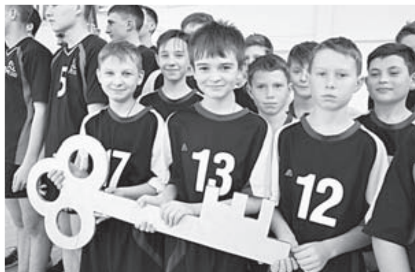
Открытие «Рудного» дети ждали с нетерпением.