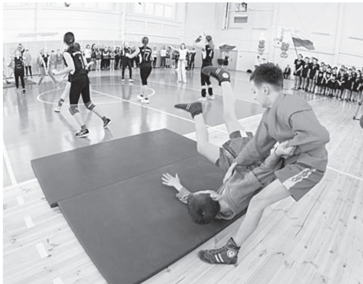
Благодаря такой арене тренироваться в Змеиногорске будет одно удовольствие.

В Змеиногорске 25 декабря торжественно открыли двухэтажный спортивно-оздоровительный комплекс.