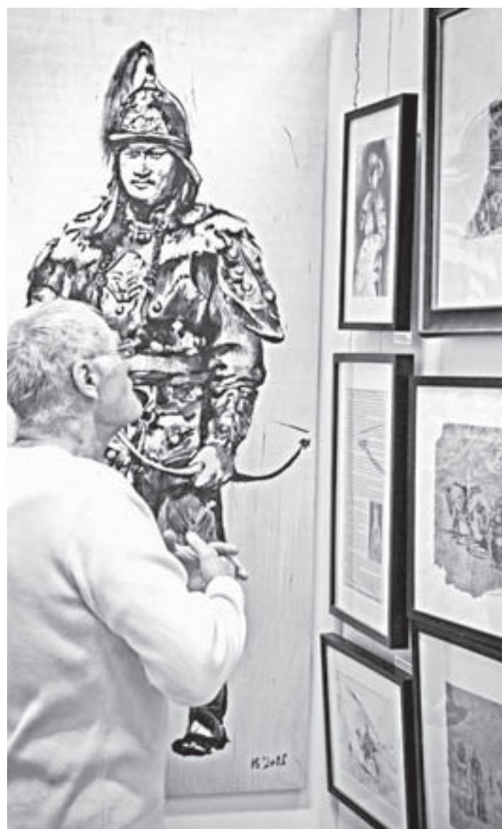
Выставочное пространство придает знакомым работам этнографическое звучание.