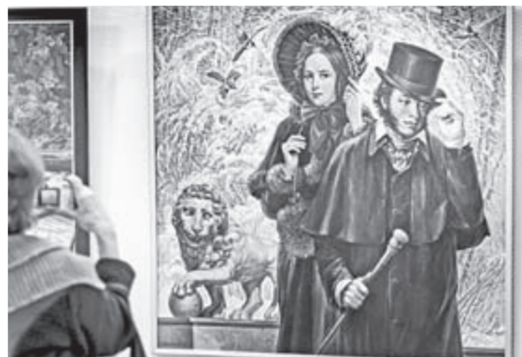
В экспозицию вошли работы всех видов и жанров.