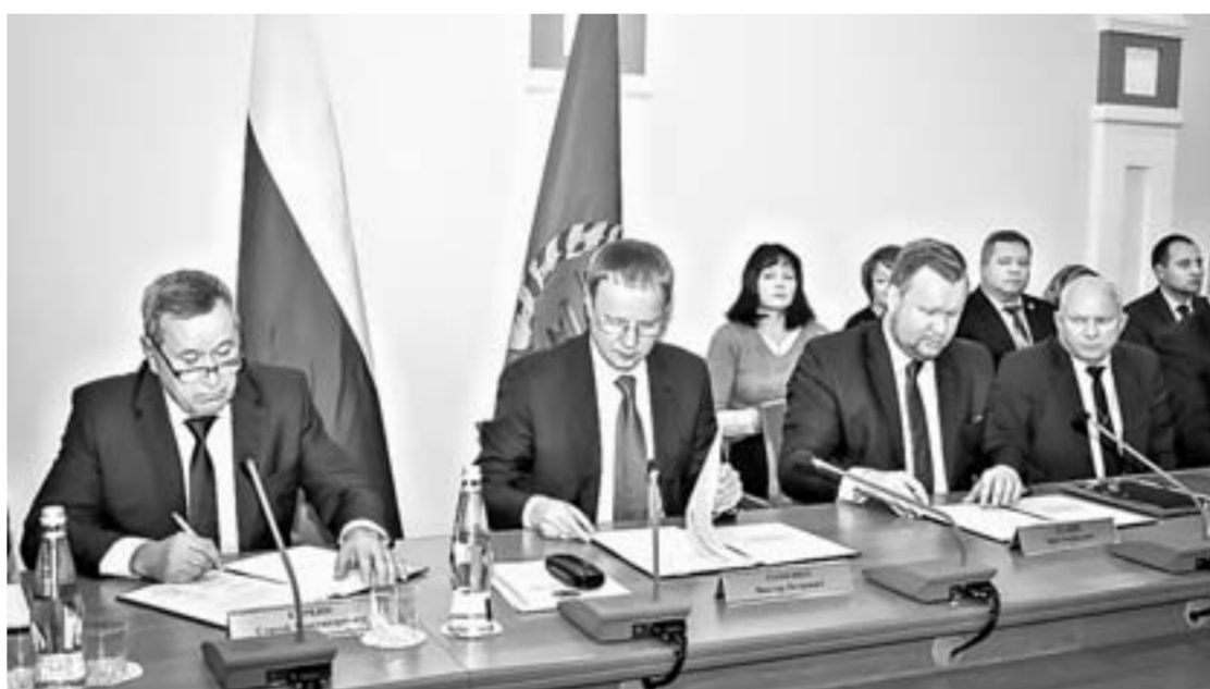
Переговоры были нелёгкими, но стороны пришли к общему мнению.

«Сегодня мы подписываем важный документ, – сказал Виктор Томенко – Большая работа проводилась на переговорном этапе. Всегда не просто достичь полного соглашения по всем позициям. Тем не менее нам удалось достичь взаимопонимания по вопросам темпа роста заработной платы в организациях реального сектора экономики. Здесь она отстает от бюджетной. За 10 месяцев 2018 года, например, она составила 24 тысячи рублей, в то время как в организациях бюджетной сферы края заработная плата достигла почти 26,5 тысячи рублей. Это накладывает на нас определенные обязательства, надо дисбаланс исправлять. Сегодня мы подписываем документ, который положительно отразится на уровне жизни более 130 тысяч работников края.