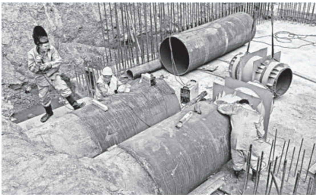
Работы на теплотрассах нужно проводить до наступления холодов.