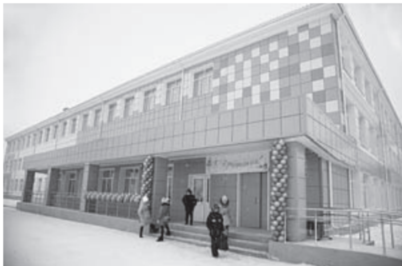
...и так – после капитального ремонта.

есть возможность переодеться в школе и не носить с собой сменную обувь. В школе создана безопасная среда, и родители могут быть спокойны за своих детей.