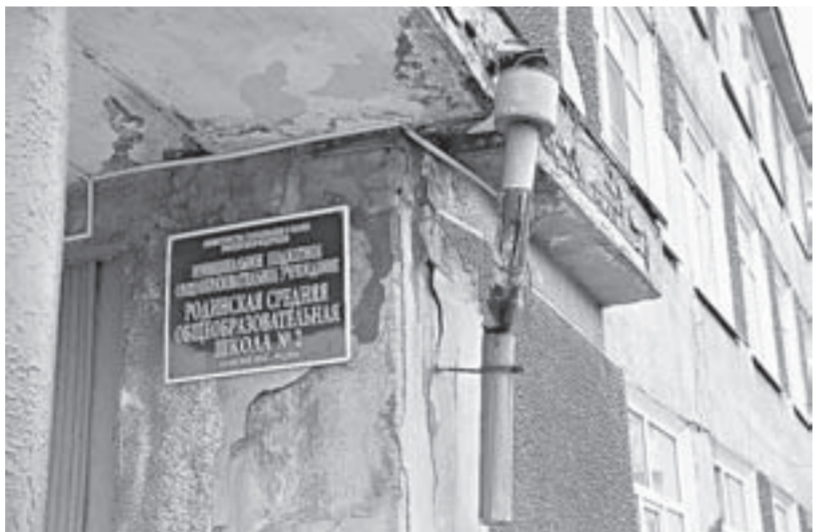
Так выглядела школа весной...