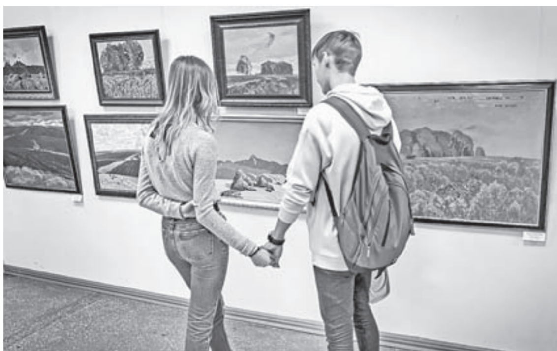
В Выставочном зале музея «Город» сегодня представлено только профессиональное искусство Алтай.