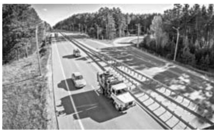
Чуйский тракт после реконструкции в этом году.

Такие данные прозвучали на заседании правительства края, которое провел губернатор Виктор Томенко. Глава региона отметил, что качественные дороги для региона – одна из приоритетных тем. Алтайский край занимает первое место в стране по протяженности автомобильных дорог общего пользования регионального или межмуниципального значения. – В регионе более 16 тысяч километров дорог, – выступая с докладом, сообщил министр транспорта Александр Дементьев. – В связи с тем, что основная сеть магистралей общего пользования на территории края была построена в 80-е годы прошлого века и отслужила более двух сроков, вопрос сохранения дорожного полотна сейчас стоит очень остро. Нормативному состоянию сегодня соответствуют 38% дорог. В 2018 году отремонтировали около 700 километров – это 5% общей протяженности дорог.