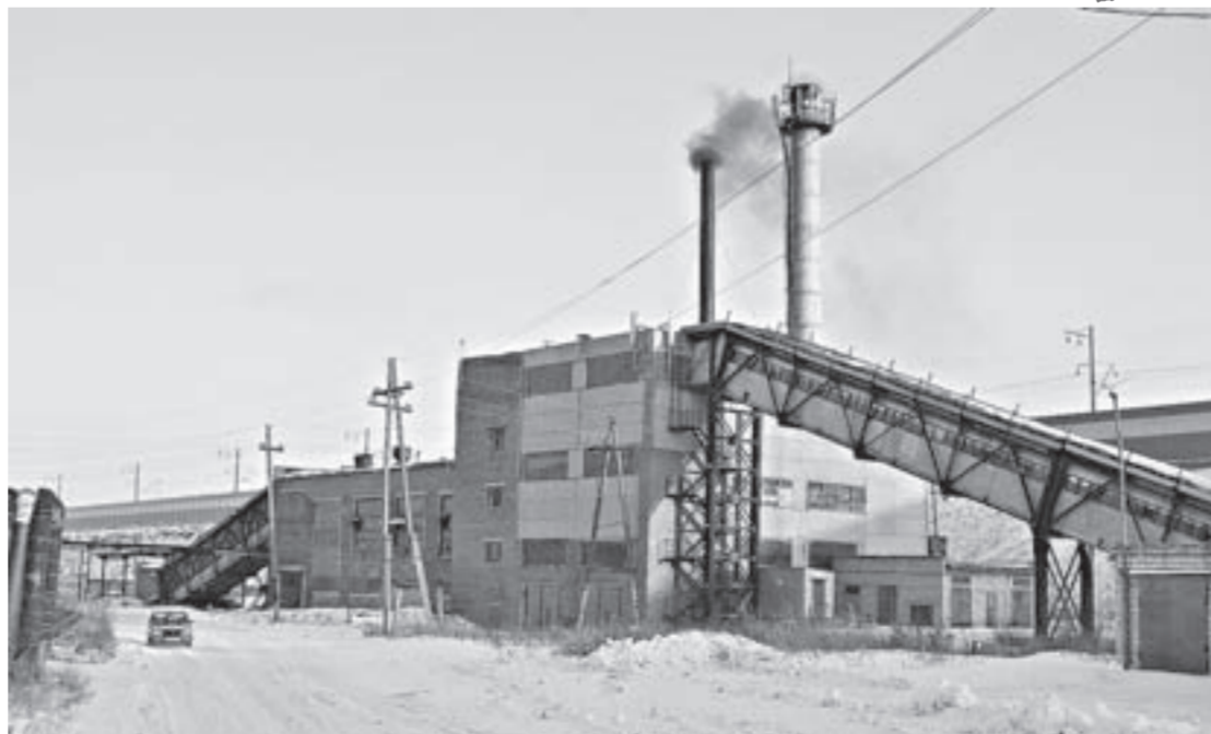
Поддержка края позволит каменцам провести праздничные дни в тепле.

– Удалось в течение этих двух месяцев обеспечить бесперебой-