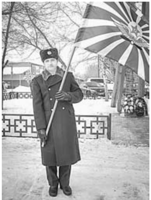
Ветераны ВВС Славгорода снова в строю.

Славгородский авиационный полк был сформирован на основании Директивы Генерального штаба от 29 декабря 1967 года и Директивы Главного штаба ВВС от 26 января 1968 года. Основной задачей полка была подготовка летчиков фронтовой бомбардировочной авиации. Расформировали полк 1 октября 1999 года.