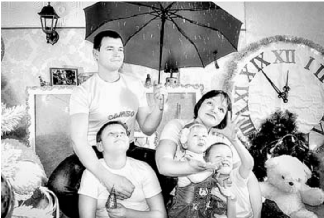
В фотозоне Панкрушихинской редакции.