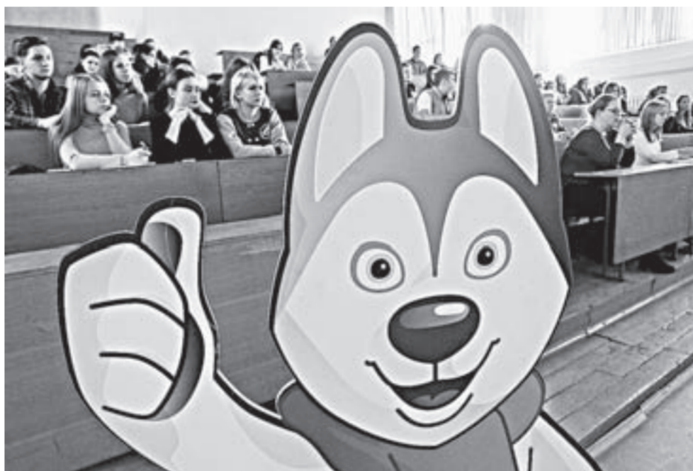
К эстафете вместе с символом состязаний – У-лайкой готовятся алтайские волонтеры.