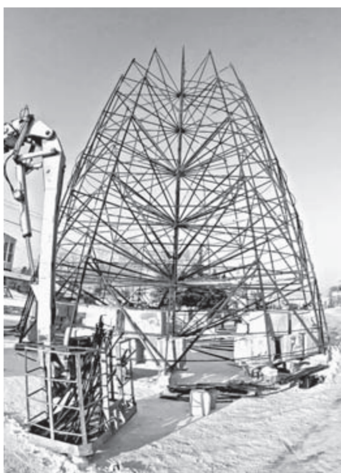
Главная праздничная елка края растет на глазах.

На площади Сахарова Барнаула вовсю идут строительные работы. Там начали установку главного новогоднего символа края – искусственной ели, которую приобрели в прошлом году.