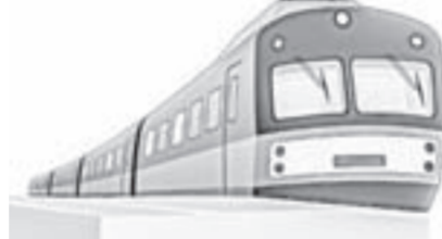
Подготовила Алена ИВАНОВА

С воскресенья, 9 декабря, в Алтайском крае меняется расписание пригородных поездов. Электropоезд № 7105 Заринская – Барнаул будет отправляться на 40 минут раньше – в 6.50 по будним дням. № 6235/6225 Артышта-II – Аламбай – Барнаул: отправление на 46 минут позже – в 16.08. Он ходит каждый день. № 6769 Аламбай – Заринская: отправление на 18 минут позже – в 20.54. Поезд курсирует ежедневно. № 6016 Барнаул – Черепаново: отправление на 12 минут позже, то есть в 15.06. Поезд ежедневный. № 6774/6783 Барнаул – Среднесибирская – Камень-на-Оби будет отправляться на 10 минут позже – в 16.25. Ходит каждый день. Как сообщают в ЗСЖД, еще у 29 поездов расписание изменится незначительно – на 1–6 минут. Вместо электропоезда № 6770 Заринская – Аламбай назначат № 7106