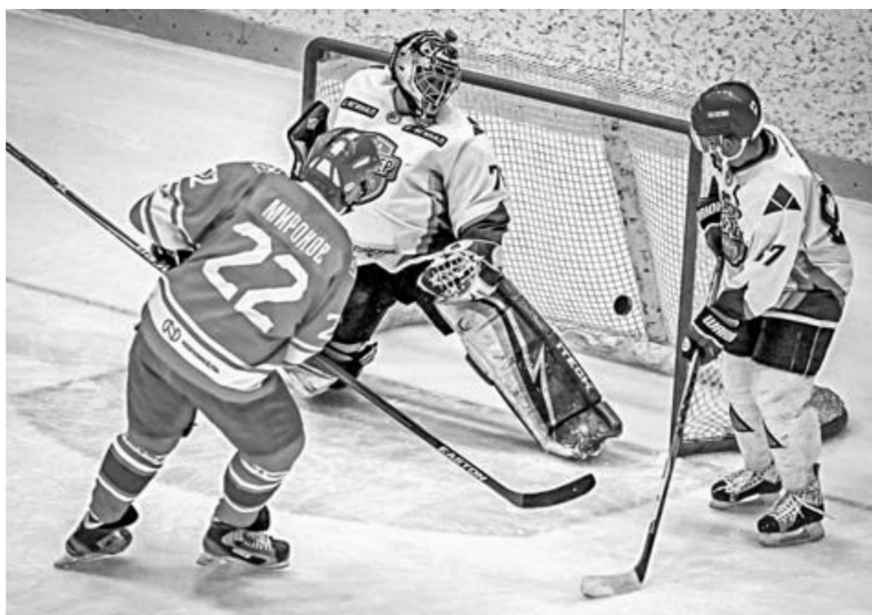
Олимпийские чемпионы показали виртуозное мастерство.