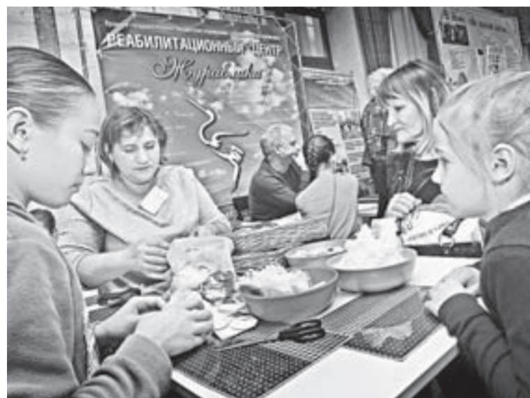
Перед торжественной частью работали мастер-классы и выставка.