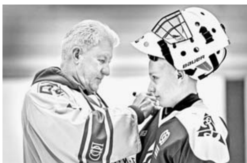
Прославленный голкипер Владимир Мышкин охотно раздавал автографы.

леду началось жаркое противостояние. Суперигроки, перед которыми снимала шляпу вся хоккейная пла-