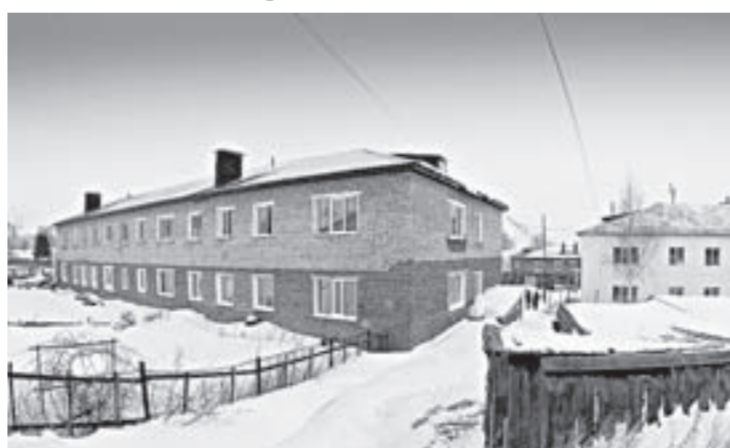
В Змеиногорске, на ул. Крупной, 23 и 25 были перебои с водой, и с теплом.

На еженедельном оперативном совещании в АКЭС спикер