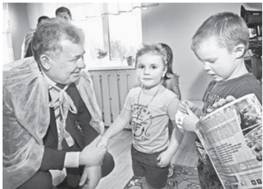
Приятная встреча. Председатель АКЗС пообщался с малышами.