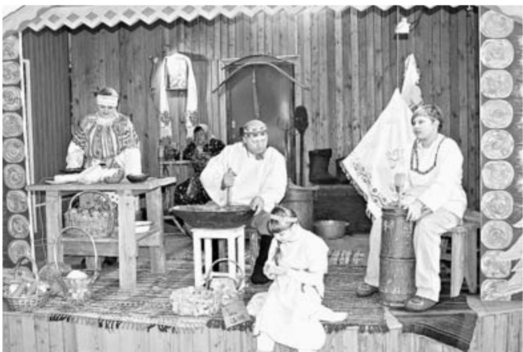
Инсталляция «Русская изба».

В необычной атмосфере прошел в прошлой неделе День работника сельского хозяйства в Усть-Калманке. Из сёл приехали делегации труженников полей и ферм, специалисты и руководители хозяйств.