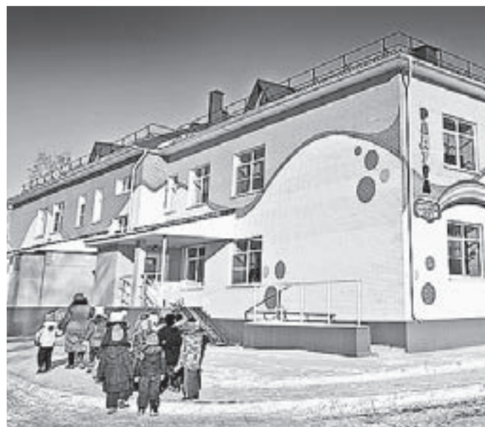
Детский сад «Радуга» в Поспелихе.

заготовки зерна до отгрузки готовой продукции. Макароны из зерна твердых сортов пшеницы под известным брендом «Гранмулино», мука и крупы широко известны и востребованы в стране.