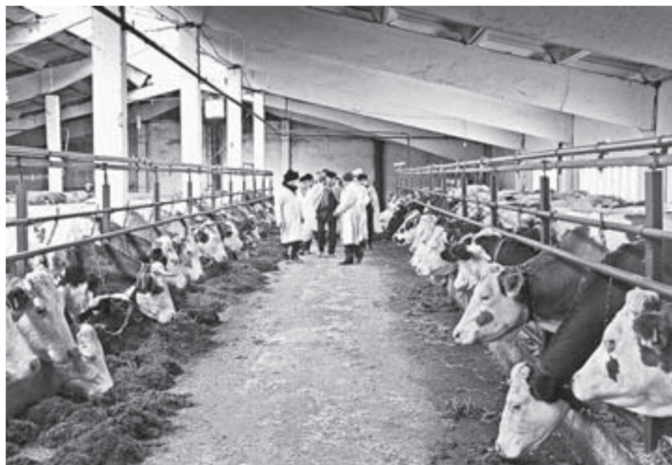
Животноводческий комплекс «НФХ «Стиль».

Депутаты посетили несколько промышленных и социально значимых предприятий района. Среди них – Поспелихинская макаронная фабрика, одна из немногих в России с полным циклом производства – от