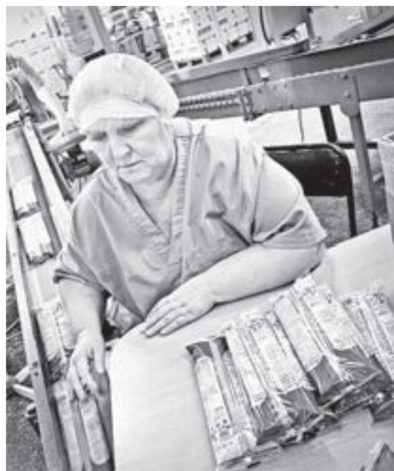
Укладчики-упаковщики следят за герметичностью упаковки макаронных изделий.