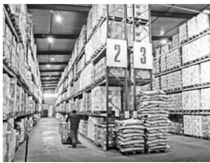
Склад готовой продукции Поспелихинской макаронной фабрики.