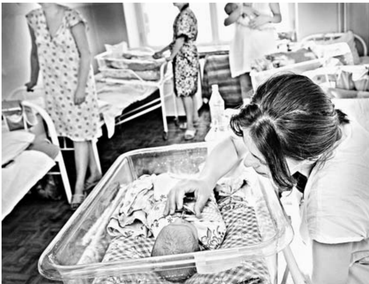
Во втором роддоме появился на свет канждый третий барнаулец.