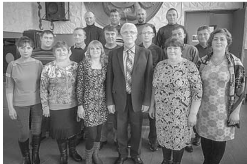
Делегация хозяйства «Русское поле» Новичихинского района.

Здание школы за 30 лет своего существования ни разу капитально не ремонтировалось, если не считать замены кровли на металлическую. Особенно в плачевном состоянии до недавнего времени находился спортзал. Зимой температура воздуха опускалась до +5 градусов, иногда пол после мытья покрывался ледяной корочкой. При этом