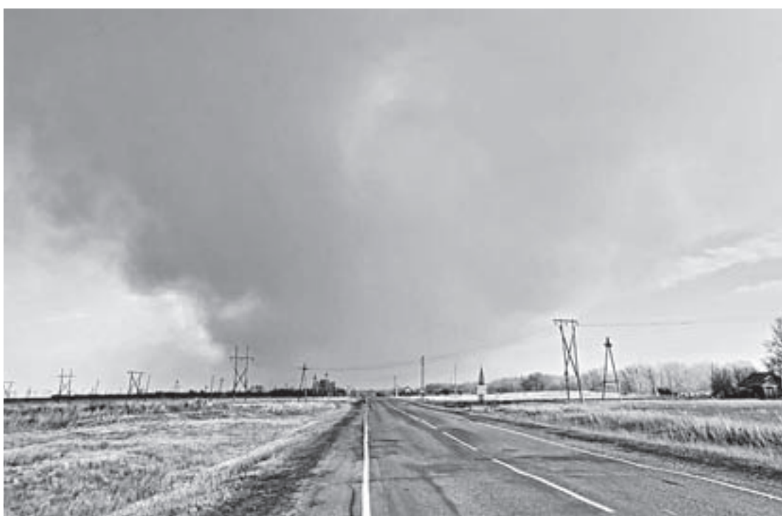
Пожар в Курьинском районе.

В ГУ МЧС РФ по Алтайскому краю рассказали, что сведения о грядущем шторме были донесены до всех руководителей муниципальных образований региона. В Алейском, Змеиногорском, Краснощёковском и Топчихинском районах, а также