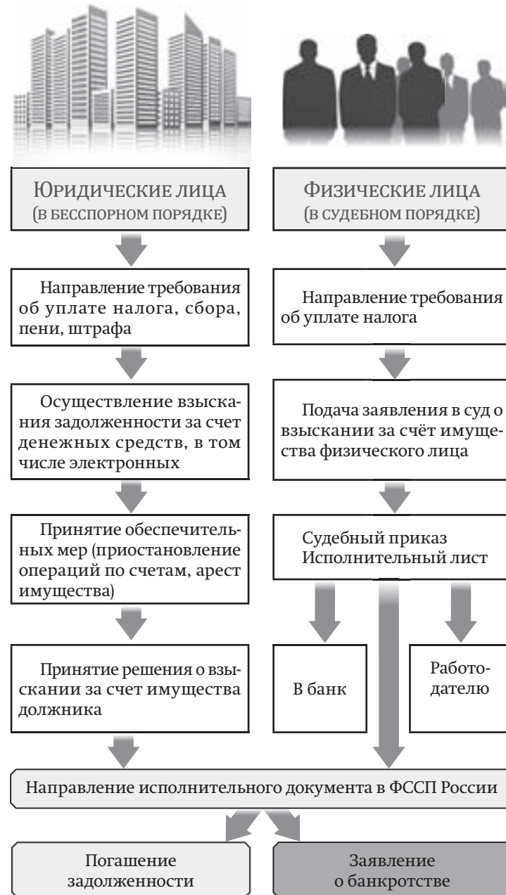
Схема осуществления налоговыми органами процедуры принудительного взыскания задолженности с налогоплательщиков, не исполнивших обязанность по уплате обязательных платежей в установленный срок

пока заявлений на рассрочку подают очень мало: 20–40 в год.