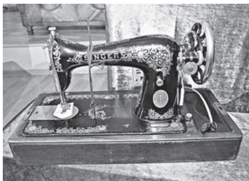
Раритетная швейная машинка «Зингер».

почетное место займет свой многоуважаемый шкаф – из «дома, милого дома» семьи Роберта Рождественского. Но не только этот музейный предмет позволит гостям создать представление о хлебосольном и гостеприимном доме: порядка 80 (!) будущих экспонатов передала в ГМИЛИКА дочь поэта Екатерина Рождественская.