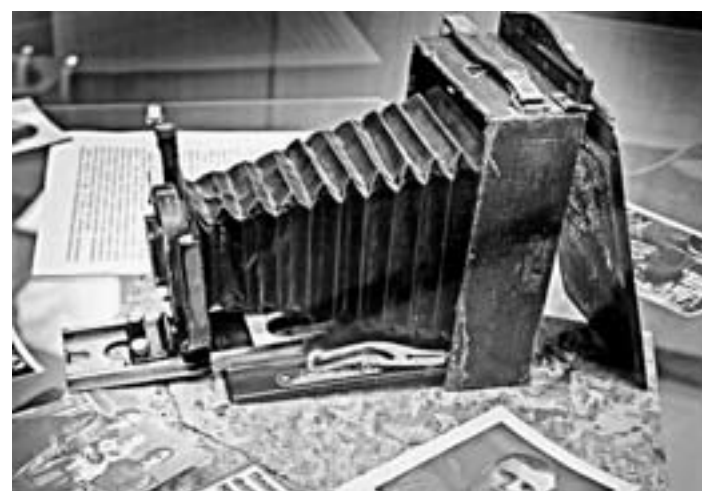
Старше остальных экспонатов – пластиночный складной фотоаппарат «Фотокор № 1».

Внимание гостей привлечет раритет «Зоркий». Предшественником была дальномерная штормовая камера, которую выпускал Харьковский завод им. Ф.Э. Дзержинского. В годы Великой Отечественной войны предприятие пришлось эвакуировать. Первая линия «Зоркого» была запущена в 1947 году в Новосибирске. Он отличался более прочными деталями кор-