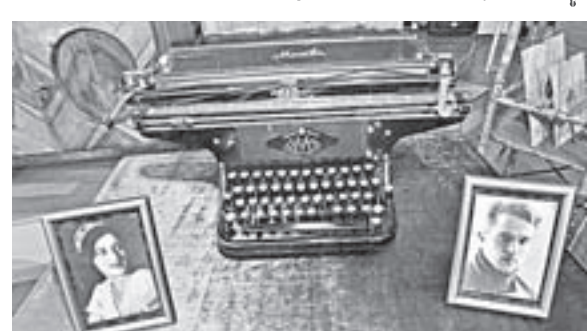
Эта машинка видела, как рождаются гениальные стихи.

Светлана АЛЕКСАНДРОВА