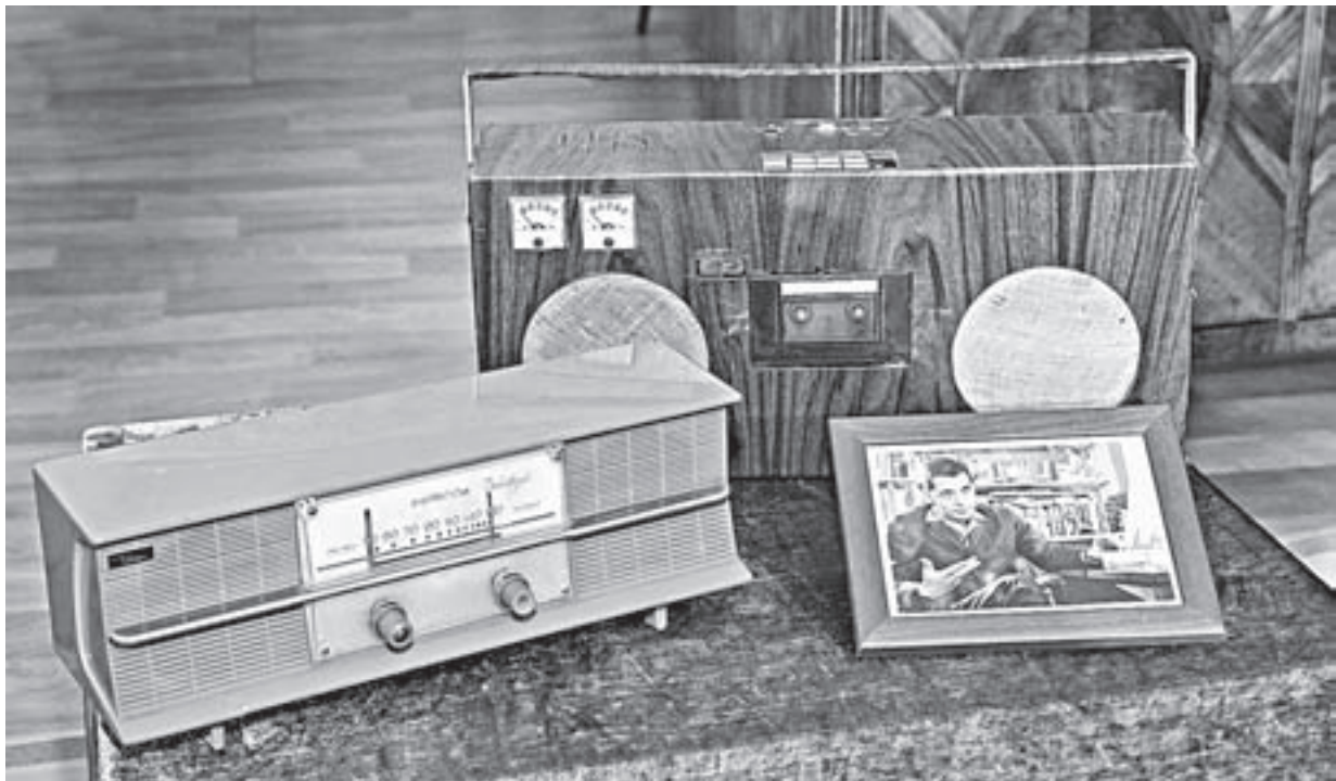
Магнитофон и радиоприемник из кабинета Рождественского.