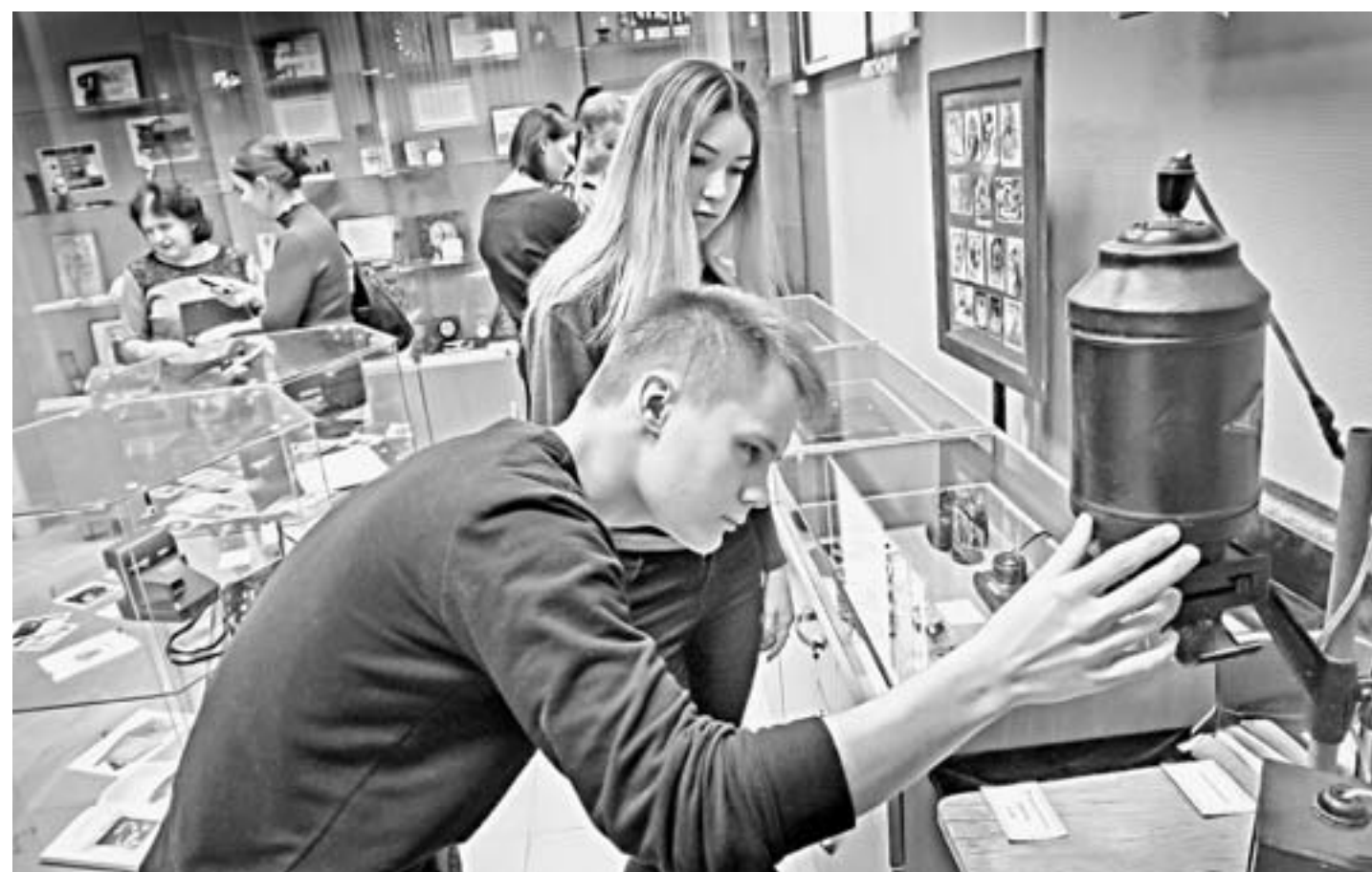
Первыми с раритетами ознакомились барнаульские студенты.