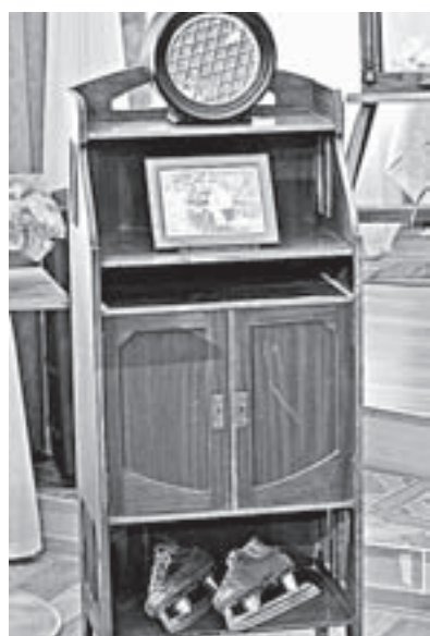
Буфет из семьи поэта.

В наши дни в городах-селах края в музеях и школьных, и государственных, и частных формируются «ностальгические» экспозиции. Не однажды многим приходилось видеть уголки крестьянского быта, купеческие гостиные, кабинеты горных инженеров, интерьеры сталинок и хрущёвок. Все понимают, что эти экспозиции не только сообщают информацию утилитарного свойства, но и дают представление о культурном коде поколений, социальных слоев, нации. Потому абсолютно закономерен и постоянный