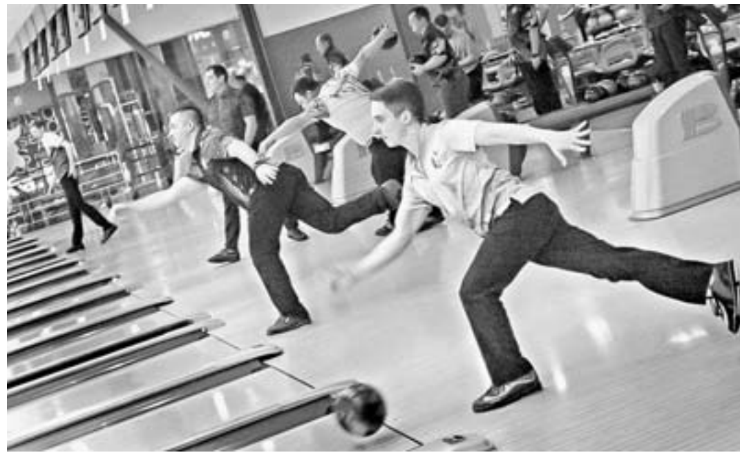
Боулинг – это не только вид спорта, но и отличный способ отдохнуть.

«Алтайская правда» борется в первой. А еще есть вторая лига, Премьер-лига, банковская, Лига «Русского продукта» и Лига Союза риэлторов Барнаула и Алтай. В каждой из них