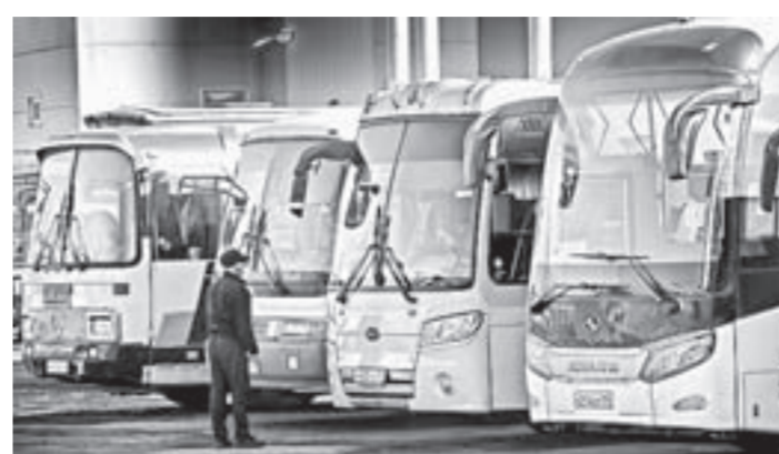
Автобусы оснащены аппаратурой спутниковой навигации.

– Требовалось установить новые приборы с мультиспектральной сим-картой, дающей возможность перехода на ту сотовую связь, которая присутствует на том или ином участке дороги. Покупка одного