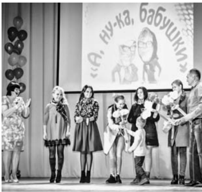
Современные бабушки на бабушен совсем не похожи.

Выяснилось, что координаторы проекта «Непокорённые» ищут родственников уроженцев Алтайского края, которые погиб-