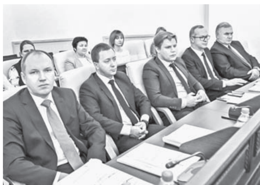
Новые члены правительства на сессии.

– По дефициту и расходам у нас замечаний нет, – сказал лидер фракции ЛДПР Владимир Семенов. – Но мы считаем, что в части доходов бюджет может быть иным. У фракции нет оснований голосовать против. Хотим отметить, что состоялся корректный диалог с прави-