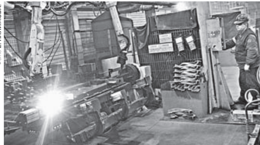
Пока роботы на «Алтайвагоне» варят только крышки для люков.

Более 70 миллионов рублей собирается инвестировать в модернизацию оборудования грузового подвижного состава – «Алтайвагон» в 2019 году.