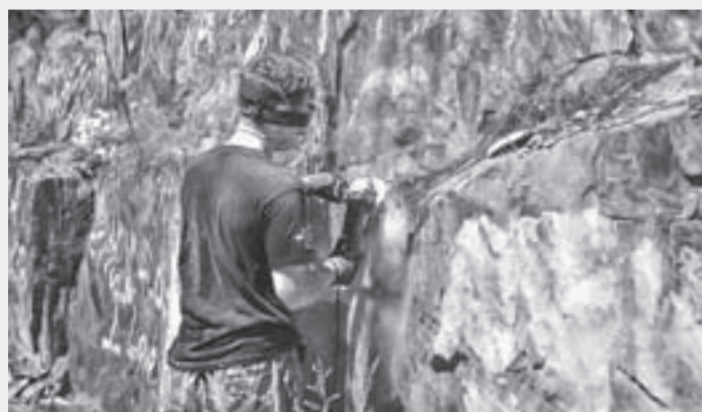
Стереть надписи со скал – занятие непростое.

3000 квадратных метров удалось очистить волонтерам в ходе проекта «Чистые скалы – достойные Алтайя». На днях в Минприроды края подвели итоги экологической акции.