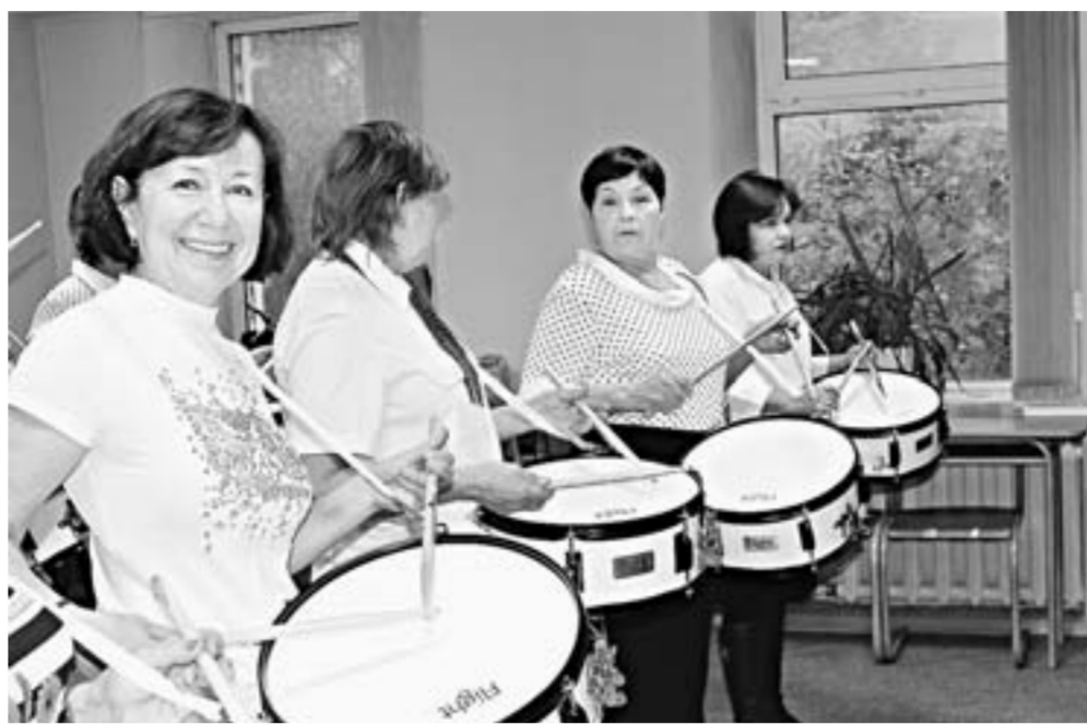
С веселым другом-барабаном.

Центр «Знание» подготовил соответствующий проект и вышел с ним на различные