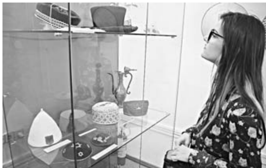
Выставка вызвала неподдельный интерес.

В Алтайском государственном краеведческом музее открылась выставка национальных головных уборов со всех уголков планеты.