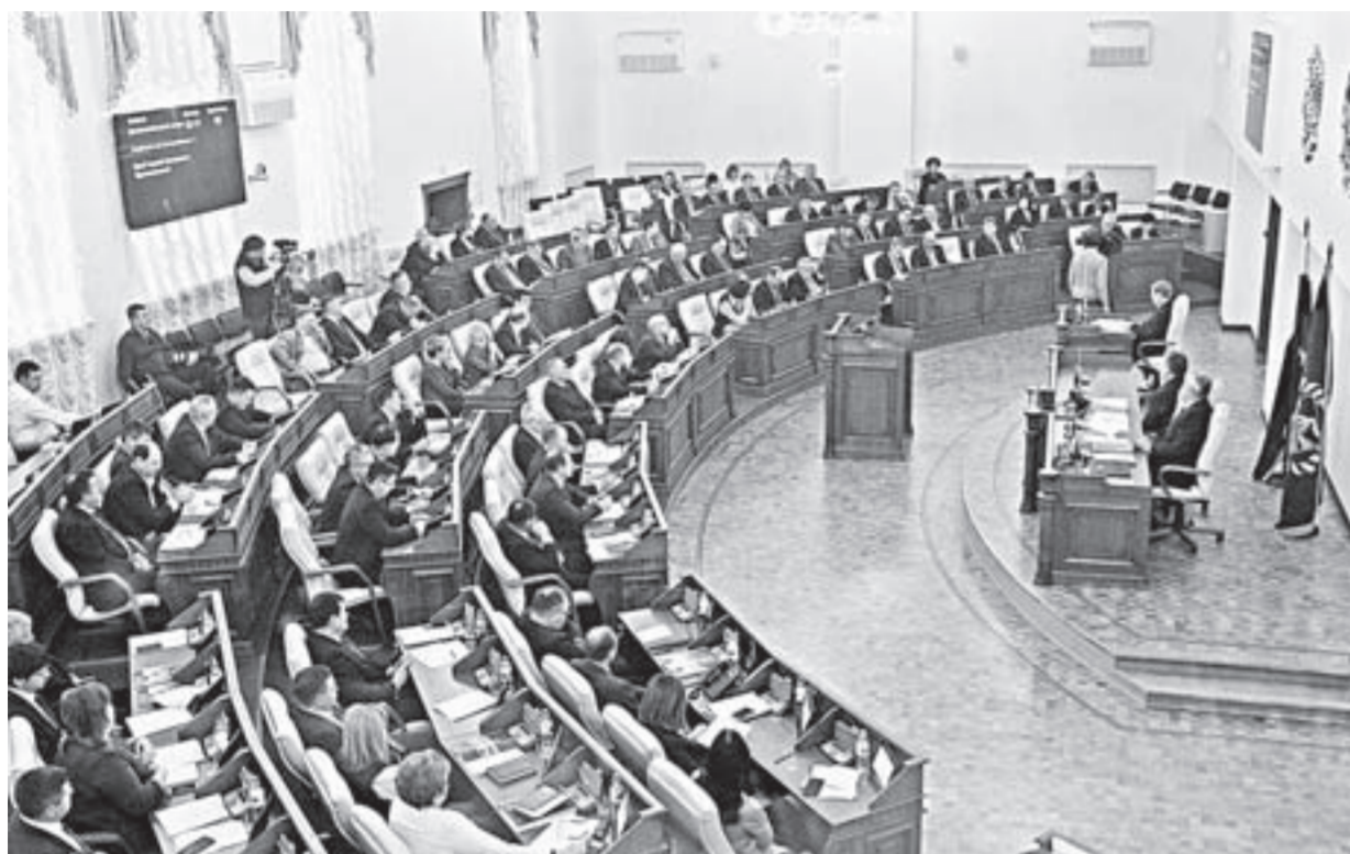
За главный финансовый документ в первом чтении проголосовали 52 депутата.

Депутаты в первом чтении приняли краевой бюджет на 2019 год и на плановый период 2020 – 2021 годов. Это был ключевой вопрос сессии Законодательного Собрания.