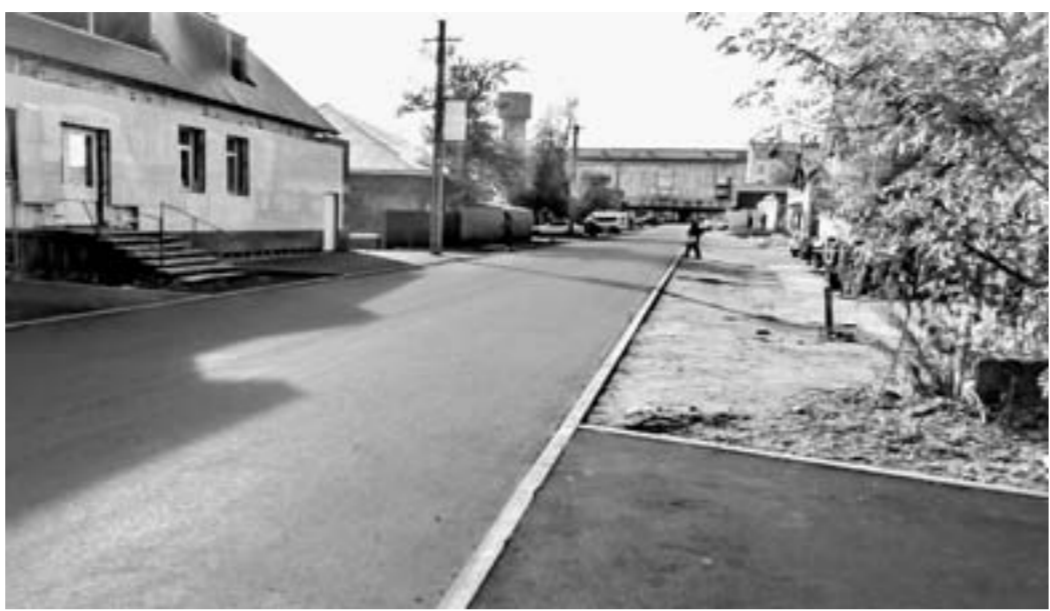
Теперь улицу Бытовскую траурной не назовешь.

В органы местной власти неоднократно поступали жалобы от горожан, не желающих жить на таком импровизированном кладбище. Улицы ведь расположена не где-то за Бийском, а в одном из густонаселенных микрорайонов. Недалеко от нее Бийский государственный колледж, Городской Дворец культуры, стадион «Прогресс», мкр-н Детский мир и другие востребованные народом места, но воз оставался все на