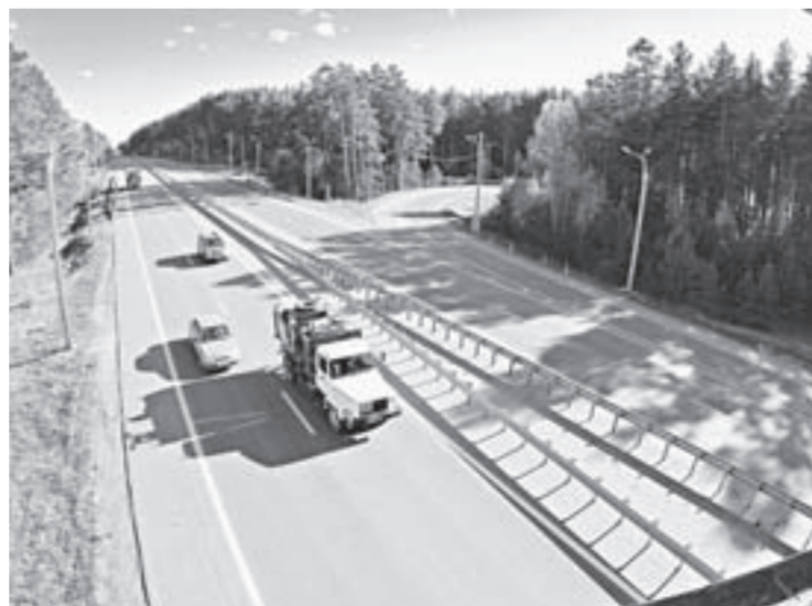
Отремонтированная дорога стала безопаснее для водителей.

12 октября алтайские дорожники торжественно ввели в действие участок федеральной трассы Р-256. Это стало завершающим этапом капитального ремонта 21-километровой дистанции от Бийска до поселка Чуйского.