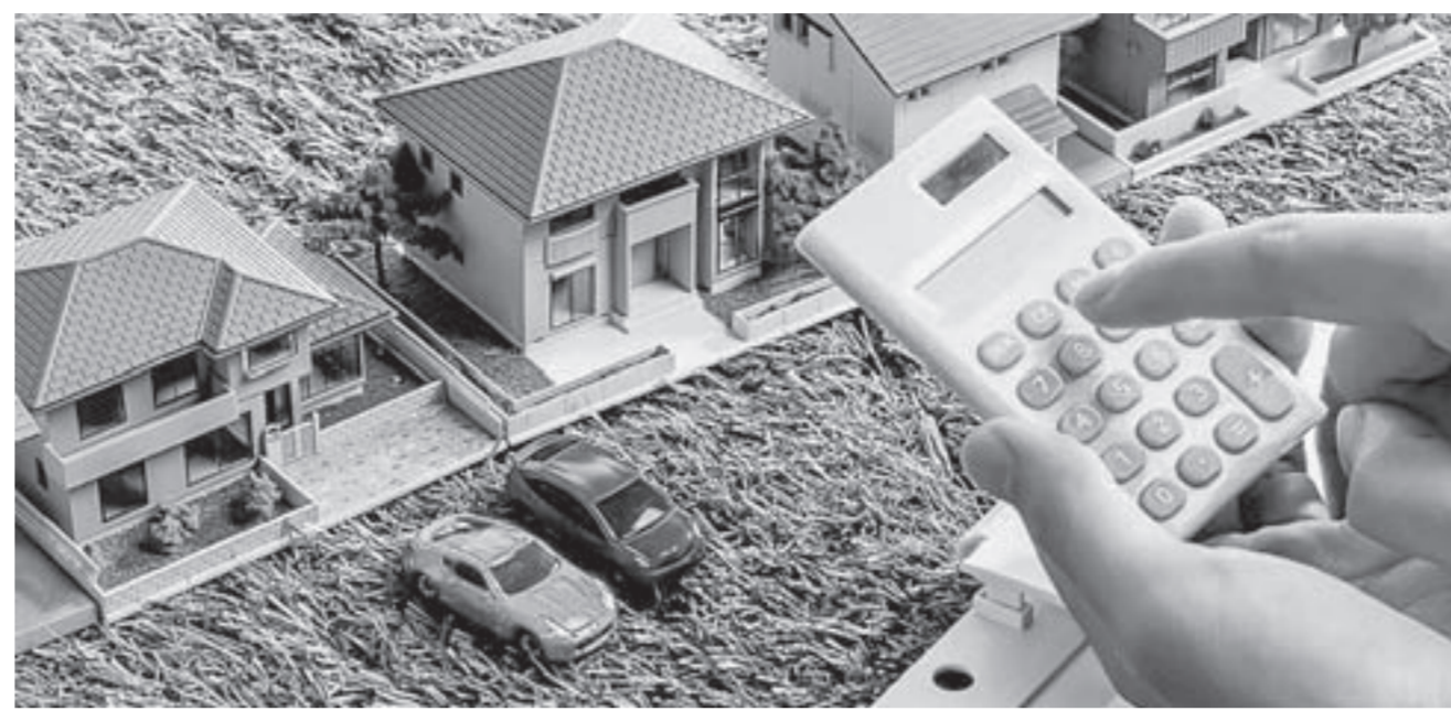
Лучше проверить с калькулятором, что вам насчитали в налоговом уведомлении.