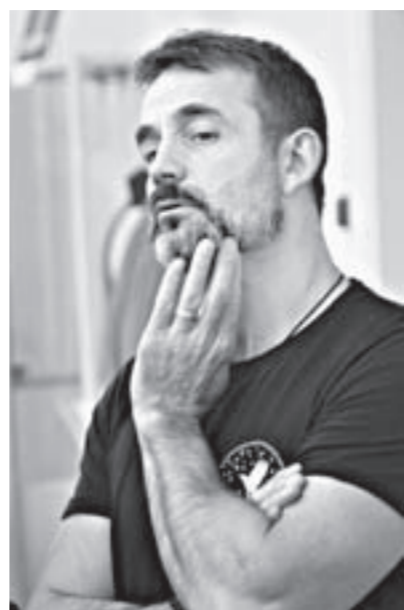
Актер Дмитрий Певцов.