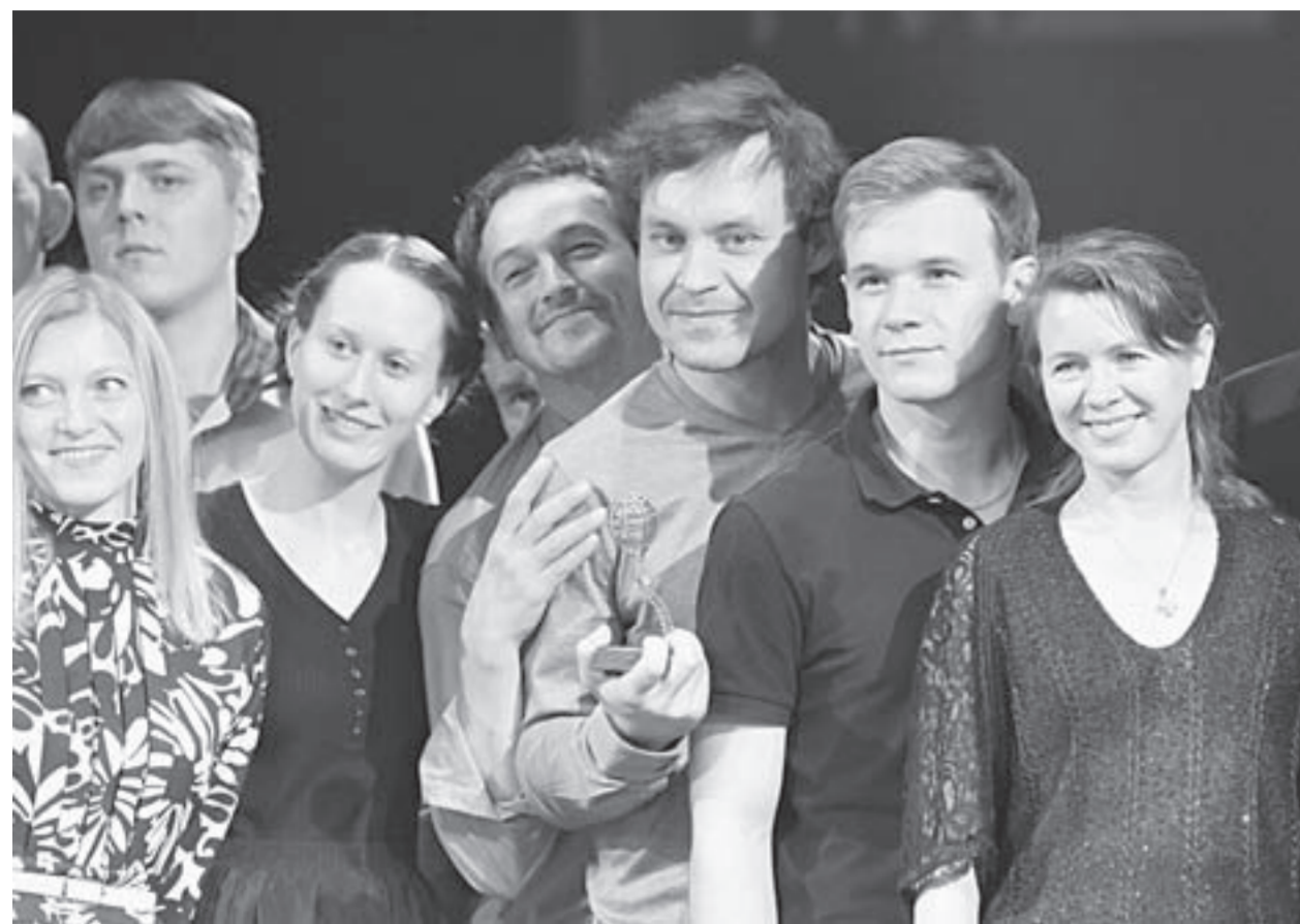
На церемонии закрытия фестиваля.

В воскресенье в Барнауле подвели итоги и вручили награды III Всероссийского молодежного театрального фестиваля им. В.С. Золотухина.