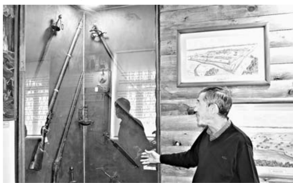
Музей гордится своей коллекцией русского оружия.

И вот это случилось! В Бийском краеведческом музее им. В.В. Бианки вновь из хранилища начали извлекать ружья, палаш и шпаги. Сегодня уже открыта часть экспозиции, посвященная истории Бийска, под названи-