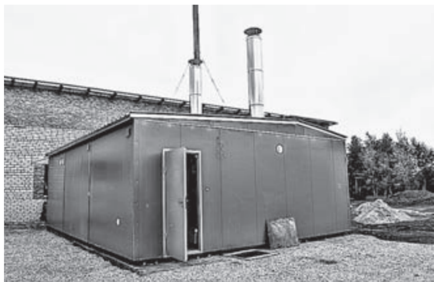
Новая модульная котельная.

Родинцы одними из первых среди сельских поселений приобрели на пробу котел-робот, провели эксперимент на его энергоэффективность и остались довольны. – Стоит котел два миллиона рублей, накладно для бюджета, но зато дымком из трубы идет белый и уголь сжигается полностью. Экономит такое оборудование топливо на 20 процентов, электроэнергию на 15 процентов, а управляется с котлами-роботами мо-