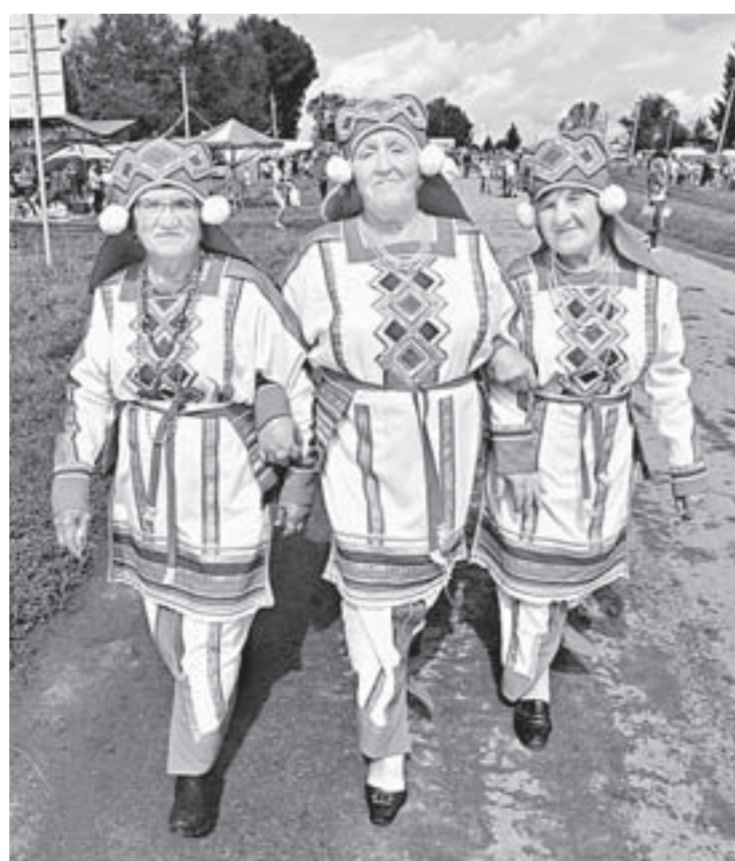
Радость жизни – на долгие годы.

В управлениях соцзащиты населения и краевых социальных учреждениях пройдут «горячие линии», «часы прямого провода», дни открытых дверей для пожилых.