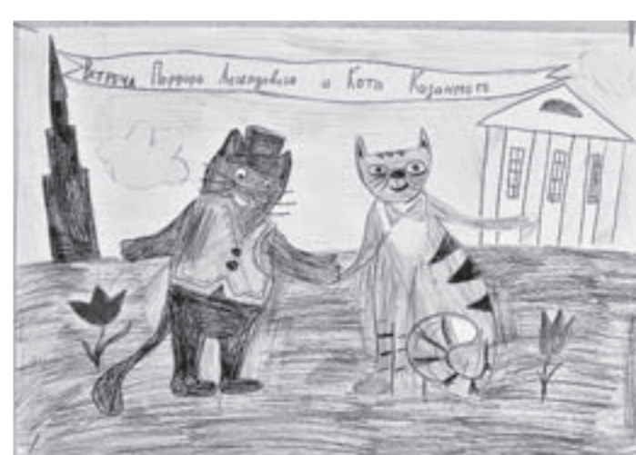
Казанский и барнаульский коты.