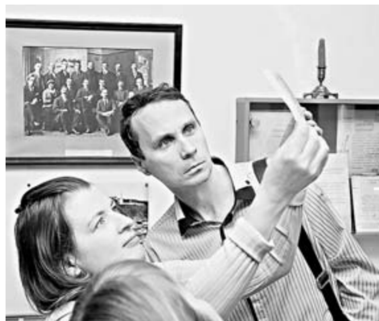
Барнаульцы узнали, как проверить подлинность банкнот.

Хабаровска выполнен в зелёном цвете, при наклоне блестящая горизонтальная полоса перемещается от середины вниз или вверх.