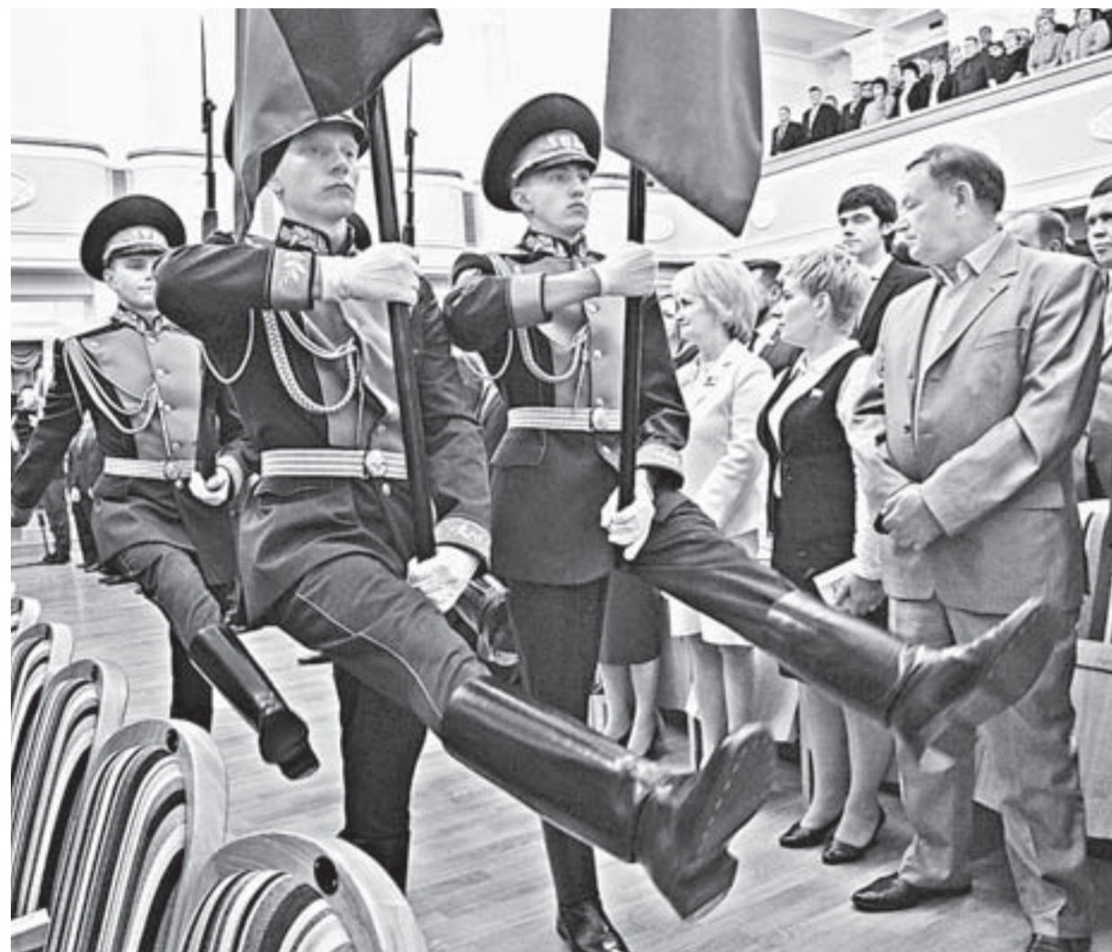
Торжественная церемония началась.