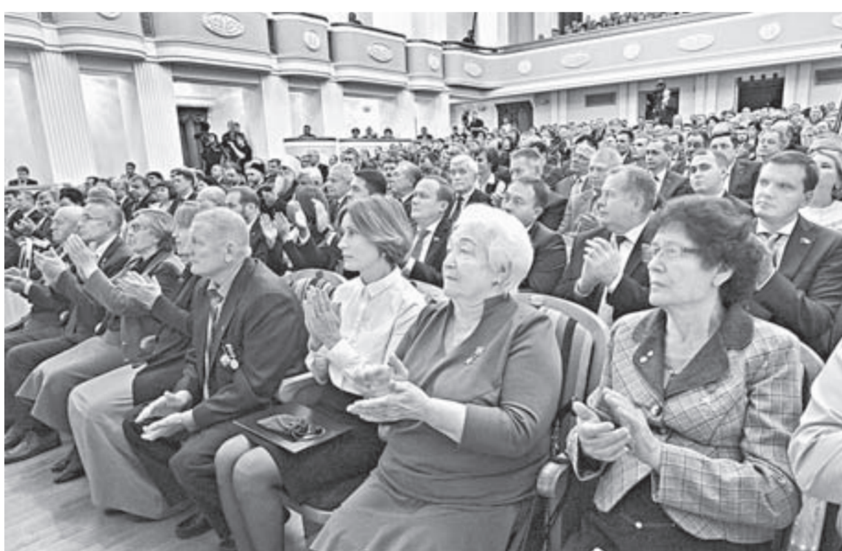
В зале МТА собралось около 500 почетных гостей.

– Люди связывают с вами свое будущее, свои ожидания на развитие экономики и социальной сферы региона, – заявил Сергей Меняйло. – Я хотел бы обратиться ко всем: только консолидируя усилия политических сил и институтов гражданского общества, мы с вами совместно сможем выполнить задачи, поставленные президентом страны в майском указе. Все они направлены именно на улучшение качества жизни