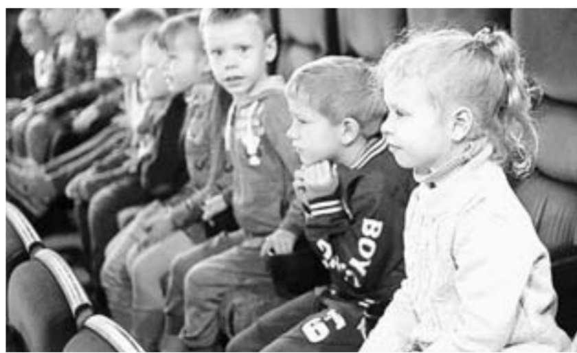
На спектакле Ханты-Мансийского театра кукол.

85 регионов России охватила программа «Большие гастроли» в 2018 году. Она подразделяется на несколько направлений: гастроли ведущих столичных театров, а также зарубежная, межрегиональная программы и обменные гастроли театров для детей и молодежи.