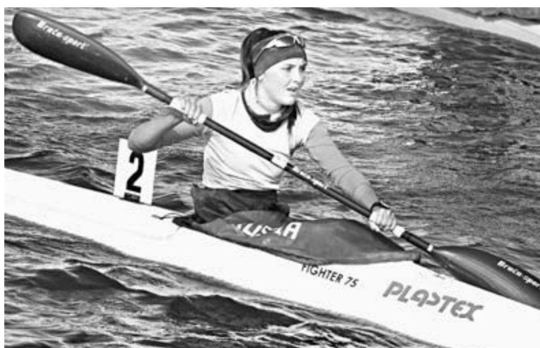
С волнами и ветром – на «ты!»

Будущие звёзды российского гребного спорта в минувшие выходные выступили на Всероссийских соревнованиях памяти Константина Костенко в Барнауле.