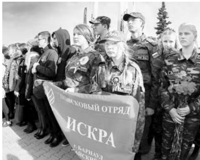
В крае немало поисковых отрядов.