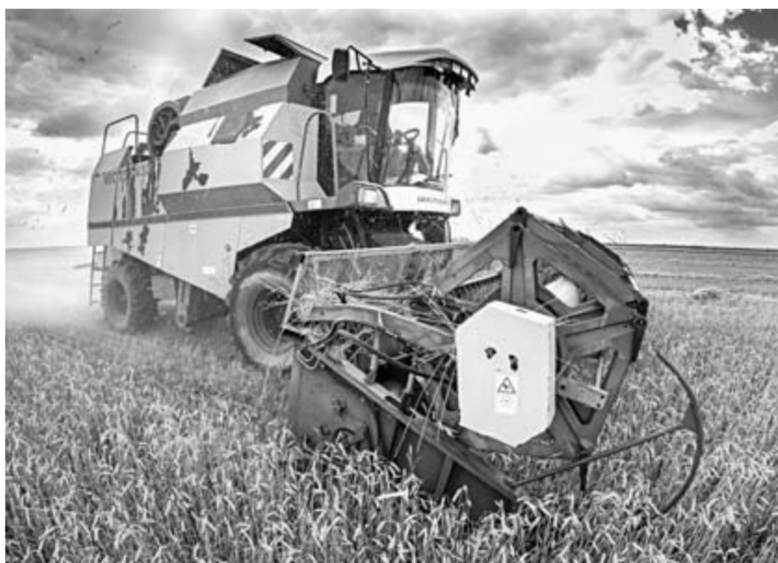
Солнечный день осенью дорог.