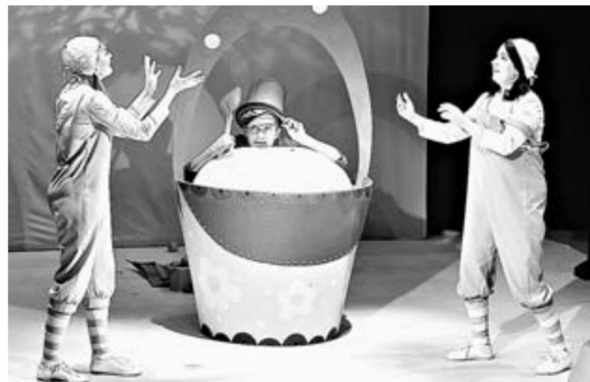
Обменные гастроли для театров – возможность показать свое искусство новому зрителю.