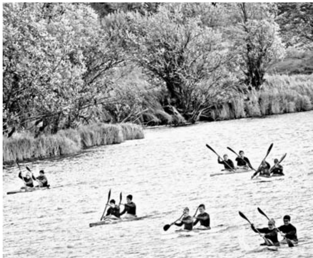
Экипажи уверенно устремились к финишу.