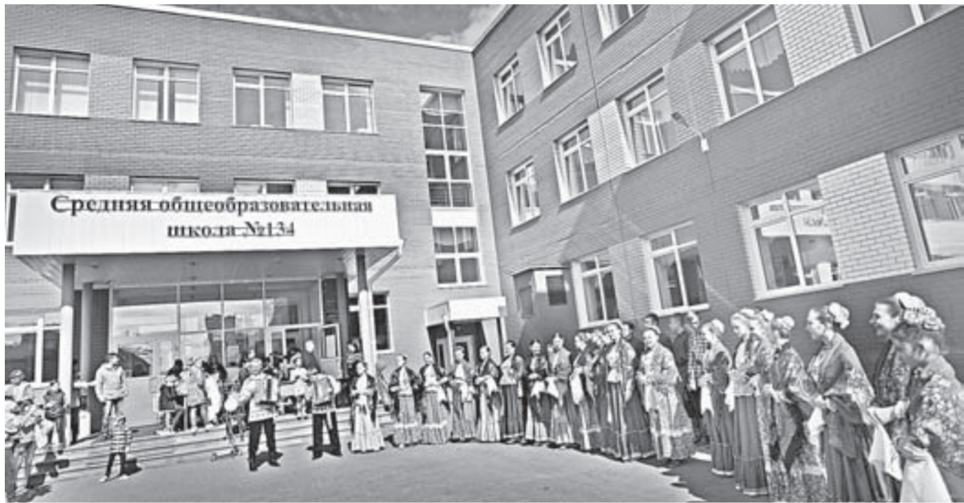
На избирательных участках постарались создать атмосферу праздника.