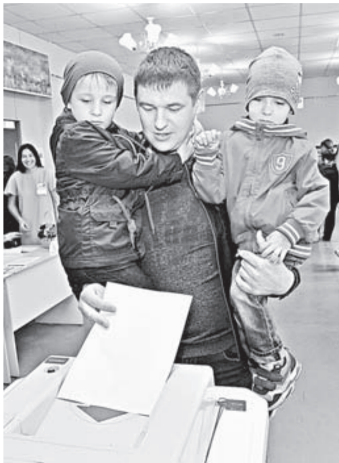
Голос – за будущее.