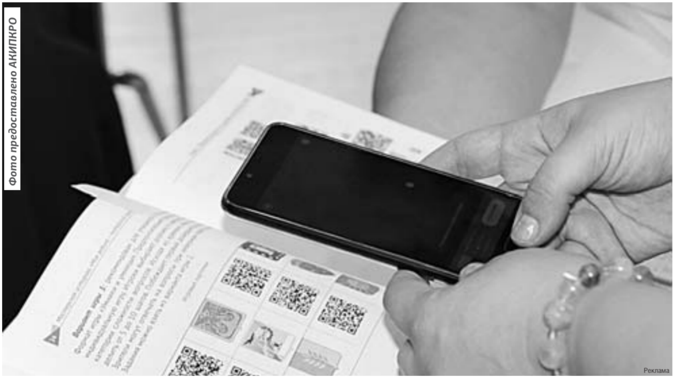
Страницы учебного пособия по истории Алтайского края «оживают».

инновационной площадки и проекта «Использование потенциала инновационных учебных пособий и ресурсов региональной электронной школы в целях повышения качества образования». Среди предлагаемых направлений сотрудничества – цифровая педагогика и мобильные образовательные технологии в образовании; граждановедческие и культурологические проекты с использованием ресурсов Президентской библиотеки; «цифровые каникулы» для учителей и школьников; микрообучение в целях популяризации возможностей электронного обучения, проектная и научно-исследовательская деятельность; использование возможностей технологий дополненной реальности в образовании и издательской деятельности; составление культурологических интерактивных карт; достижение метапредметных результатов обучающихся посредством формирования информационной культуры.