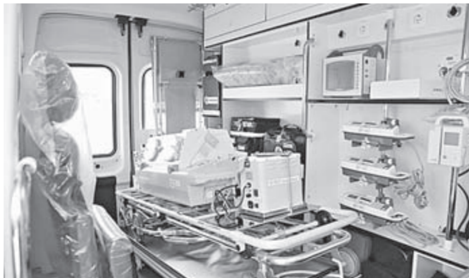
Новые специализированные автомобили оснащены по последнему слову техники.

По поручению президента России в Алтайский край поступают 25 автомобилей скорой медицинской помощи и 25 школьных автобусов. На эти цели выделены значительные средства из федерального бюджета.