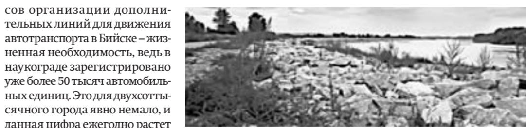
Когда-нибудь по дамбе помчатся авто.

соз организации дополнительных линий для движения автотранспорта в Бийске – жизненная необходимость, ведь в наукограде зарегистрировано уже более 50 тысяч автомобилей, что и затрудняет движение. – Дорога шириной 7 метров позволит решить вопрос загруженности городских дорог. По-