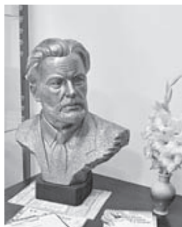
Цветы любимому писателю.