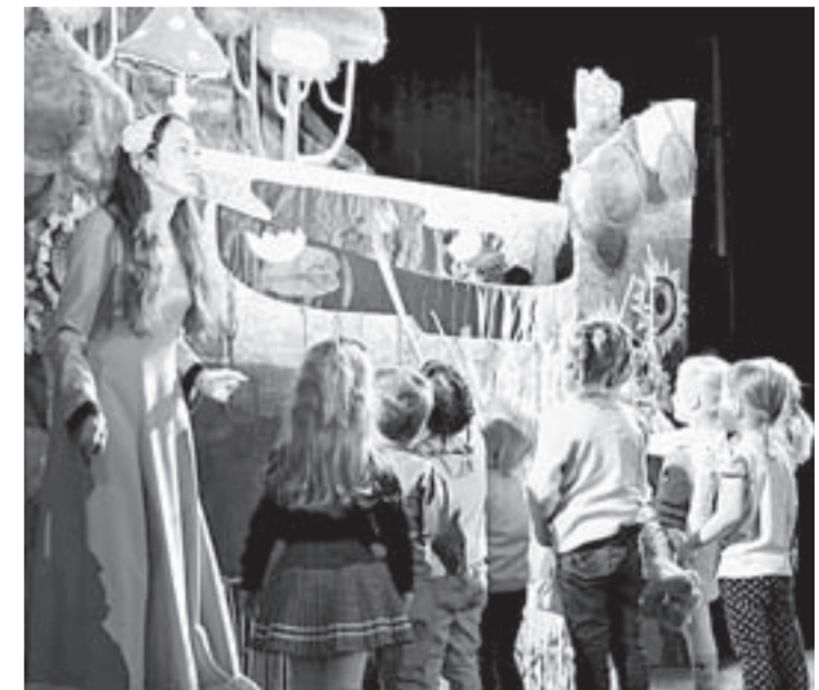
Спектакль «Гусенок». Театр кукол «Сказка».

8 сентября. 10.30, 11.30 – «Театр на подушках». «Мойдодыр» (0+). 12.00 – «Теремок» (0+). 9 сентября. 10.30, 11.30 – «Театр на подушках». «Муха-цокотуха» (0+). 12.00 – «Гусенок» (0+).