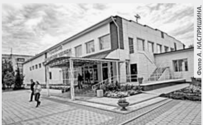
Рубцовский медицинский колледж.