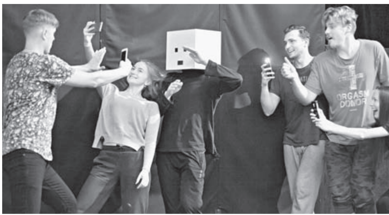
На репетиции спектакля Wonder boy .

– Наш главный герой с иронией относится к себе. Это совсем не похоже на пьесу «Оскар и Розовая дама»,