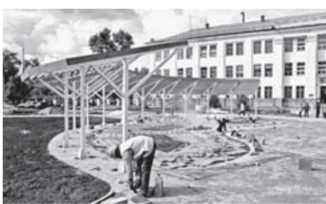
Благоустройство территории у Рубцовского аграрно-промышленного техникума.