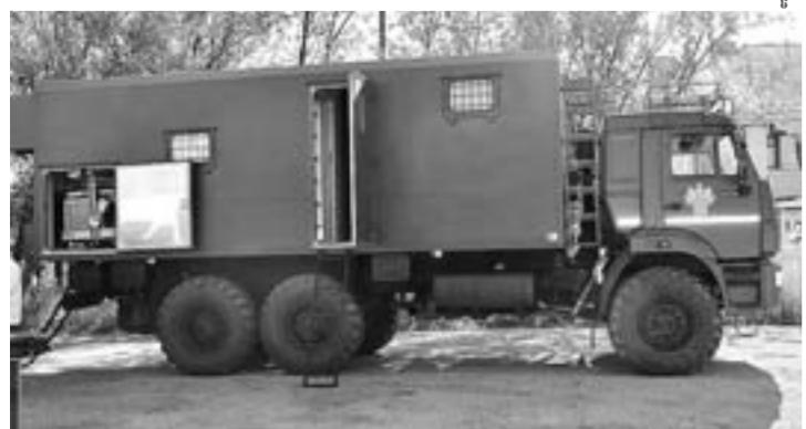
КамАЗ превращен в мобильный офис.