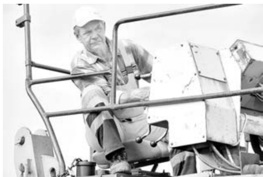
Дорожники обещают закончить ремонт на этой неделе.

К концу первой учебной недели дорожники отремонтируют полтора километра школьного маршрута, который находится на краевой трассе Крутишка – Чайкино – Быково в Шелаболихинском районе. Затраты на работы составят 12,5 миллиона рублей.