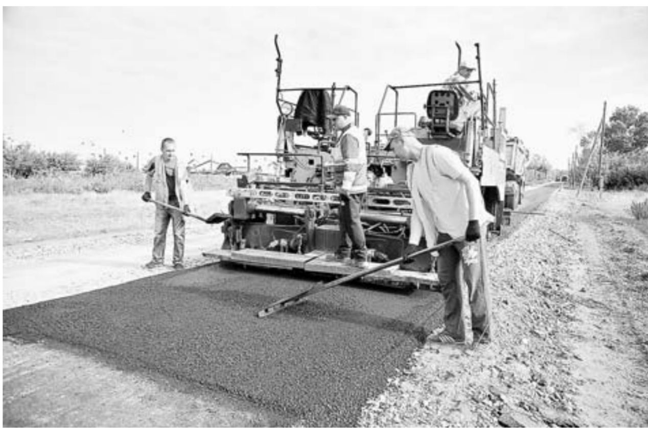
12,5 миллиона рублей потратят на школьный маршрут.

Нужно отметить, что крутишинцам повезло не только с ремонтом участка школьного маршрута. В черте населенного пункта будет уложен асфальтобетон, а школа уже