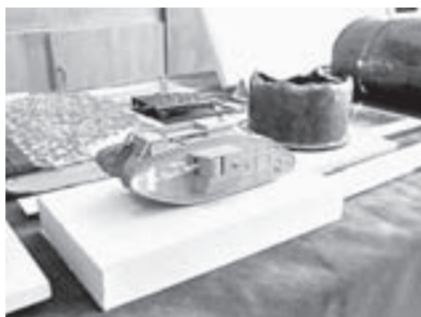
Экспонаты выставки – свидетельства далекой войны.