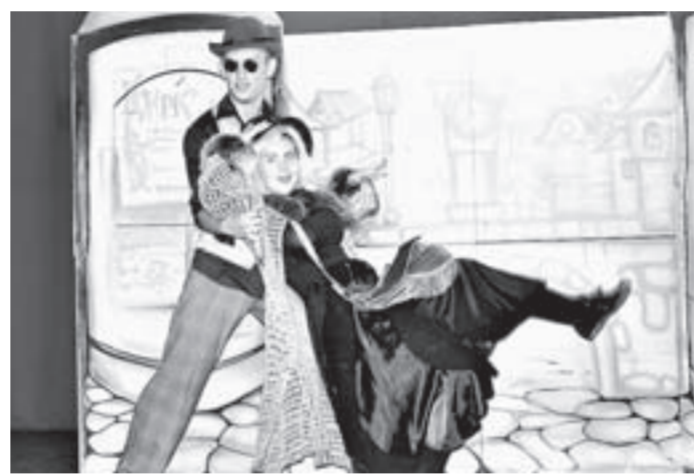
Лиса Алиса и кот Базилио неизменно вызывают смех у зрителя.