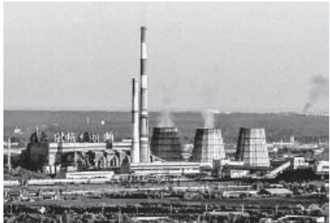
ТЭЦ-3 – самая большая и современная в регионе.

Запасы угля на крупнейшей в крае Барнаульской ТЭЦ-3 Сибирской генерирующей компании более чем вдвое превышают нормативный уровень.