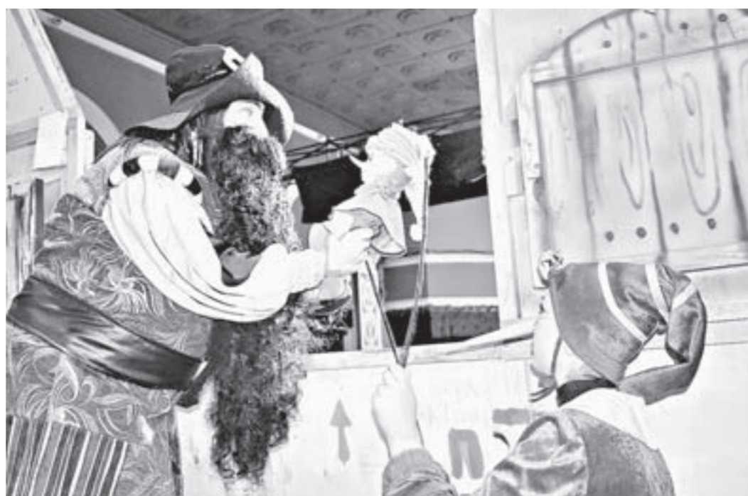
По ту сторону сцены.

Дальше – больше. С городским управлением культуры уже обсуждается будущий репертуар, направленный на взрослого зрителя. Не исключено, что сделают постановку по Василию Шукшину – у него есть великолепные пьесы для театра. Или в кукольном исполнении поставят «Сказ про Федота-стрельца» Леонида Филатова. Для этого нужно пополнение труппы. Сегодня актеров шесть, а требуется в два раза больше. И желательно с про-