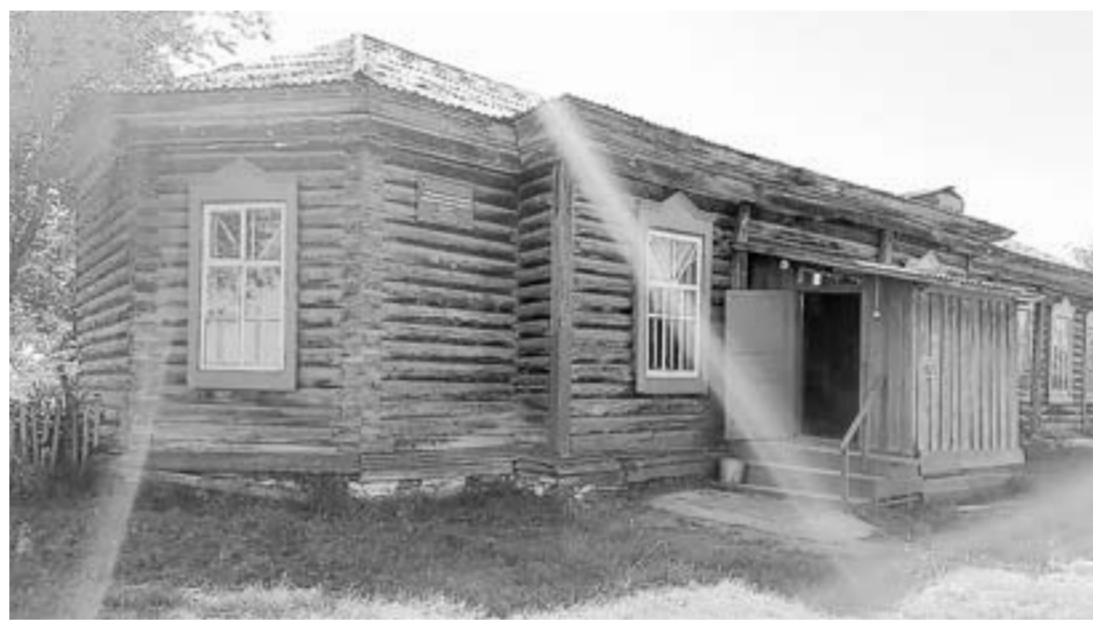
Школа в Дресвянке имеет все необходимое для учебы.