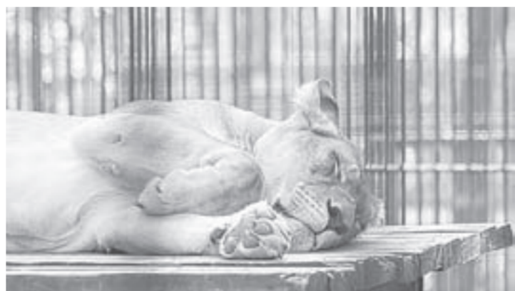
Лвица Ая решила вздремнуть перед обедом.