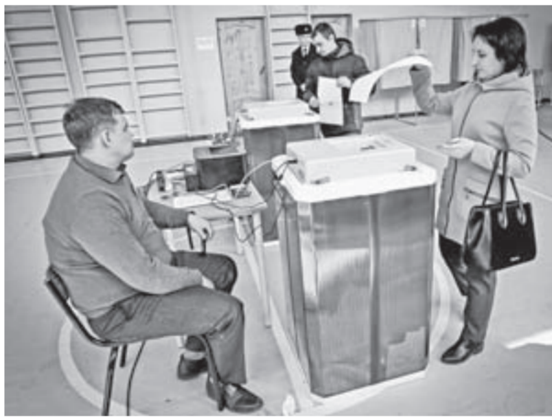
Независимые наблюдатели могут принять участие в сентябрьских выборах.