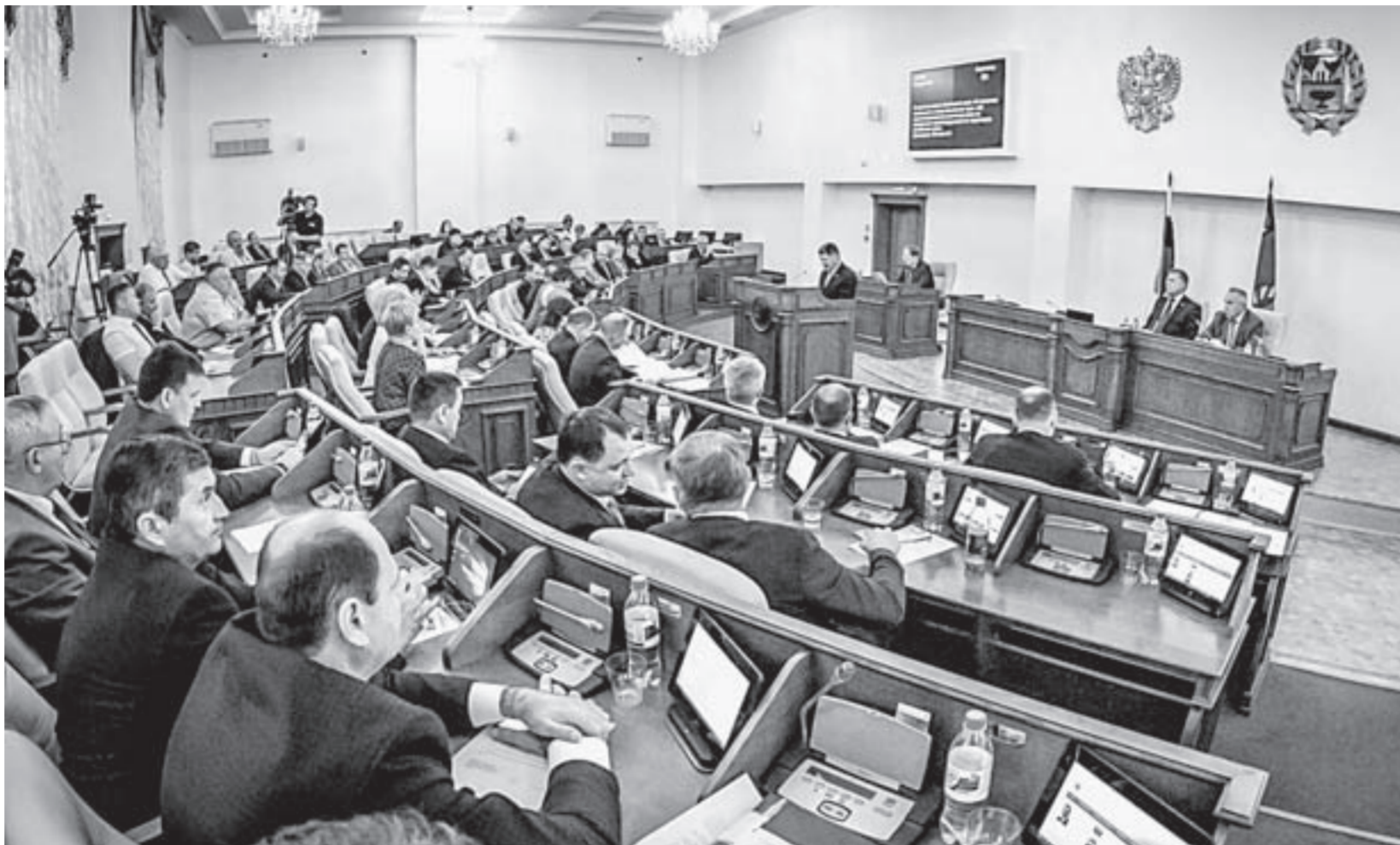
Ряд законопроектов, важных для края, был рассмотрен на сессии.

Кроме того, законодатели закрепили ужесточение административной ответственности за ненадлежащее исполнение государственных