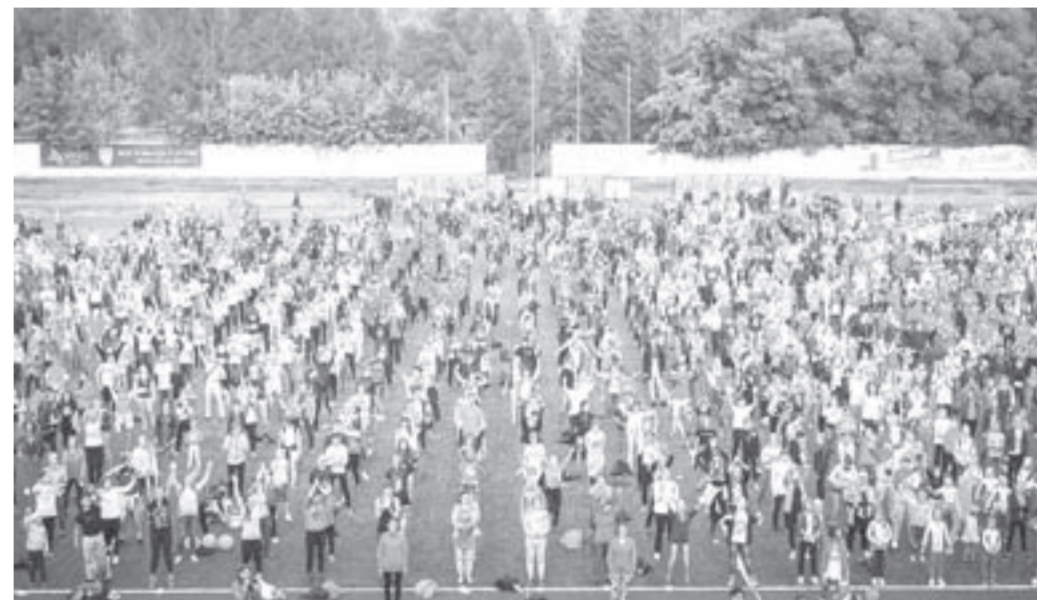
Барнаул претендует на звание самого спортивного города мира.

Завтра, 2 сентября, в барнаульском Парке спорта Алексея Смертина пройдет самая массовая городская тренировка.