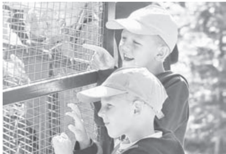
Настоящего льва мальчики раньше видели только по телевизору.