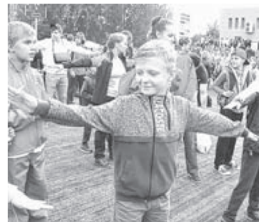
На зарядку приглашают всех желающих.

Организаторами акции также являются Правительство Алтайского края, администрация Барнаула, региональный Молодежный парламент.