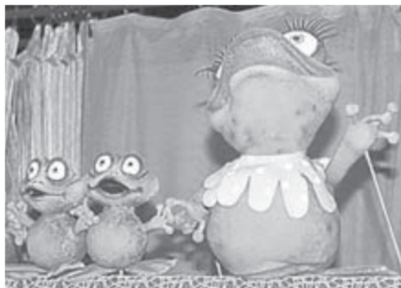
Главная героиня уверена: она – особенная.