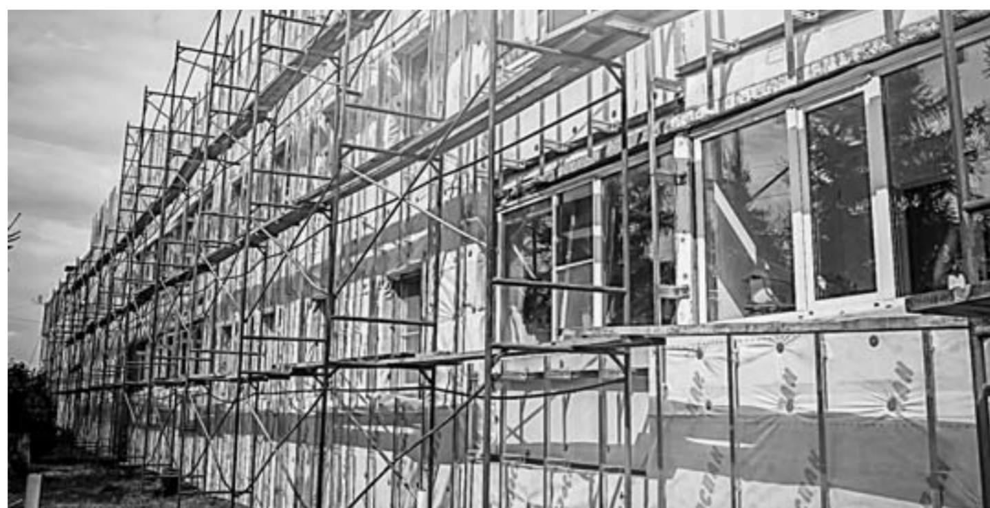
Дом уже на 40 процентов утеплен.

Региональная программа капитального ремонта в Алтайском крае реализуется уже четвертый год, все это время хозяйка квартир каждый ме-