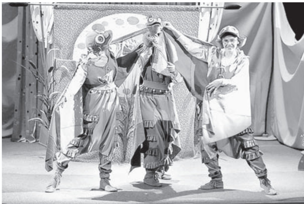
Официальная премьера этой веселой истории пройдет 1 и 2 сентября.