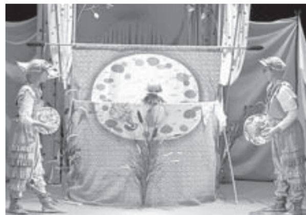
Спектакль увидят не только барнаульские дети.