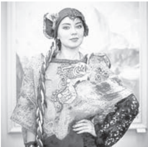
За конкурсные работы дизайнеров смогут проголосовать все желающие.

Краевой Художественный музей объявил о конкурсе молодых дизайнеров войлочного костюма «Носим русское».