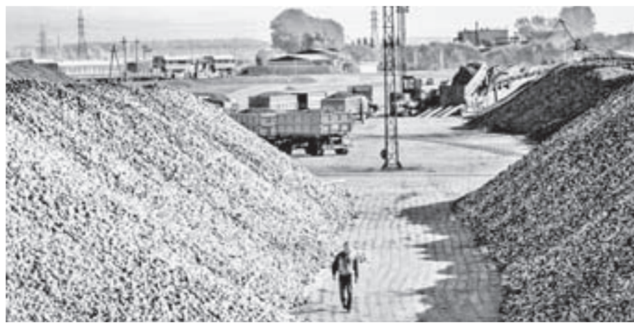
Основная нагрузка на заводе придется на конец сентября.

Черемновский сахарный завод приступил к переработке сахарной свеклы урожая 2018 года. Накануне аграрии Алтайского края начали уборку сладкого корня на полях, полученный урожай отгружается на перерабатывающее предприятие.