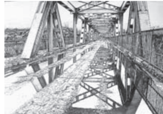
Юрий Гребенщиков. «Старый мост через речку Обь в Барнауле» (2016).

ХУДОЖЕСТВЕННЫЙ МУЗЕЙ, ул. М. Горького, 16, тел. 50-22-29.