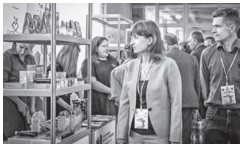
На форуме представили продукты мараловодства.