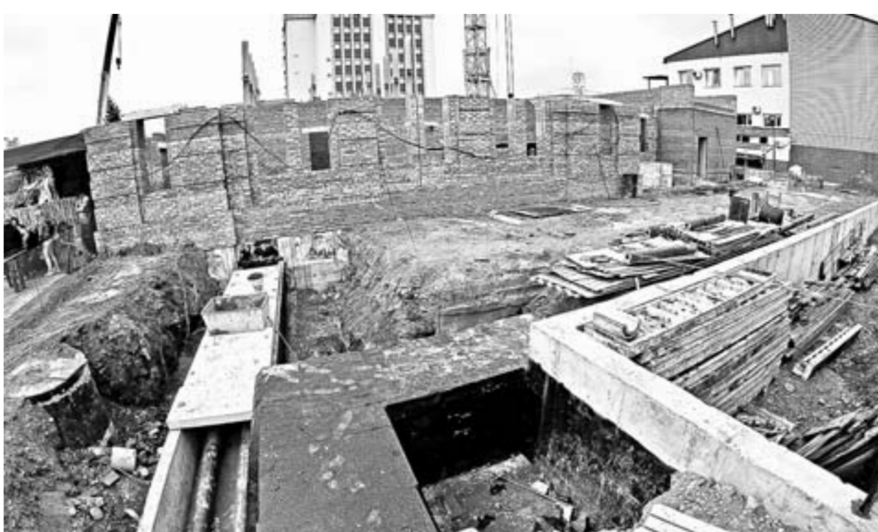
До конца года строителям предстоит возвести два этажа и приступить к внутренним работам.