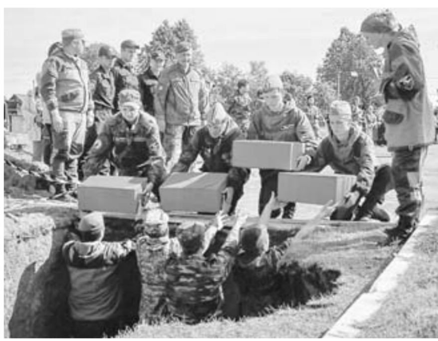
Мясной Бор, 23 августа.