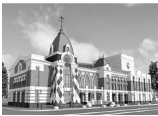
Здание должно быть готово следующим летом.