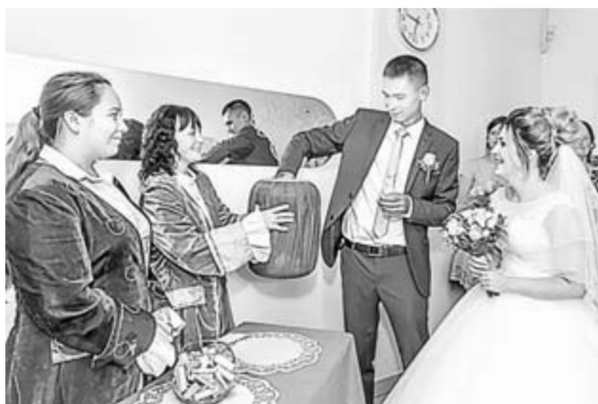
Молодоженов ждали разные конкурсы.

Вернемся же к сюрпризам, которые подготовили сотрудники отдела ЗАГС для молодоженов. В зале ожидания жениха и невесту ждали не только интересные испытания. Маленькими чайными ложечками будущие муж и жена должны как можно быстрее напол-