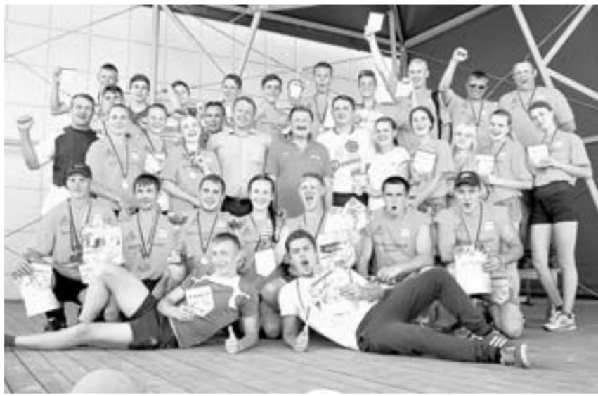
Организаторы и участники соревнований.

Благодаря поддержке управления спорта и молодежной политики Алтайского края соревнования имеют статус краевых. На состязаниях ра-