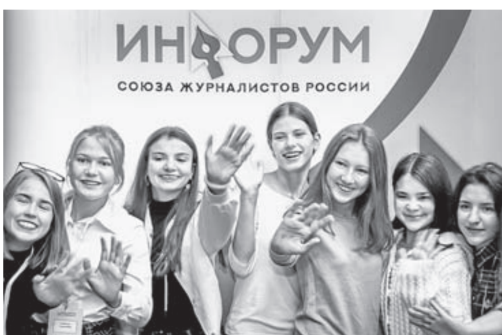
Среди участников «Инфорума» было много молодежи.

– Информационное поле в крае правильно и грамотно организовано, чтобы иметь