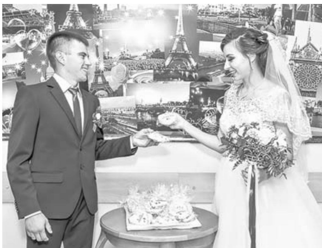
Какие пожелания спрятаны в имбирном печенье?