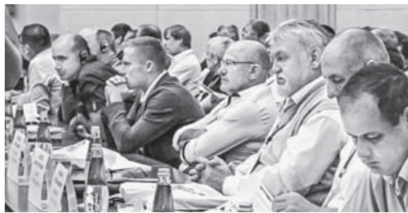
В работе конгресса приняли участие эксперты со всего мира.