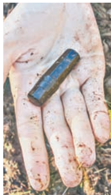
На ладони – чья-то жизнь...

В крае несколько поисковых отрядов. Это «Память», «Высота», «Искра»; «Поиск» (Краснощековский район); «Поиск» и «Русич» (Белокуриха); «Алтай» (Табунский район); сводный школьно-студенческий поисковый отряд «Сибиряк».