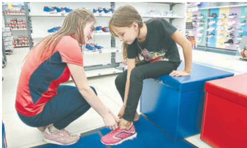
Кроссовки для урока физкультуры не должны быть впритык.

комплект: лосины, шорты, майку. Все вместе это стоит примерно 1800 рублей, но прослужит весь год, я в этом уже убедилась. Прихватила также еще трикотажные тепленькие лосины, стилизованные под джинсы, по скидке за 800 рублей.