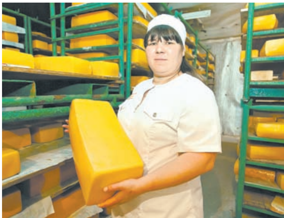
На складах алтайских сырзаводов скопилось немало продукции.

Анализ производства и потребления показал, что за последние пять лет молочные компоненты либо импорт молочных продуктов в России выросли с 3,8 до 4,9 млн тонн. «Получается парадокс. С одной стороны, в стране дефицит товарного молока, с другой – перепроизводство из