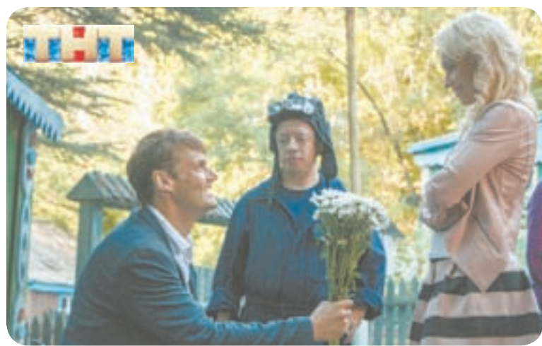
18.10 Х.ф. «ЖЕНИХ» (12+)

04.50 Т.с. «Лорд. Пёс-полицейский» (12+) 06.45 «Сам себе режиссёр» 07.35 «Смехопанорама» Евгения Петросяна 08.05 Утренняя почта * 08.45 Вести – Алтай. События недели 09.25 Сто к одному 10.10 «Когда все дома с Тимуром Кизяковым» 11.00 Вести 11.20 Т.с. «Сваты-2012» (12+) 13.25 Х.ф. «Несладкая месть» (12+) 18.00 «Удивительные люди-3» 20.00 Вести недели 22.00 «Воскресный вечер с Владимиром Соловьёвым» (12+) 00.30 «Дежурный по стране». Михаил Жванецкий 01.25 Д.ф. «Патент на Родину» (12+) 02.25 Т.с. «Пыльная работа» (16+)