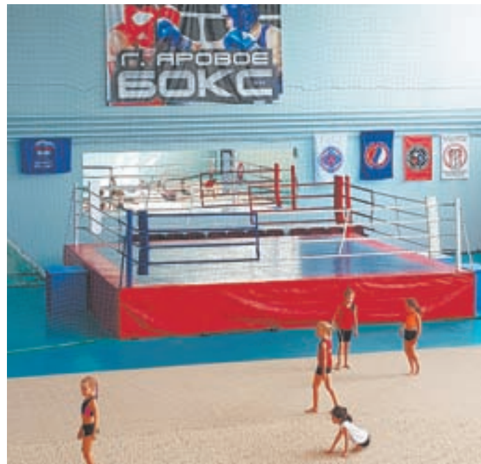
В игровом зале.

Когда-то аварийное здание спортзала профессионального лицея № 39 в г. Яровое сегодня трудно узнать. Теперь это новый спортивный объект – Детский центр единоборств с отремонтированными и оборудованными современными спортивными снарядами залами бокса, восточных единоборств и игровым залом для массовых мероприятий. А самое примечательное состоит в том, что это сооружение подарили всем любителям спорта сами жители.