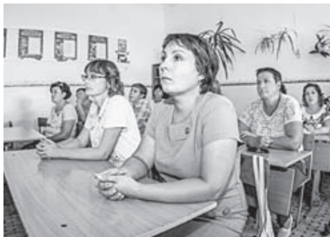
Педагоги школы в Тюменцево готовы к началу учебного года. Штат полностью укомплектован.