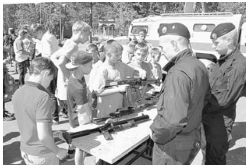
Бойцы ответили на вопросы.