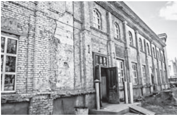
Зданию уже давно требовался капитальный ремонт.

Сейчас уже тяжело представить себе те условия, в которых работал молодой театр. Единственное производственное помещение — под сценой. Там находились костюмеры и реквизиторы, парикмахеры и буфаторы, там же располагалась единственная гримерка, вернее, уголок для акте-