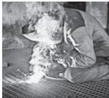
Главные действующие лица — строители.

нению архитектурной формы здания. Задача строителей в том, чтобы не внести что-то свое, а сохранить то, что было до нас.