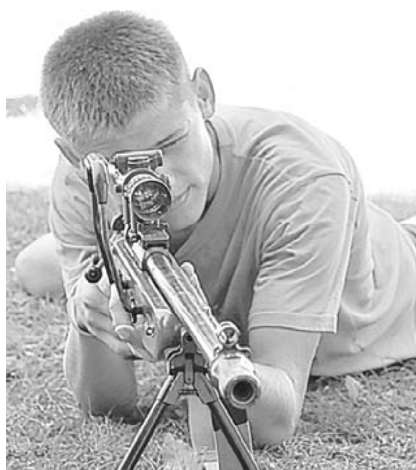
Ребята смогли подержать оружие в руках.

Во Всероссийской акции Росгвардии «Прокачай лето!» приняли участие дети из алтаиских загородных лагерей отдыха.