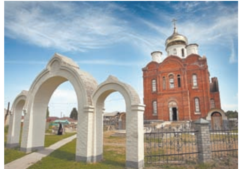
Храм Иоанна Кронштадтского возводят на месте сельской церкви, уничтоженной в 1936 году.

Удивила найденная деловая переписка, ее стиль. Подумать только, так писали друг другу купцы, чьи дома и магазины стояли на улице Миллионной (ныне 1 Мая)! «Милостивый государь, в ответ на ваше любезное письмо имею честь сообщить, что клепка у меня на складе хотя и имеется в достаточном количестве, но только исключительно первого сорта, цена не менее 75 копеек..., а второго сорта боле не осталось... Недели через две у меня получится большая партия по очень недорогой цене.