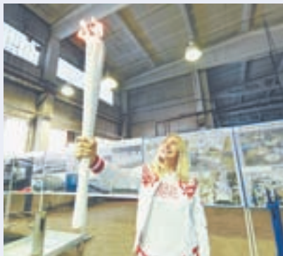
Факел для XXIX Всемирной зимней универсиады сделан.

♦ Для гостей Универсиады подготовили новый комплекс общежитий «Перья». Комнаты квартирного типа оснащены всем необходимым: в помещениях есть кровати, вместительные шкафы, письменные столы, кухонная мебель и санузлы. В рамках «ТИМ «Бирюса»» гостиницу протестировали 600 добровольцев и остались