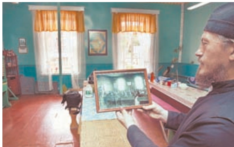
Церковно-приходскую школу восстанавливают по фото начала XX века.

«Объект» не раз подкидывал загадки, и не сразу удавалось ответить на вопрос: «Для чего это?» Когда под слоем настенной штукатурки в доме священника нашли паз, задумались, какой конструктивный элемент был в него врезан. Оказалось, проектом в сельском доме XIX века был предусмотрен теплый туалет. Но не это самое интересное. По санитарным нормам выгребная яма должна располагаться подальше от здания, но она – прямо под домом! Головокружение строителей? Отнюдь. П-образный периметр старинного фундамента подсказал, что надо искать дальше. Так обнаружили трубу, которая выводила биогаз из ямы в