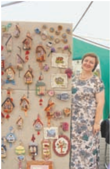
Сувениры из валяной шерсти.

– Я впервые на такой выставке-ярмарке, – рассказывает он. – Получил удовольствие от того, что многие мастера подходят к моим работам и удивляются, что у меня нет штамповки, я не иду вслед за модой. А ведь многие уже перешли на коммерческую основу. Я тоже пробовал, нашел в Интернете скульптуру из коряги, которая стоит 18 тысяч рублей, и принялся вырезать. Уже через два дня мне стало неинтересно. А вот любой корень, с которым я работаю по велению души, может занять меня так, что я не чувствую времени, даже поест, отдохнуть забываю. Так что коммерция не мое. И в основном ничего не продаю, потому что жалко, такого уже никогда не повторишь.