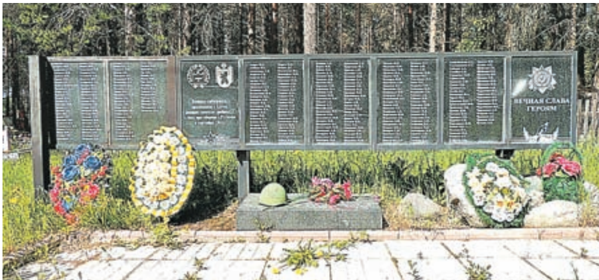
Памятник павшим бойцам Сибирского батальона у села Ругозеро.