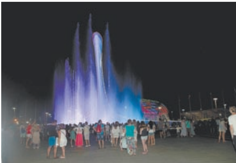
На стадионе «Фишт» главный аттракцион – музыкальный фонтан.

Целый день она с улыбкой закликает потенциальных клиентов: