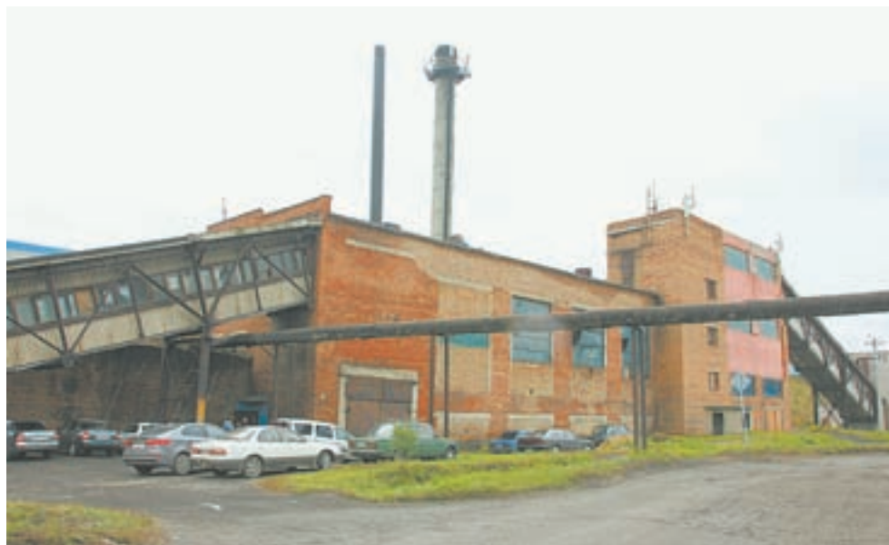
На каменских котельных за долги отключено электричество, ремонт ведется в сложных условиях.