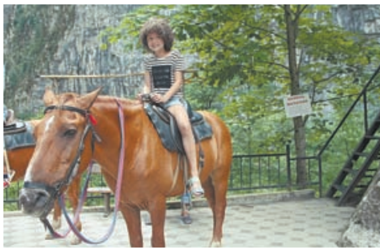
В Абхазии вам предложат покататься и сфотографироваться на лошади и в национальных костюмах.

В дождливые дни, которые в Сочи случаются не так редко, парикмахеры, как и большинство уличных торговцев, сидят без работы. В это время зарабатывают