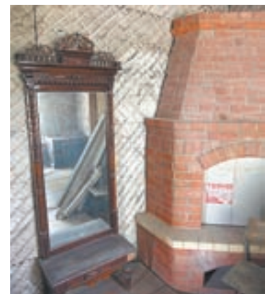
Быту священника будет посвящена одна из «живых» экспозиций духовно-образовательного центра.