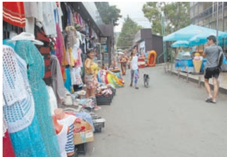
По пути к пляжу каждый среднестатистический турист тратит 300 – 500 рублей ежедневно.