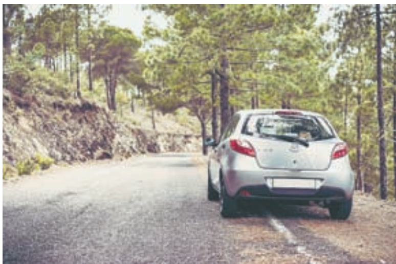
Поломка в горах чревата...

Постарались попросить о помощи местных жителей, которые двинулись в сторону села на лошадях, чтобы они прислали кого-то оттуда, на что последовало предложение заплатить две тысячи рублей (посмеиваясь и поплеывая семечки). Так как наличных у нас было мало, мы не могли их отдать. Так они и двинулись дальше.