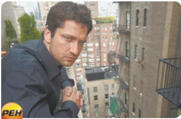
20.20 Х.ф. «ПАДЕНИЕ ЛОНДОНА» (16+)

05.15 Т.с. «Лорд. Пёс-полицейский» (12+) 07.10 «Живые истории» * 08.00 Документальный проект Евгении Паниной «Достоевский. Хроника каторги и любви» * 08.30 «Готовят все!» * 08.40 «Модная жизнь» 09.00 «По секрету всему свету» 09.20 Сто к одному 10.10 «Пятеро на одного» 11.00 Вести * 11.20 Вести – Алтай 11.40 «Юмор! Юмор! Юмор!!!» (16+) 14.00 Х.ф. «Подсадная утка» (12+) 18.00 «Привет, Андрей!» (12+) 20.00 Вести 20.50 Х.ф. «Верить и ждать» (12+) 01.20 Х.ф. «Стерва» (12+) 03.15 Т.с. «Личное дело» (16+)