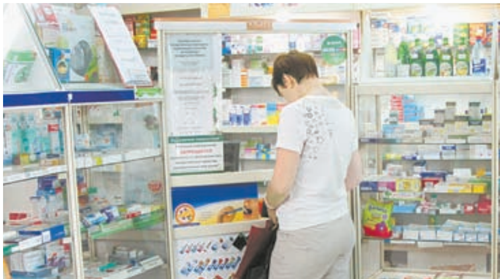
Стоимость отпущенных лекарств на одного федерального льготника – 12 678 рублей в месяц.

сердечно-сосудистыми заболеваниями. А ведь такое решение затем может обойтись человеку действительно дорого.