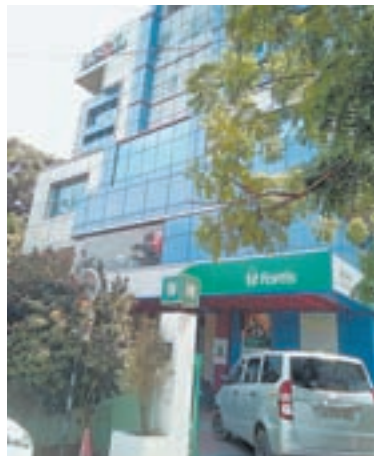
Госпиталь «Фортис Малар».