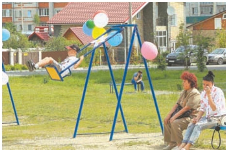
Городская среда Новоалтайска преобразуется.

В этом году мы закончим работу по благоустройству бульвара. Работы ведутся интенсивно и с опережением графика.