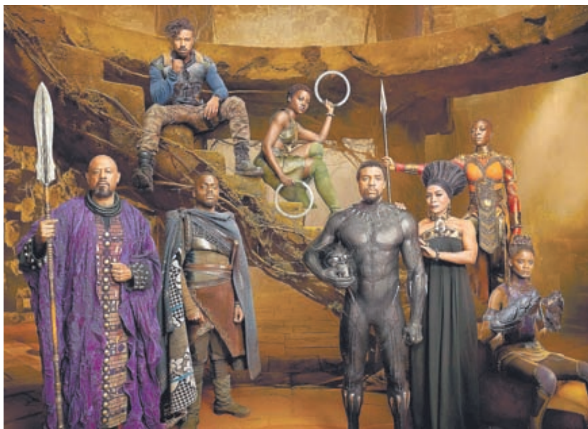
Все основные роли в фильме «Чёрная Пантера» сыграли темнокожие актеры.

По-видимому, вопрос в расовых моментах. Практически все роли сыграны темнокожими актерами, а сам главный герой – воплощение мечты любого народа, подвергающегося дискриминации. Именно эта составляющая стала основой для положительных отзывов. Противники ленты же оценивают фильм с точки зрения экшена, использования графики, организации постановочных боёв. Фильмов и мультфильмов про приключения Черной Пантеры снято немало. Надо сказать, что и персонажи, которые носят это имя – разные. Объединяет их одно – все они связаны с мистическим африканским государством Ваканда. Вначале королем и, соответственно, Черной Пантерой является Т'Чакка (Джон Кани), затем, после его гибели, миссия охраны чудесной страны переходит к его сыну Т'Чалле (Чедвик Боузман). Своя роль в обеспечении новыми информа-