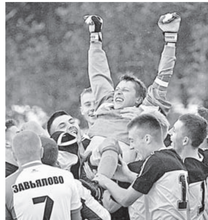
Прекрасный миг победы.