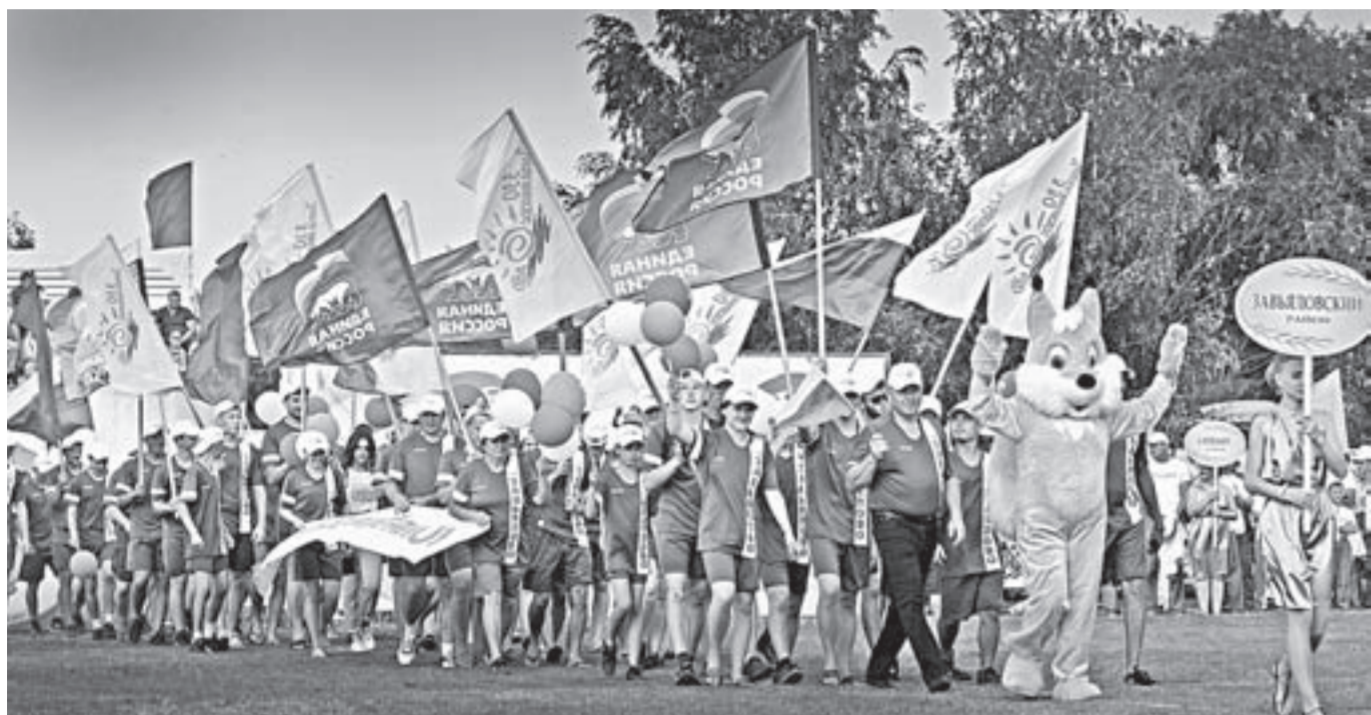
На параде открытия – делегация Завьяловского района.

Драйв борьбы на легкоатлетических дорожках красавца стадиона, драматичные футбольные матчи, исход которых решался в серии пенальти, неистовые болельщики. Всем этим запомнится 40-я летняя олимпиада сельских спортсменов Алтая, прошедшая на минувшей неделе в селе Завьялово.