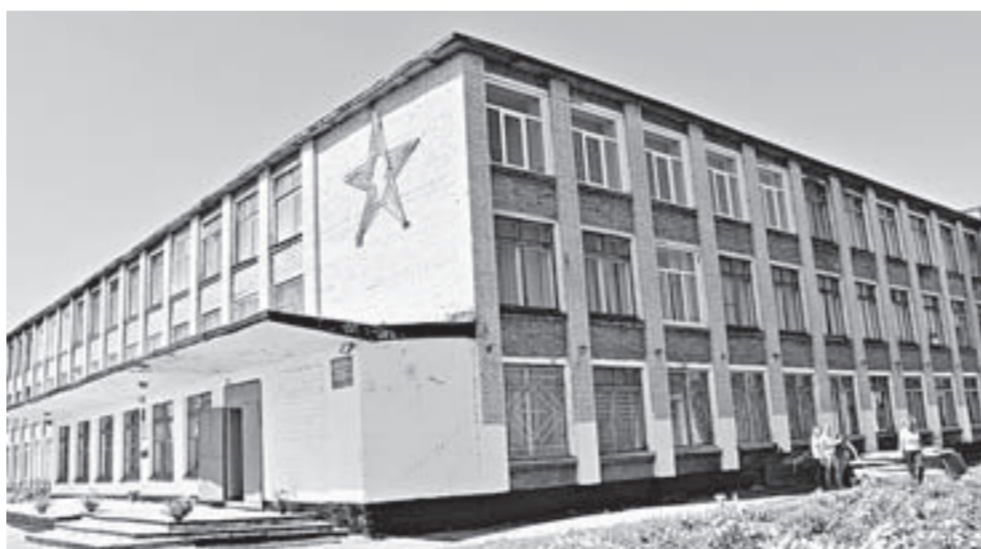
Сахарозаводская школа Павловского района и новому учебному году готова.

В этот день в Сахарозаводской школе побывал временно исполняющий обязанности заместителя министра образования и науки