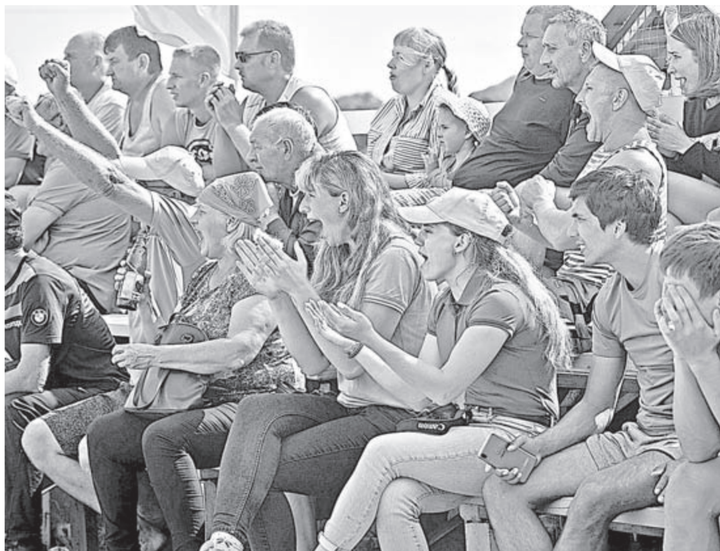
Для болельщиков получился настоящий праздник.

Фоторепортаж с олимпиады смотрите на сайте «Алтайской правды».