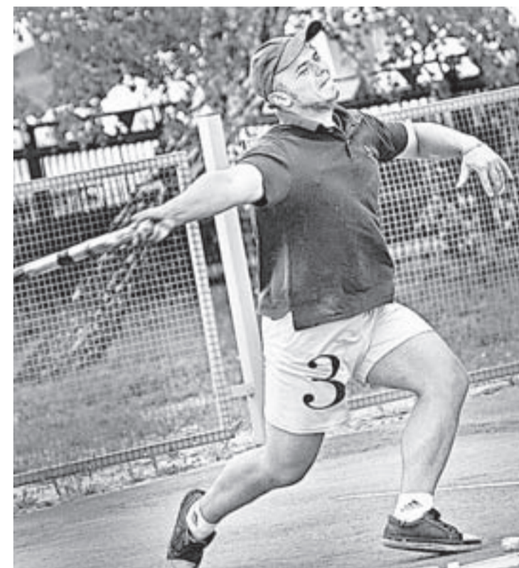
Битой по гордам.