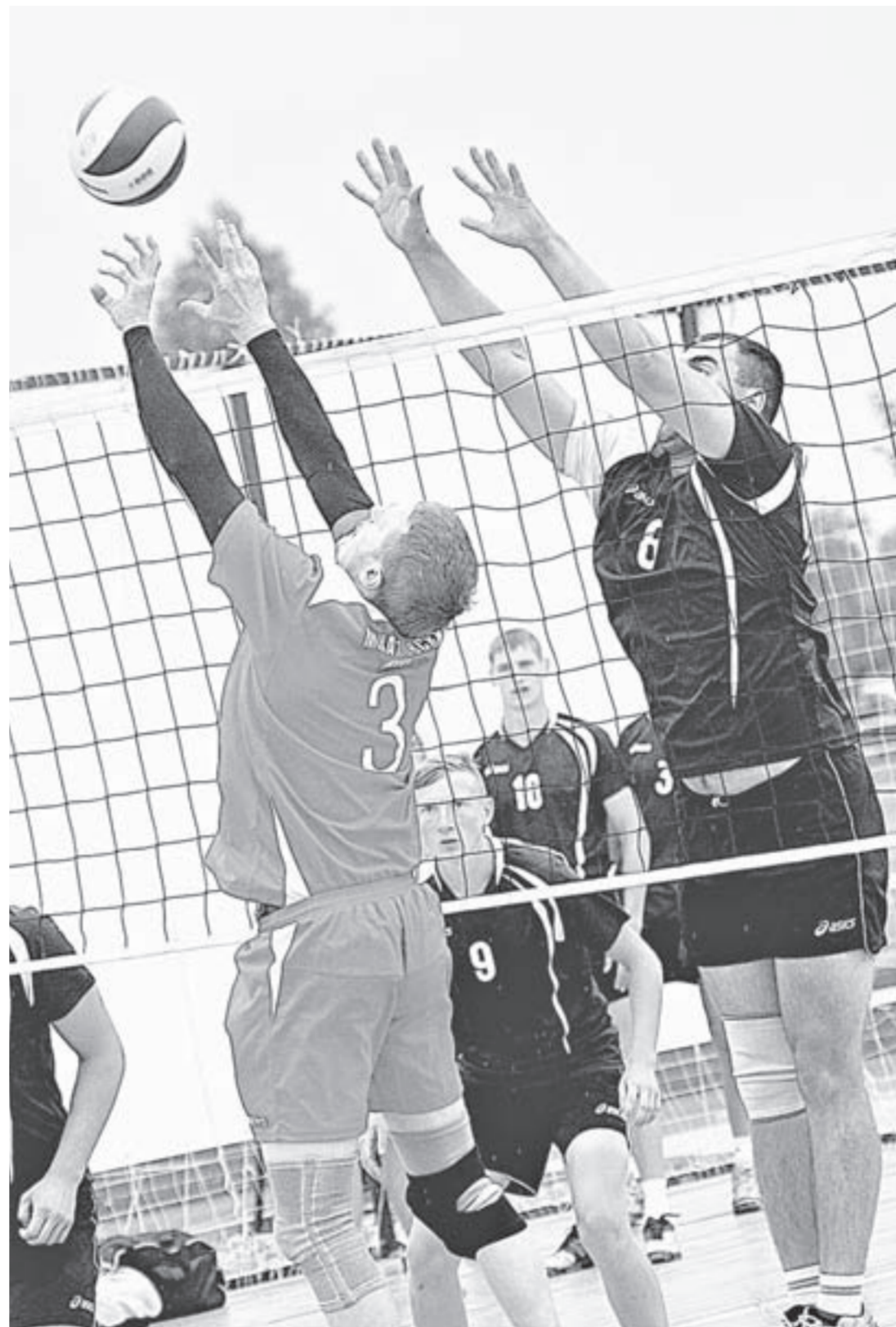
Врешь – не пробьешь!